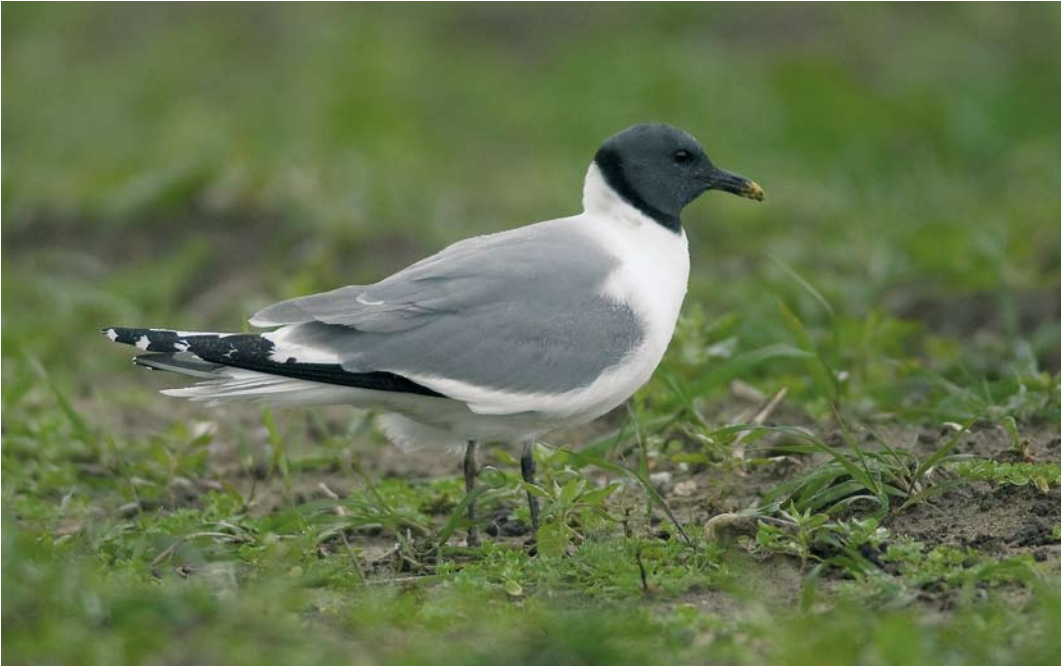
525 Vorkstaartmeeuw / Sabine's Gull Xema sabini , adult zomerkleed, Oudeschild, Texel, Noord-Holland, 15 oktober 2008