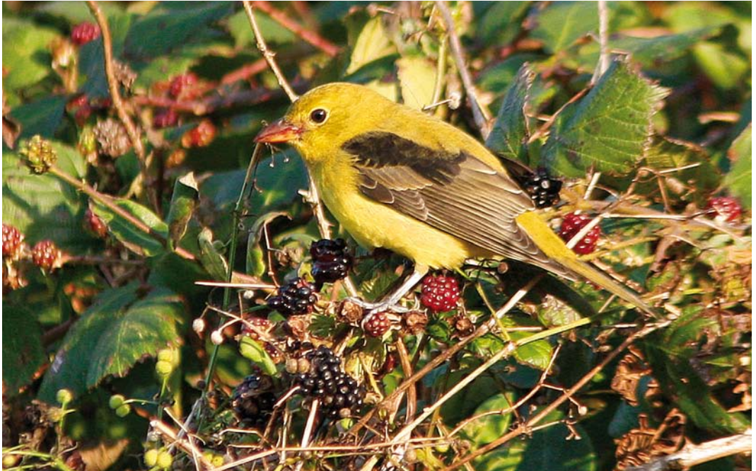
494 Scarlet Tanager / Zwartvleugeltangare Piranga olivacea , first-winter male, Garinish Point, Cork, Ireland, 8 October 2008