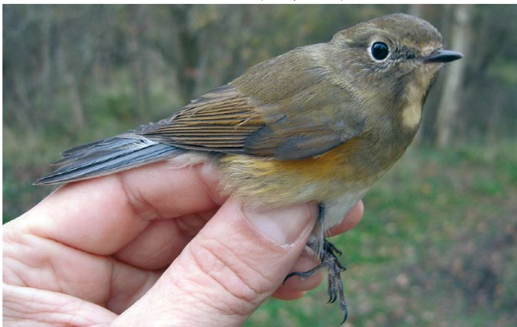
529 Blauwstaart / Red-flanked Bluetail Tarsiger cyanurus , Groene Glop, Schiermonnikoog, Friesland, 1 november 2008