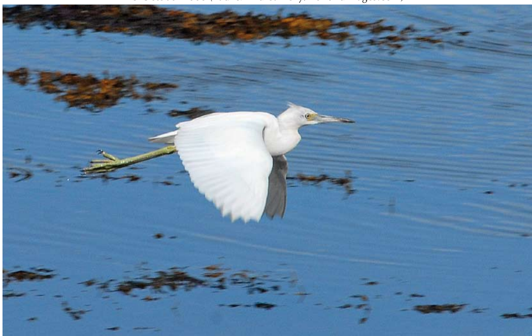
482 Little Blue Heron / Kleine Blauwe Reiger Egretta caerulea , first-year, Letterfrack, Galway, Ireland, 5 October 2008