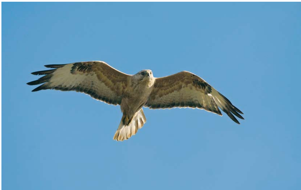
481 Long-legged Buzzard / Arendbuizerd Buteo rufinus , immature, Doel, Oost-Vlaanderen, Belgium, 25 October 2008 ( Johan Buckens )