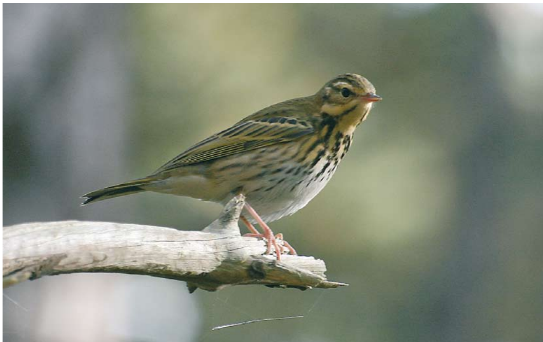
528 Siberische Boompieper / Olive-backed Pipit Anthus hodgsoni , Lange Paal, Vlieland, Friesland, 18 oktober 2008