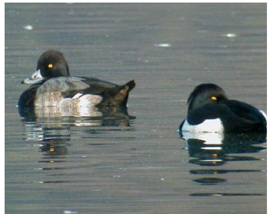
79 Kleine Topper / Lesser Scaup Aythya affinis , mannetje (links), Harelbeke, West-Vlaanderen, 12 december 2007

RALLETOT ALKEN Een late Kwartelkoning Crex crex werd op 4 november opgestoten bij Bredene, West-Vlaanderen. Tussen 4 en 6 november passeerde over Wallonië een trek golf van meer dan 600 Kraanvogels Grus grus en over Vlaanderen van meer dan 500. Tussen 13 en 23 november werden er in heel België nog eens meer dan 520 opgemerkt. Wallonië verwerkte tussen 15 en 18 december een tweede (grotere) golf van c 1170 vogels en op 29 de-