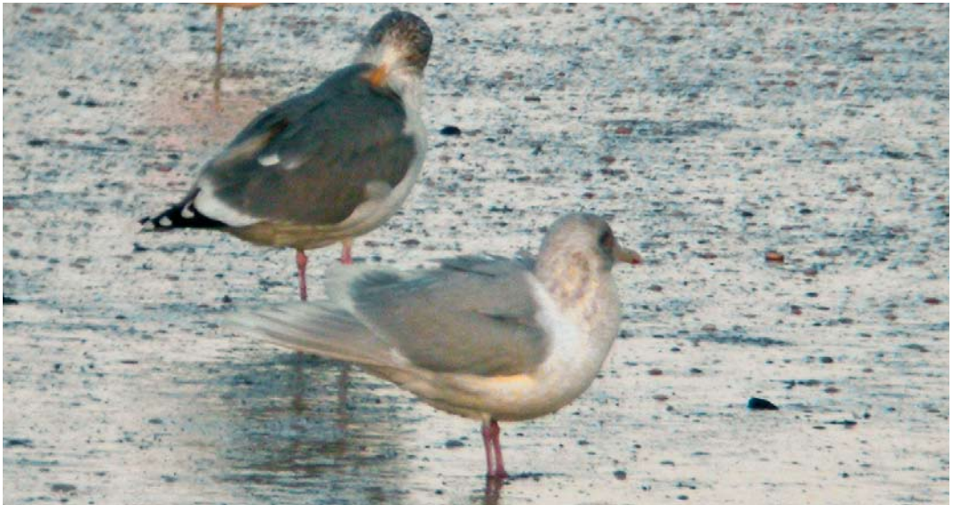
83 Kumliens Meeuw / Kumlien's Gull Larus glaucooides kumlieni , Nieuwpoort, West-Vlaanderen, 6 januari 2008 (Pieter Vantieghem)