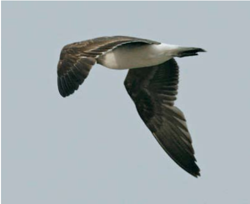
43 Mystery photograph I (May)