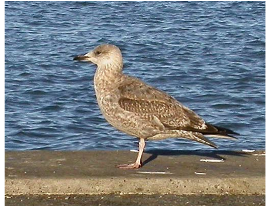
14-15 Probable Herring Gull / waarschijnlijke Zilvermeeuw Larus argentatus , first-year, Hirtshals Havn, Nordjylland, Denmark, 25 February 2004 (Kenneth Rude Nielsen). Bird with largely dark tail and densely barred upper- and undertail-coverts. Note surprisingly dark longest two undertail-coverts in plate 15. See also plate 16-17, depicting same bird. Feathers of this bird have been taken for DNA sampling. 16-17 Probable Herring Gull / waarschijnlijke Zilvermeeuw Larus argentatus , first-year, Hirtshals Havn, Nordjylland, Denmark, 17 February 2004 (Rune Sø Neergaard). Same bird as in plate 14-15. Underparts paler and more clearly streaked than in typical Smithsonian Gull L. smithsonianus . In addition, new greyish scapulars looking slightly darker than usual in that species, while upper flank-feathers look rather too pale.

undertail-coverts seen in some smithsonianus are usually not present in argentatus (but see plate 15). Also, in first-year smithsonianus , the vent is often as boldly and densely marked as the undertail-coverts, especially along the sides, the pattern connecting clearly with the brown belly. In argentatus , strong, continuous barring on the vent occurs but is only rarely seen (and is often separated from the dark markings on the underparts by a pale central belly and rear flank).