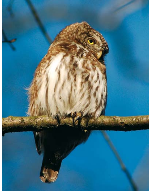
84 Dwerguil / Eurasian Pygmy Owl Glaucidium passerinum, Valkenswaard, Noord-Brabant, 10 februari 2008