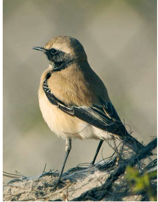
74 Grote Kruisbek / Parrot Crossbill Loxia pytyopsittacus , mannetje, Schoorl, Noord-Holland, 26 december 2007 75 Woestijntapuit / Desert Wheatear Oenanthe deserti , eerstejaars mannetje, Maasvlakte, Zuid-Holland, 12 november 2007 76 Grote Kruisbek / Parrot Crossbill Loxia pytyopsittacus , mannetje, Oud-Leusden, Utrecht, 30 december 2007