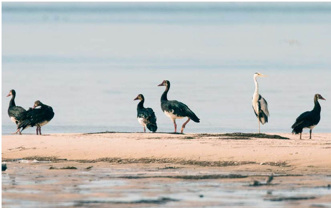
118 Spur-winged Geese / Spoorwiekganzen Plectropterus gambensis , with Mauritanian Heron / Mauritaanse Blauwe Reiger Ardea cinerea monicae , Ebel Kheaznaya, Banc d'Arguin, Mauritania, 12 December 2004

sea-grass Zostera noltii . On 12 December, the Spur-winged Geese were still present and Jan van de Kam took some photographs of the flock from a hide. On 14 December during a high tide waterbird count in the area, still nine Spur-winged Geese were seen. After that, the geese were not observed any more and the observers left the area on 17 December. Since the geese were observed there during high tide, they were mainly resting. Because the significance of this observation was not realized immediately, no description of the birds was taken in the field. However, the accompanying photograph leaves no doubt as to the identity of the birds, on basis of size (between Reed Cormorant and Eurasian Spoonbill), mainly black plumage with white belly, undertail-coverts and central band on the neck, pale 'face' with dark eye-patch and bare skin on forehead, and pinkish legs and bill. The large amount of white on the underparts indicates the nominate subspecies P. g. gambensis and excludes the much darker subspecies P. g. niger (Madge & Burn 1988).