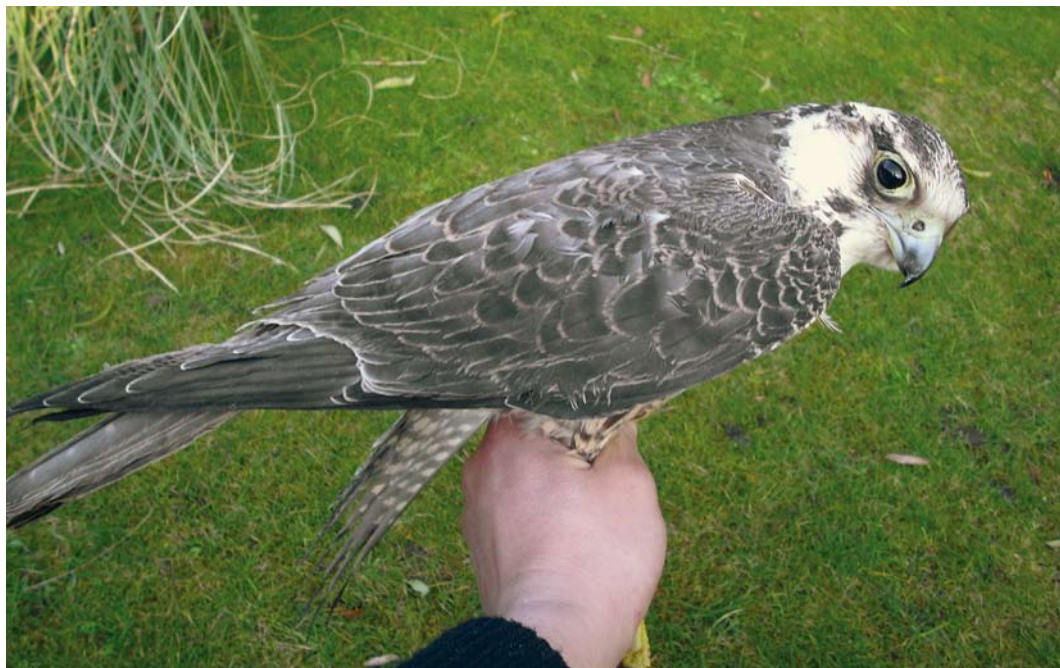
64-65 Toendraslechtvalk / Tundra Peregrine Falcon Falco peregrinus calidus , eerstejaars, Darisdonk, Oud-Turnhout, Antwerpen, België, 13 december 2008