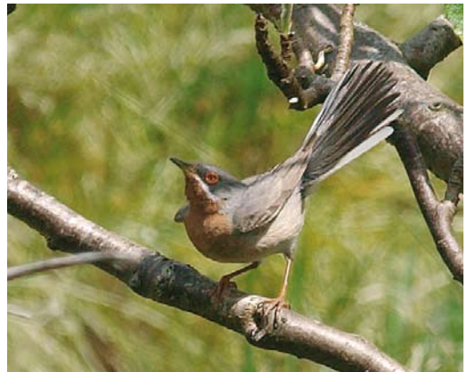
311-312 Presumed African Royal Tern / vermoedelijke Afrikaanse Koningsstern Sterna maxima albididorsalis , Clonakilty, Cork, Ireland, 7 June 2009 ( Michael O'Keefe ) 313 Allen's Gallinule / Afrikaans Purperhoen Porphyrio alleni , Lampedusa, Italy, 13 April 2009 ( Michele Viganò ) cf Dutch Birding 31: 191, 2009 314 African Openbill / Afrikaanse Gaper Anastomus lamelligerus , Luxor, Egypt, 26 May 2009 ( Benjamin Steffen ) 315 Iraq Babbler / Iraakse Babbelaar Turdoides altirostris , adult, Birecik, Şanlıurfa, Turkey, 6 June 2009 ( Arnoud B van den Berg/The Sound Approach ) 316 Subalpine Warbler / Baardgrasmus Sylvia cantillans , male, Trongisvágur, Suðuroy, Faeroes, 22 May 2009 ( Silas K K Olofson )