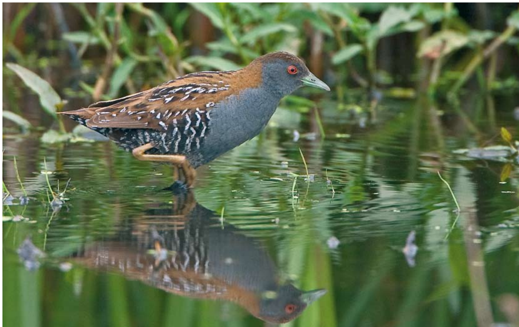
322 Kleinst Waterhoen / Baillon's Crake Porzana pusilla , mannetje, Zevenhoven, Zuid-Holland, 10 juni 2009 (Hans Brinks)