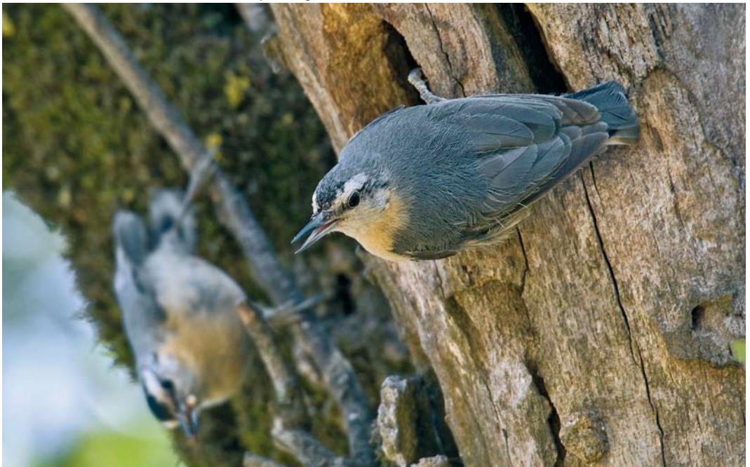
305 Algerian Nuthatches / Algerijnse Boomklevers Sitta ledanti , female (right) and male, Tamentout forest, Petit Kabylie, Algeria, 4 June 2009