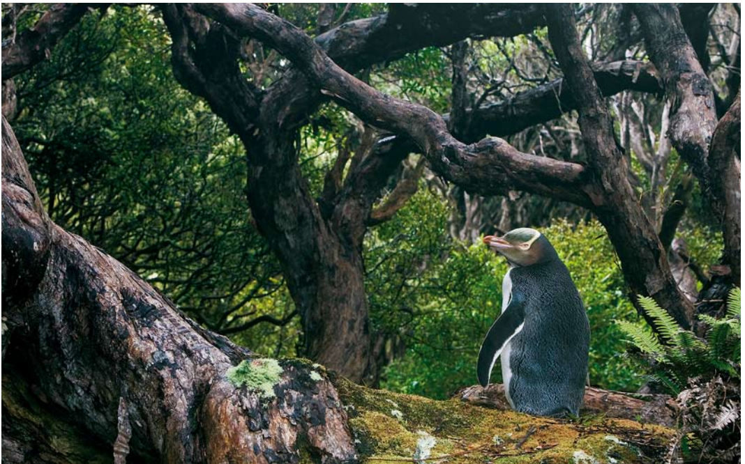
296 Yellow-eyed Penguin / Geelooopinguïen Megadyptes antipodes , Enderby Island, Auckland Islands, New Zealand, 12 November 2008