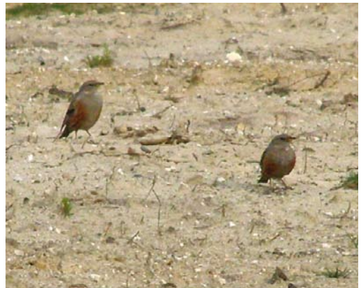
328 Ralreiger / Squacco Heron Ardeola ralloides , Willeskop, Utrecht, 19 juni 2009 329 Roodkopklauwier / Woodchat Shrike Lanius senator , Texel, Noord-Holland, 15 juni 2009 330 Bosgors / Rustic Bunting Emberiza rustica , adult vrouwtje, Zwanenwater, Noord-Holland, 6 juni 2009 331 Veldrietzanger / Paddyfield Warbler Acrocephalus agricola , Den Oever, Noord-Holland, 14 juni 2009 332 Krekelzanger / River Warbler Locustella fluviatilis , Sneekermeer, Friesland, 9 juni 2009 333 Alpenheggenmussen / Alpine Accentors Prunella collaris , Molenheide, Mill, Noord-Brabant, 7 mei 2009