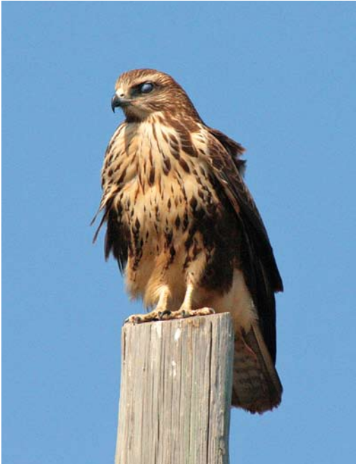
263 Hybrid Atlas Long-legged x Common Buzzard / hybride Atlasarendbuizerd x Buizerd Buteo rufinus cirtensis x buteo , recently fledged juvenile, Pantelleria, Italy, 5 September 2008. Note sparsely streaked breast and belly, dark contrasting flanks, quite long tarsus and long and heavy bill.