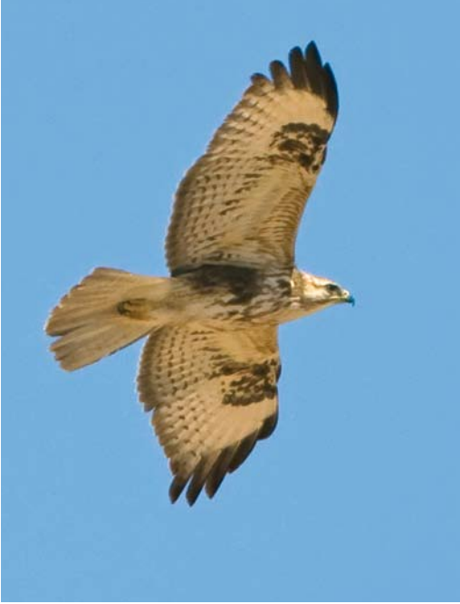
265 Atlas Long-legged Buzzard / Atlasarendbuizerd Buteo rufinus cirtensis , juvenile, between Goulmime and Atlantic coast, Morocco, 20 March 2008. Note strong similarities with Pantelleria hybrid but also more marked and obvious dark carpal patch, warmer tone of flank, paler and less barred tail, and less patterned underwing-coverts.

was paired and seen copulating regularly with a different second calendar-year cirtensis . Moreover, an adult male cirtensis paired with an adult female nominate buteo was seen copulating regularly and starting to breed. The increase of mixed pairs will probably lead to an increasing number