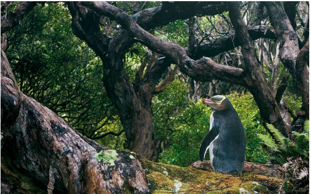
296 Yellow-eyed Penguin / Geelooopinguïen Megadyptes antipodes , Enderby Island, Auckland Islands, New Zealand, 12 November 2008