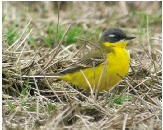
247 Nestlocatie / breeding site, Spaarndam, Noord-Holland, 11 mei 2008 (Roy Slaterus) 248 Noordse Kwikstaart / Grey-headed Wagtail Motacilla thunbergi of hybride / or hybrid, mannetje / male, Spaarndam, Noord-Holland, 4 mei 2008 (Roy Slaterus) 249 Noordse Kwikstaart / Grey-headed Wagtail Motacilla thunbergi of hybride / or hybrid, mannetje / male, Spaarndam, Noord-Holland, 4 juni 2008 (Roy Slaterus) 250 Noordse Kwikstaart / Grey-headed Wagtail Motacilla thunbergi of hybride / or hybrid, mannetje / male, Spaarndam, Noord-Holland, 17 mei 2008 (Roy Slaterus)

perkt was. Bij vrouwtje Noordse Kwikstaart is de wenkbrauwstreep doorgaans smaller en korter en zijn de oorstreek, kruin en bovendelen donkerder en kouder grijs van kleur. Daarnaast valt de donkere teugelstreep meestal meer op en is de middenborst, net als bij mannetjes, gevlekt. De determinatie van vrouwtjes 'gele kwikstaarten' is echter dermate complex dat zekerheid omtrent de identiteit van het vrouwtje moeilijk te verkrijgen is.