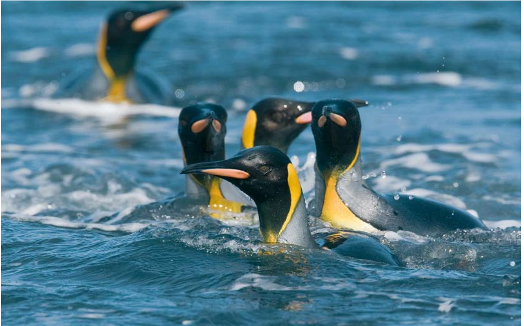
295 King Penguins / Koningspinguïns Aptenodytes patagonicus , Macquarie Island, Australia, 15 November 2008