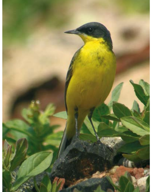
246 Noordse Kwikstaart / Grey-headed Wagtail Motacilla thunbergi , mannetje / male, Helgoland, Duitsland, 30 mei 2008 (Roy Slaterus). Typisch exemplaar zonder sporen van witte wenkbrauwstreep en met donkere vlekken op borst / Typical male, without trace of white supercilium and with obvious breast markings.

KOP & HALS Voorhoofd, kruin, achterhoofd en achterhals grijs, donkerder dan bij mannetje Gele Kwikstaart en blauwe tint minder opvallend. Middenkruinveren met groenachtige top. Zijkruin grijsgroen zoals bovendelen. Zijkruin boven oog donkergrijs tot zwart, net als teugel en voorste deel van oorstreek. Achterste deel van oorstreek iets lichter grijs. Smalle witachtige wenkbrauwstreep uitsluitend achter oog. Lichtgrijs vlekje boven teugel (op rechterkant van kop nagenoeg afwezig); na enkele weken nagenoeg verdwenen door sleet. Oogring grijs en onopvallend, midden onder oog iets lichter. Kin wit. Keel heldergeel.