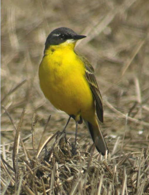
245 Noordse Kwikstaart / Grey-headed Wagtail Motacilla thunbergi of hybride / or hybrid, mannetje / male, Spaarndam, Noord-Holland, 3 mei 2008. Relatief brede wenkbrauwstreep (voor Noordse), gedeeltelijk witachtige oogring en beperkte mate van borsttekening duiden mogelijk op hybride / Rather broad supercilium (for Grey-headed), pale lower part of eye-ring and relatively few dark spots on breast may indicate hybrid origin.