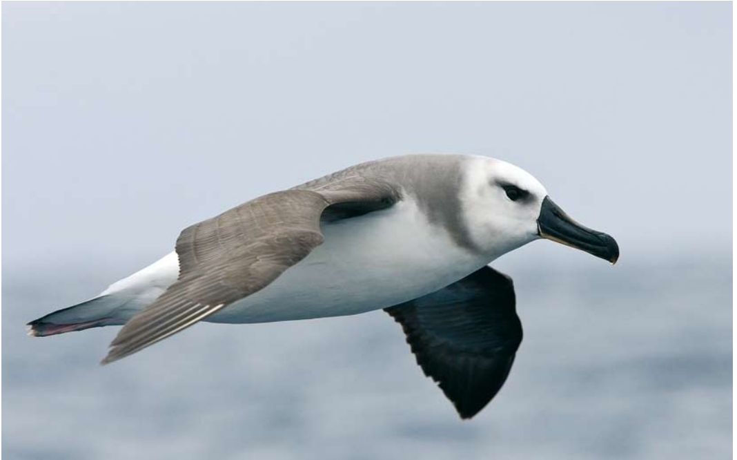
277 Grey-headed Albatross / Grijskopalbatros Thalassarche chrysostoma , immature, at sea off Macquarie Island, Australia, 17 November 2008