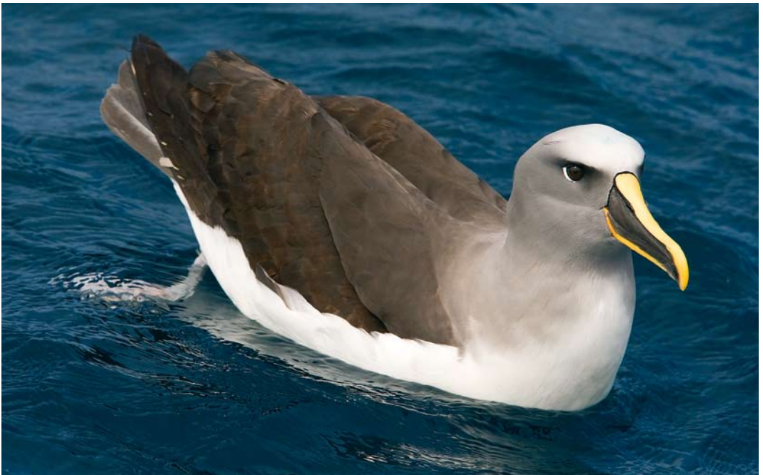
278 Buller's Albatross / Bullers Albatros Thalassarche bulleri , at sea off Pyramid Rock, Chatham Islands, New Zealand, 22 November 2008