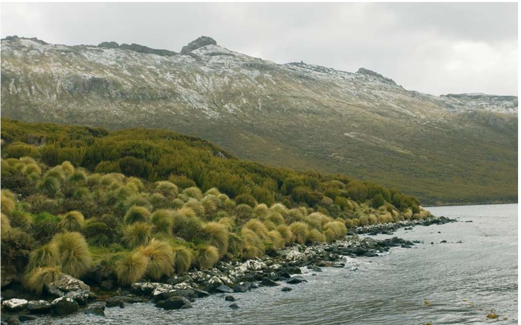
272 Tussock on Campbell Island, New Zealand, 18 November 2008