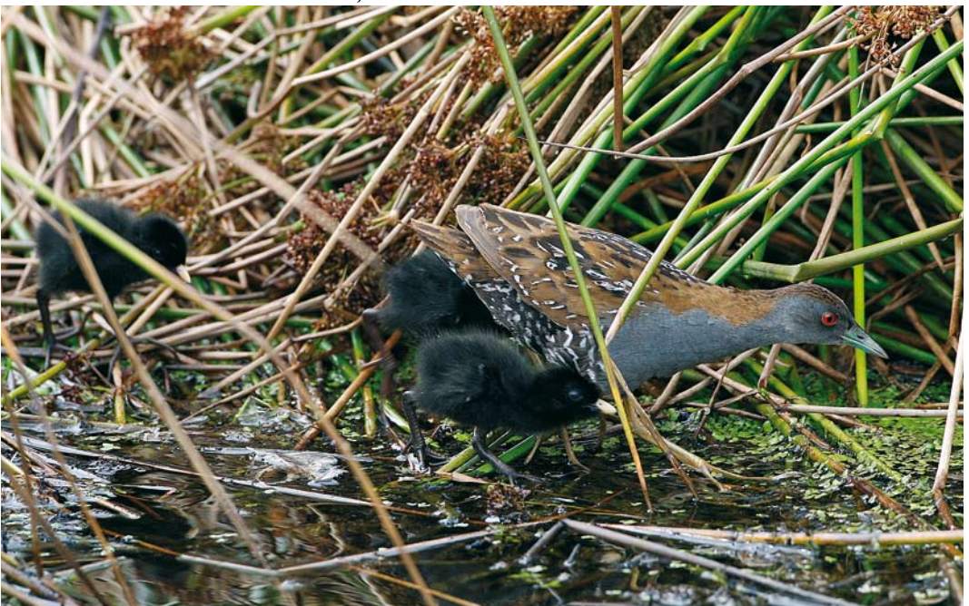
325 Kleinste Waterhoenders / Baillon's Crakes Porzana pusilla , mannetje en pulli, Zevenhoven, Zuid-Holland, 18 juli 2009 (Martin van der Schalk)