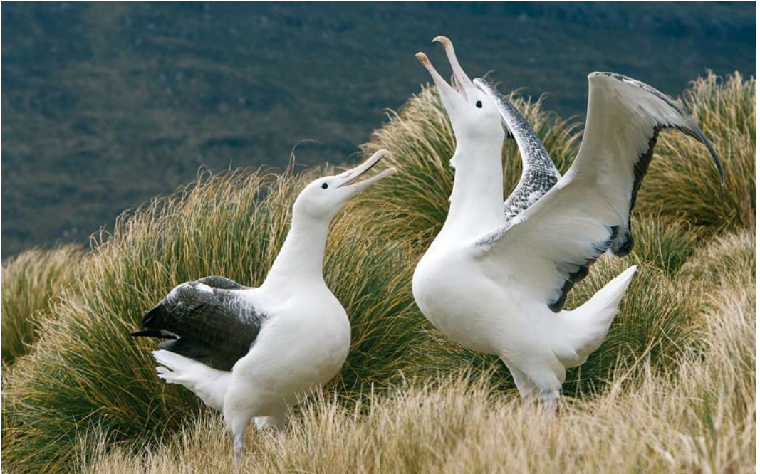
271 Southern Royal Albatrosses / Zuidelijke Koningsalbatrossen Diomedea epomophora , Campbell Island, New Zealand, 18 November 2008 (Otto Plantema)