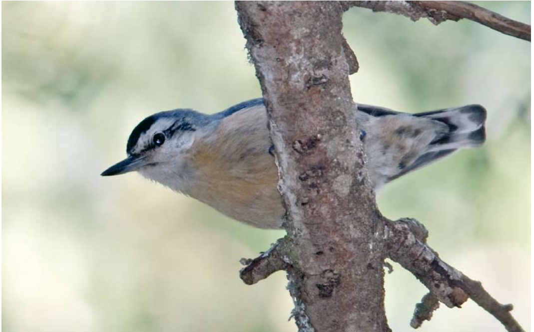
304 Algerian Nuthatch / Algerijnse Boomklever Sitta ledanti , male, Djebel Babor, Petit Kabylie, Algeria, 2 June 2009. Note orange-buff vent and undertail-coverts with diffuse blackish spots.