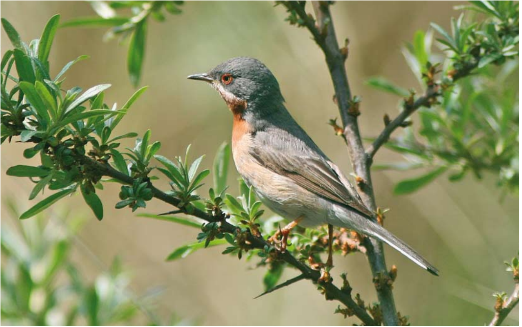
317 Subalpine Warbler / Baardgrasmus Sylvia cantillans , male, Zeebrugge, West-Vlaanderen, Belgium, 9 May 2009