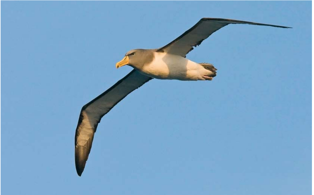
287-288 Chatham Albatross / Chathamalbatros Thalassarche eremita , Chatham Islands, New Zealand, 22 November 2008 ( Otto Plantema ) 289 Salvin's Albatross / Salvins Albatros Diomedea salvini , Bounty Island, New Zealand, 21 November 2008 ( Otto Plantema )