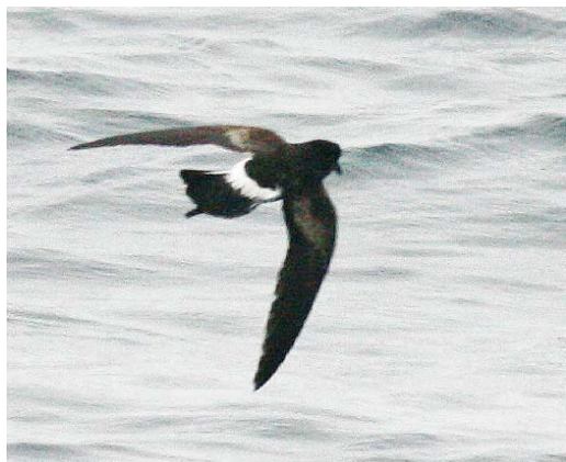
257-260 'Fuegian' Wilson's Storm Petrel / Wilsons Stormvogeltje Oceanites oceanicus chilensis , off Valparaiso, Chile, 31 January 2009 (Seamus Enright)

was inadvertently first published as a 'nomen nudum' by Alexander (1928). The taxon was later described in detail by Murphy (1936) and referred to as 'Fuegian Petrel', a new subspecies of Wilson's Storm Petrel. Subsequent to that, for reasons we have yet to establish, the taxon was dropped as a subspecies of Wilson's. Until very recently, only two subspecies of Wilson's, O o oceanicus and O o exasperatus , were recognized in the literature (cf Harrison 1983 (and subsequent editions), del Hoyo et al 1992, Dickinson 2003), although Harrison also mentions O o maorianus (see below) as a subspecies of Wilson's. Interestingly, in his account of Wilson's Storm Petrel, Harrison (1983) notes that 'Cape Horn birds may have pale vents (Ron Naveen pers comm)'. It would appear Ron Naveen was most likely referring here once again to chilensis , which shows some pale mottling on the lower belly. Onley &