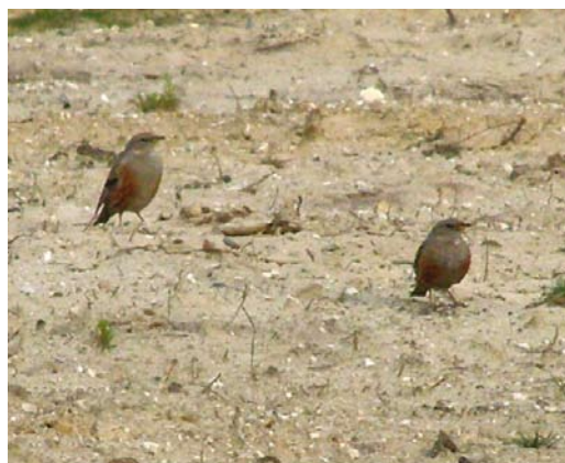
328 Ralreiger / Squacco Heron Ardeola ralloides , Willeskop, Utrecht, 19 juni 2009 329 Roodkopklauwier / Woodchat Shrike Lanius senator , Texel, Noord-Holland, 15 juni 2009 330 Bosgors / Rustic Bunting Emberiza rustica , adult vrouwtje, Zwanenwater, Noord-Holland, 6 juni 2009 331 Veldrietzanger / Paddyfield Warbler Acrocephalus agricola , Den Oever, Noord-Holland, 14 juni 2009 332 Krekeltzanger / River Warbler Locustella fluviatilis , Sneekermeer, Friesland, 9 juni 2009 333 Alpenheggenmussen / Alpine Accentors Prunella collaris , Molenheide, Mill, Noord-Brabant, 7 mei 2009