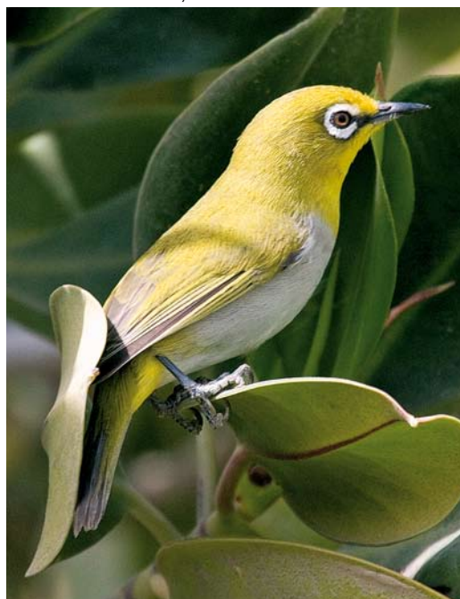
269 Oriental White-eye / Indische Brilvogel Zosterops palpebrosus , Koor-e Azini, Hormozgan, Iran, 3 March 2009