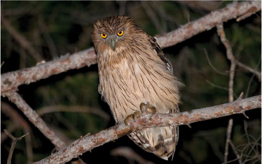
336 Western Brown Fish Owl / Westelijke Bruine Visuil Ketupa zeylonensis semenowi , adult, southern Turkey, 13 July 2009 (Arnoud B van den Berg/ The Sound Approach ) 337 Western Brown Fish Owl / Westelijke Bruine Visuil Ketupa zeylonensis semenowi , adult, southern Turkey, 5 July 2009 (Soner Bekir) 338 Western Brown Fish Owl / Westelijke Bruine Visuil Ketupa zeylonensis semenowi , fledgling, southern Turkey, 15 July 2009 (Arnoud B van den Berg/ The Sound Approach )