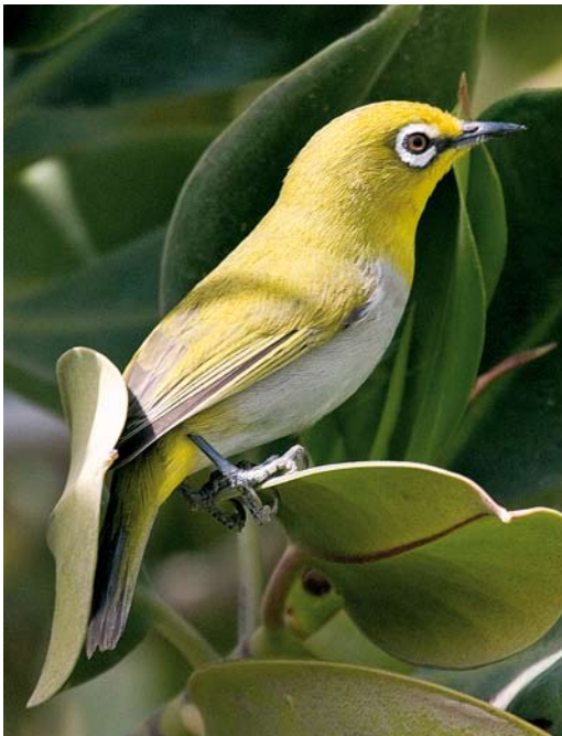
269 Oriental White-eye / Indische Brilvogel Zosterops palpebrosus , Koor-e Azini, Hormozgan, Iran, 3 March 2009 (Maysam Ghasemi)