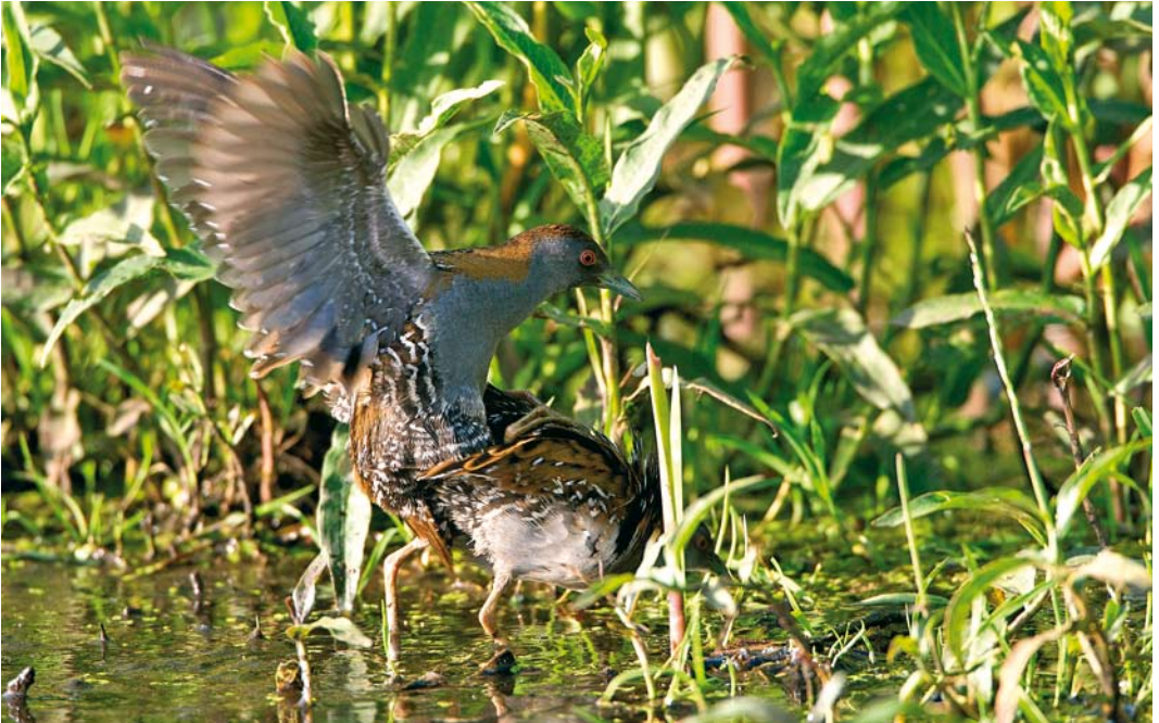
324 Kleinste Waterhoenders / Baillon's Crakes Porzana pusilla , mannetje en vrouwtje, Zevenhoven, Zuid-Holland, 15 juni 2009 (Arnold Meijer)