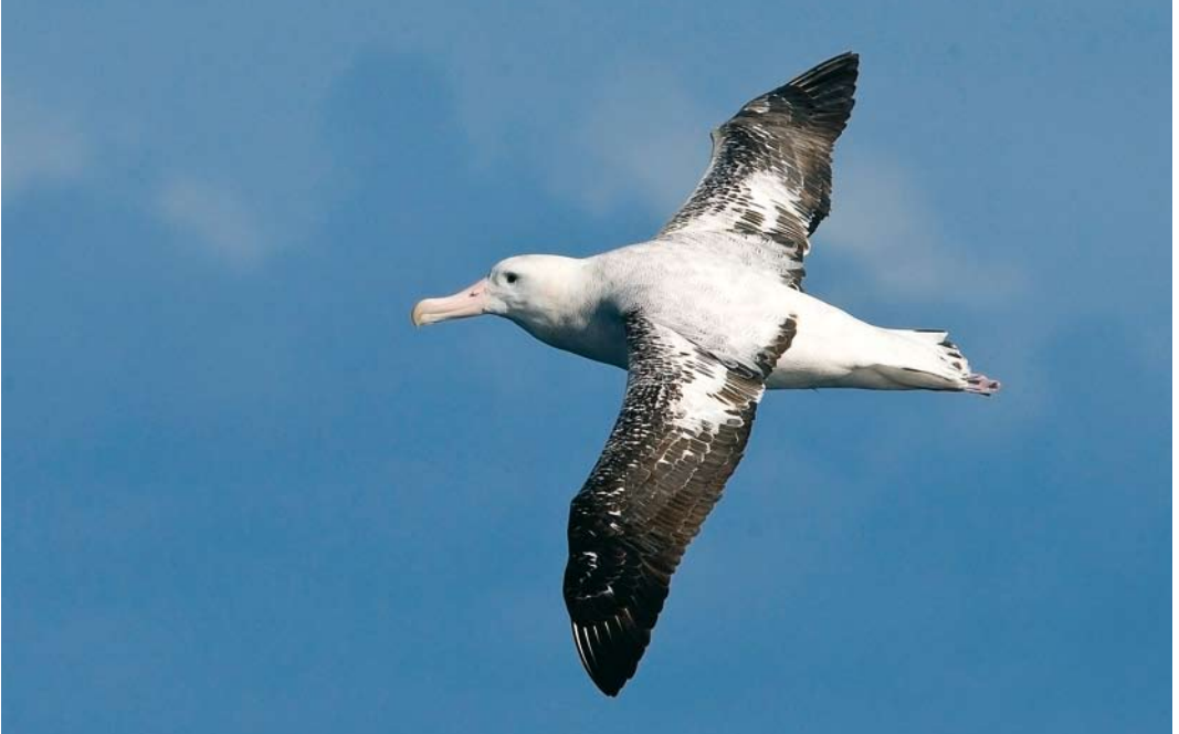
279 Gibson's Albatross / Gibsons Albatros Diomedea gibsoni , at sea off Antipodes Islands, New Zealand, 20 November 2008 ( Otto Plantema ) 280-281 Antipodean/Gibson's Albatross / Antipodenalbatros/Gibsons Albatros Diomedea antipodensis/gibsoni , at sea off Antipodes Islands, New Zealand, 20 November 2008 ( Otto Plantema )