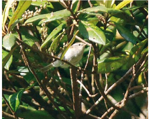
268 Yellow-browed Warbler / Bladkoning Phylloscopus inornatus , Mount Kinabalu, Borneo, Malaysia, 10 November 2008 (Laurens Steijn)

Yellow-browed for Sabah, the second and third Yellow-browed for Borneo, and the first to be photographed and sound-recorded.