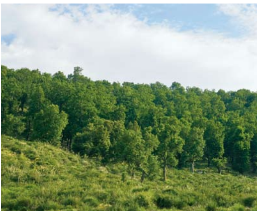
298 Algerian Nuthatch habitat (deciduous oaks such as Quercus afares and Q canariensis ), Tamentout Forest, Petit Kabylie, Algeria, 3 June 2009 (David Monticelli)