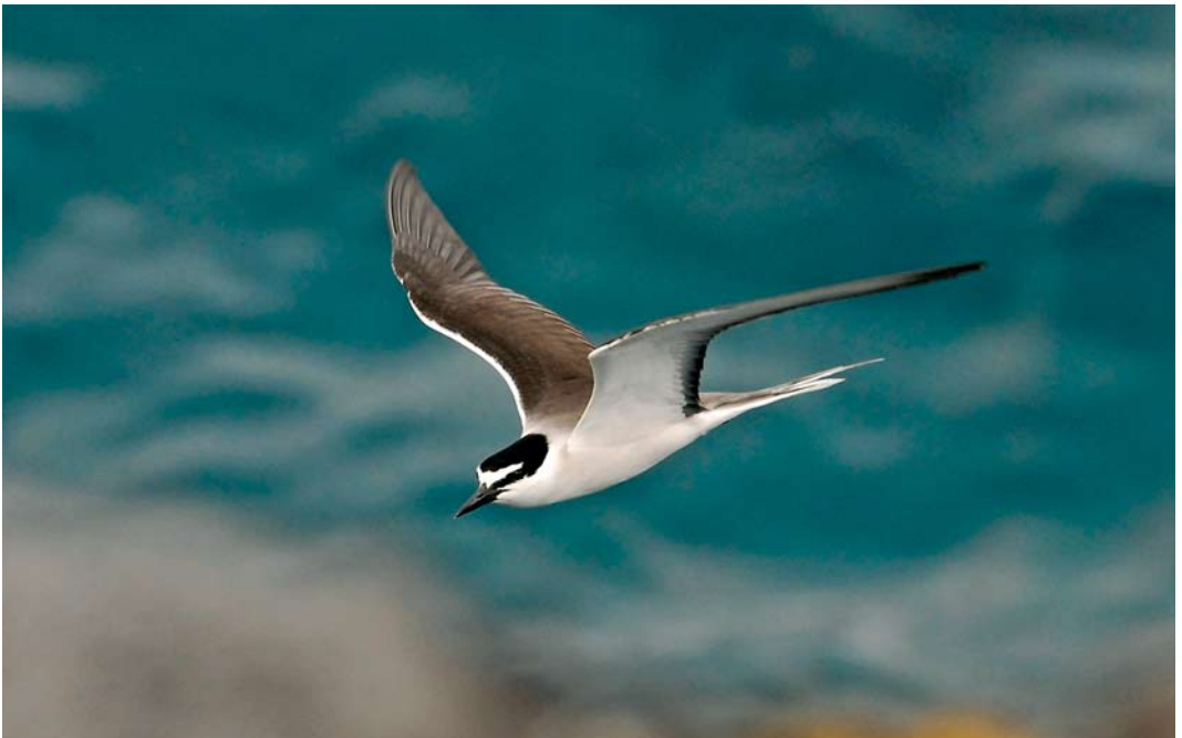
310 Bridled Tern / Brilstern Onychoprion anaethetus , Ponta do Ouriço, Pico, Azores, 16 June 2009 (João Quaresma)