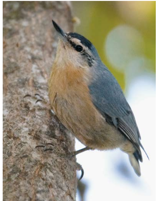
300 Algerian Nuthatch / Algerijnse Boomklever Sitta ledanti , male, Tamentout forest, Petit Kabylie, Algeria, 4 June 2009 (David Monticelli) 301 Algerian Nuthatch / Algerijnse Boomklever Sitta ledanti , male, Tamentout forest, Petit Kabylie, Algeria, 5 June 2009 (Vincent Legrand) 302 Algerian Nuthatch / Algerijnse Boomklever Sitta ledanti , male, Djebel Babor, Petit Kabylie, Algeria, 2 June 2009 (Vincent Legrand) 303 Algerian Nuthatch Sitta ledanti , male, Djebel Babor, Petit Kabylie, Algeria, 2 June 2009 (Vincent Legrand). Note that plate 300-303 depict four different males.

Algiers had been scheduled for Sunday 31 May 2009. Upon arrival at Algiers, where we had to connect with our domestic flight to Constantine, our luggage was scanned by customs and stopped. DM's bag contained two pairs of binoculars, which are still not allowed for foreigners entering the country. We were aware of this problem before