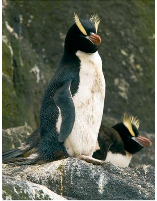
290 Gentoo Penguins / Ezelspinguïns Pygoscelis papua , Macquarie Island, Australia, 15 November 2008 ( Otto Plantema ) 291-292 Erect-crested Penguins / Grote Kuifpinguïns Eudyptes sclateri , Bounty Islands, New Zealand, 21 November 2008 ( Otto Plantema )