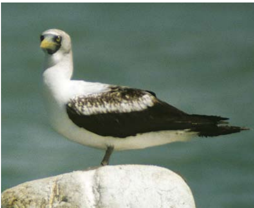
261-262 Masked Booby / Maskergent Sula dactylatra , subadult, near Jask, Hormozgan, Iran, 16 April 2007

The status of Masked Booby in Iran has recently been reviewed by Scott (2008). While breeding along the Iranian Mekran coast has been reported in the past (Vaurie 1965, Hüe & Etchécopar 1970), there actually are no suitable islands for breeding. Consequently it is more likely to be a rare visitor here. The first confirmed record concerned a subadult near Chahbahar, Baluchistan, on 5 April 1972 (Scott 2008). The third record was a bird seen and photographed on 15 January 2009 at Khor e Silikie, west of Jask (Mark Zekhuis in litt). Between 8250 and 13 250 individuals breed on the Halaaniyaat islands, Oman (BirdLife Inter-