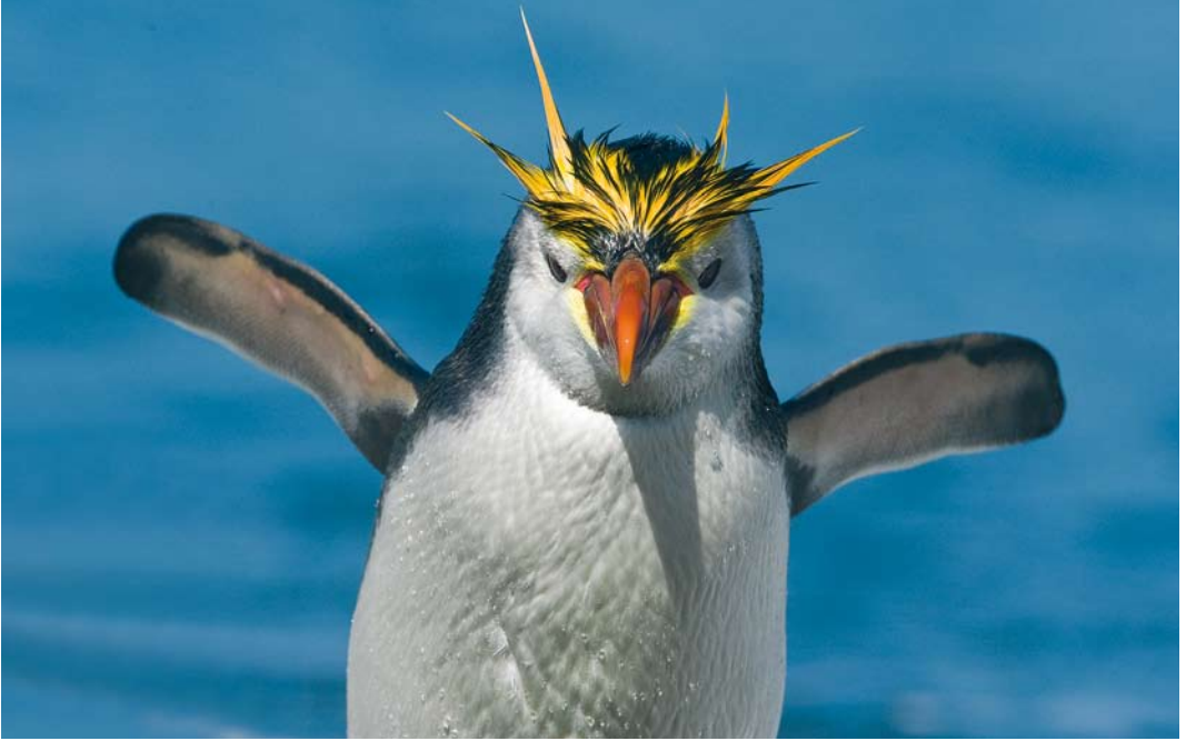
293 Royal Penguin / Schlegels Pinguin Eudyptes schlegeli , Sandy Bay, Macquarie Island, Australia, 15 November 2008 ( Otto Plantema )