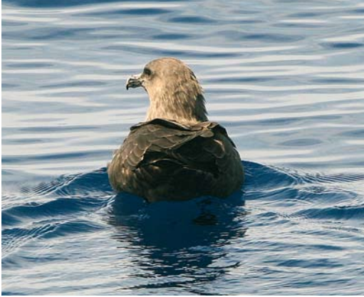
10 South Polar/Brown Skua / Zuidpooljager/ Subantarctische Grote Jager Stercorarius maccormicki/antarcticus , off La Palma, Canary Islands, 6 October 2005