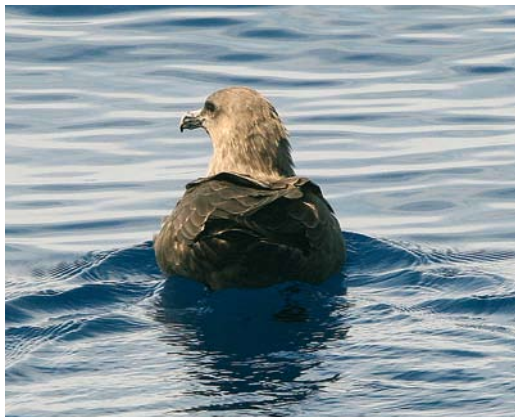
10 South Polar/Brown Skua / Zuidpooljager/ Subantarctische Grote Jager Stercorarius maccormicki/antarcticus , off La Palma, Canary Islands, 6 October 2005