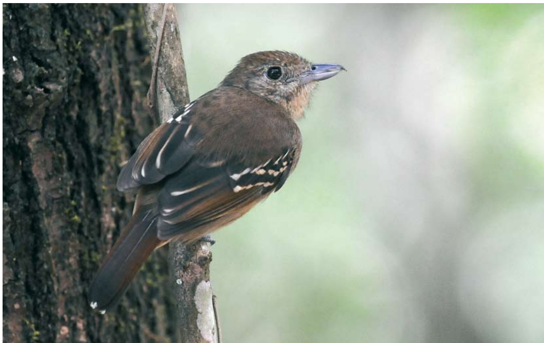
342 Western Slaty Antshrike / Westelijke Gevlekte Mierklauwier Thamnophilus atrinucha , female, Pipeline Road, Panama, 4 March 2009