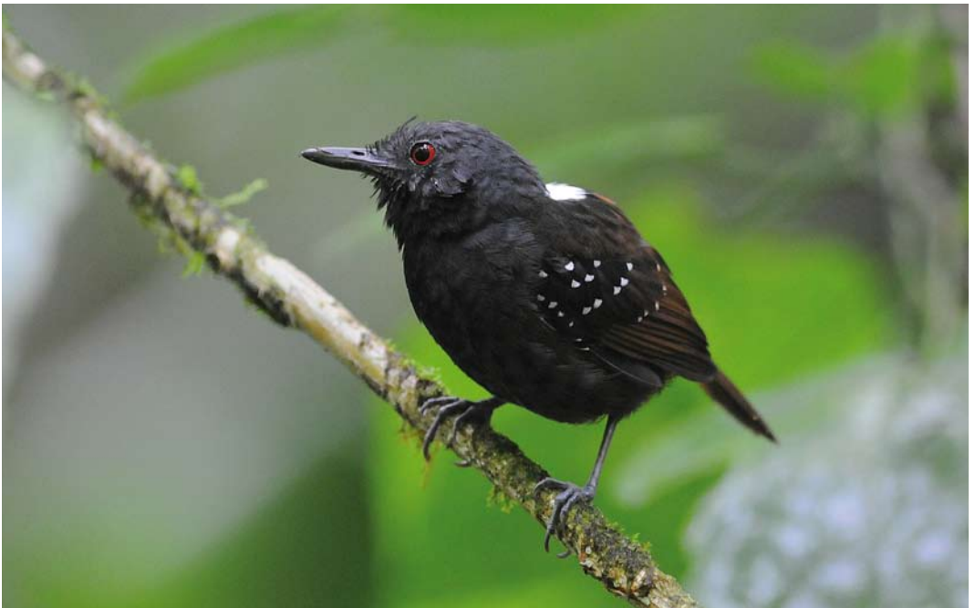
341 Dull-mantled Antbird / Grijskruinmiervogel Myrmeciza laemosticta , male, El Valle, Panama, 18 June 2009 (Roef Mulder)