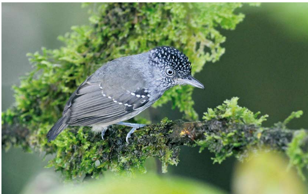
343 Spot-crowned Antvireo / Vlekkapmiervireo Dysithamnus puncticeps , male, El Valle, 8 March 2009 (Roef Mulder)