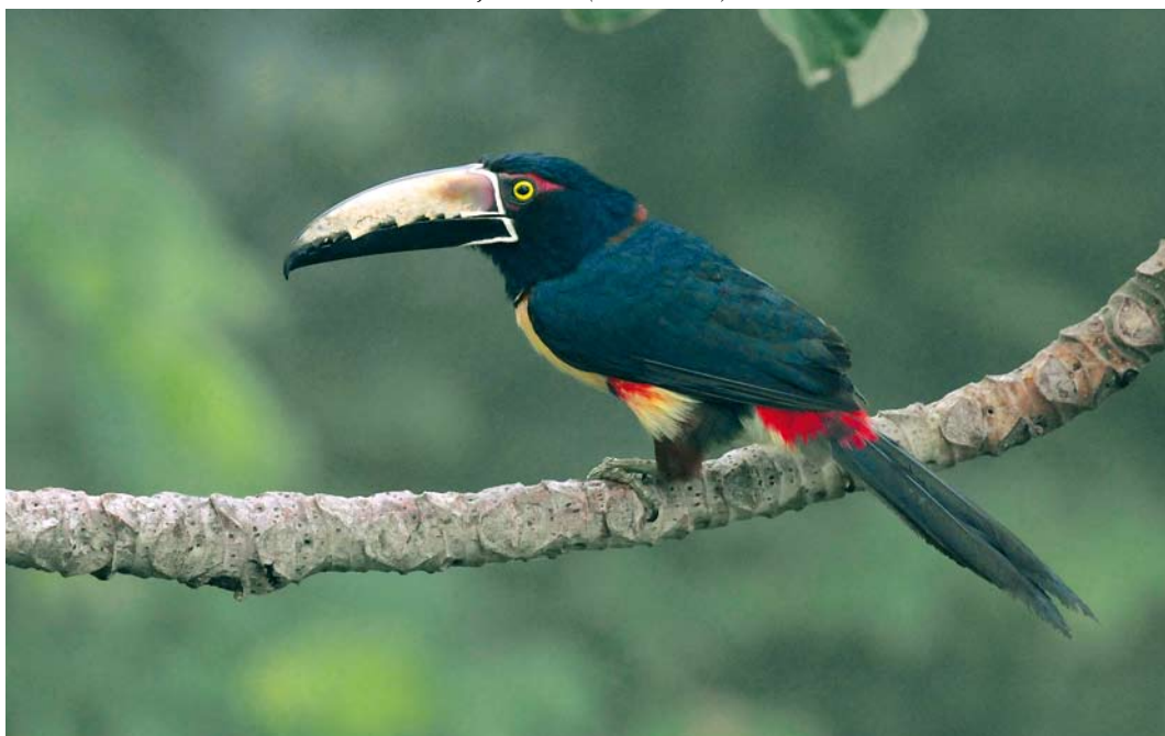
370 Collared Aracari / Halsbandarassari Pteroglossus torquatus , Canopy Tower, Soberanía National Park, Panama, 11 June 2009