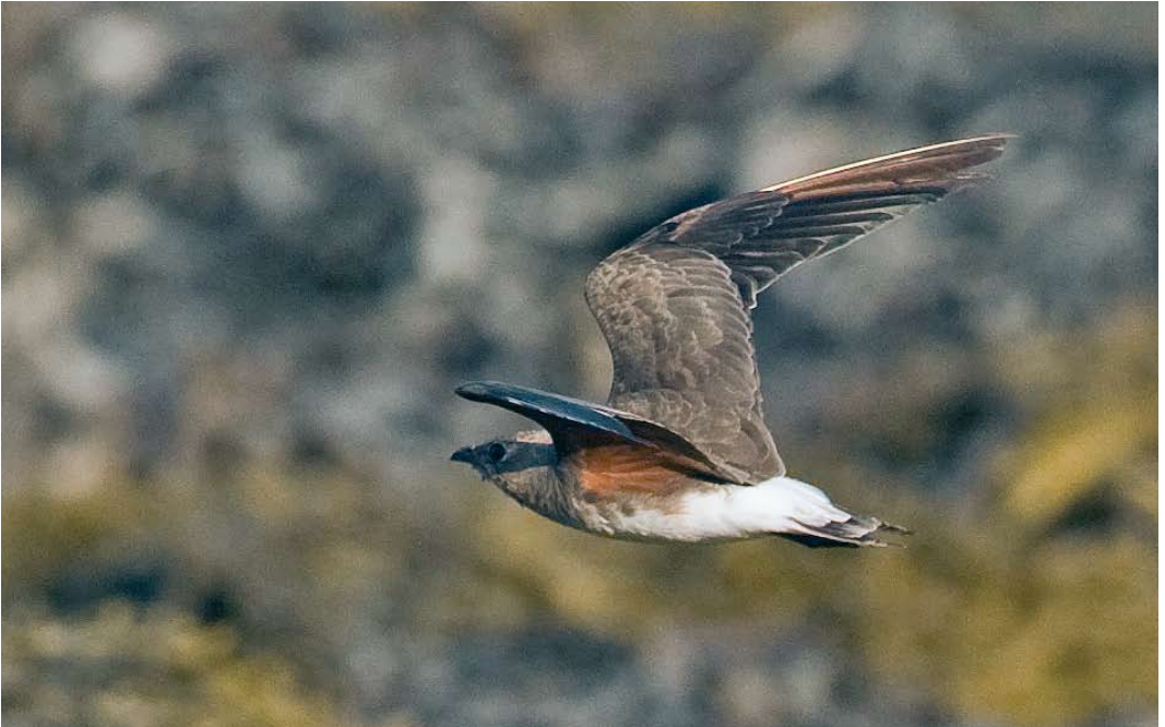
398 Oriental Pratincole / Oosterse Vorkstaartplevier Glareola maldivarum , Grilstadfjæra, Trondheim, Sør-Trøndelag, Norway, 23 August 2009