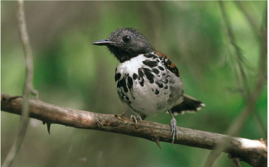
340 Spotted Antbird / Vlekborstmiervogel Hylophylax naevioides , Forest Discovery Center, Panama, 13 June 2009 (Roef Mulder)