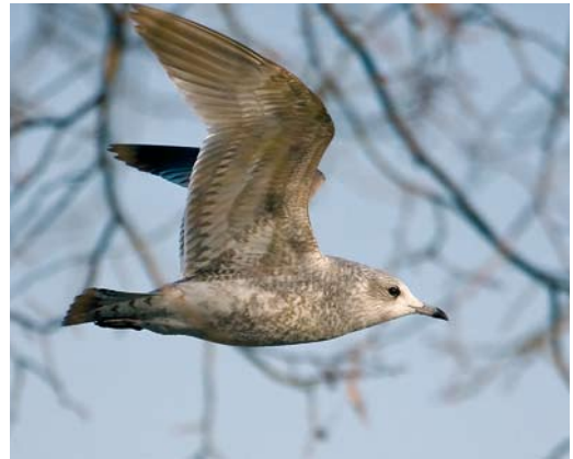
384-387 Stormmeeuw / Mew Gull Larus canus , eerste-winter, Visé, Liège, België, december 2008. Verenkleeft met aantal kenmerken van kamtschatschensis maar formaat en snavelvorm duiden op nominaat canus / Plumage showing characters of kamtschatschensis but size and bill shape indicate nominate canus .

nominaat canus en (westelijke) heinei niet altijd duidelijk is worden ze behandeld zonder apart te worden benoemd, tenzij dit aan de orde is.