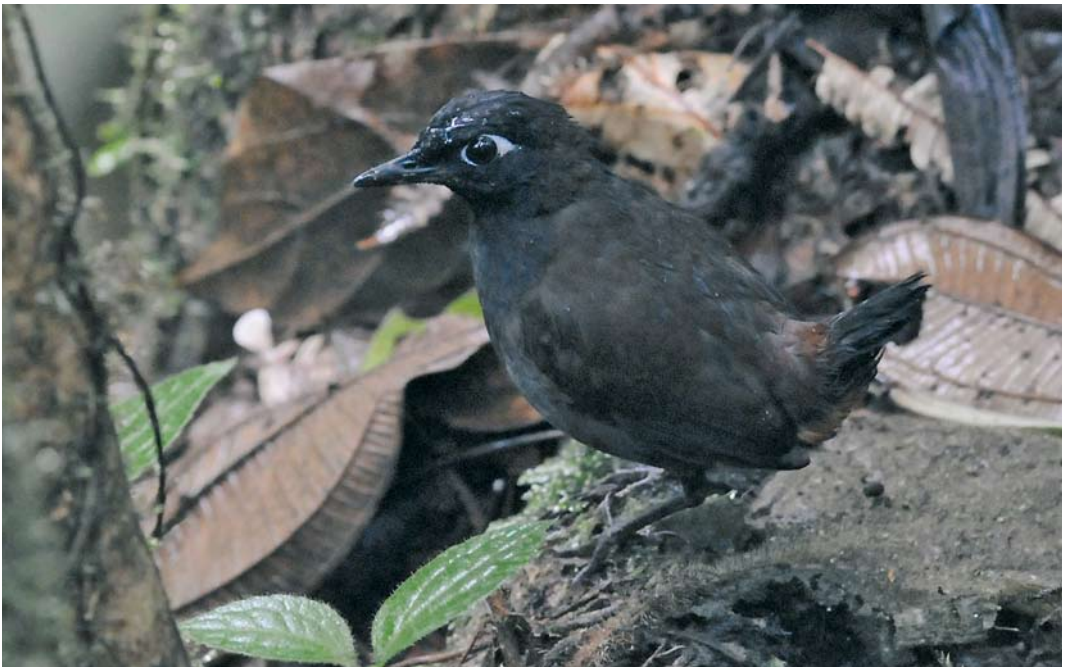
345 Black-headed Antthrush / Zwartkopmierlijster Formicarius nigricapillus , male, El Valle, Panama, 19 June 2009