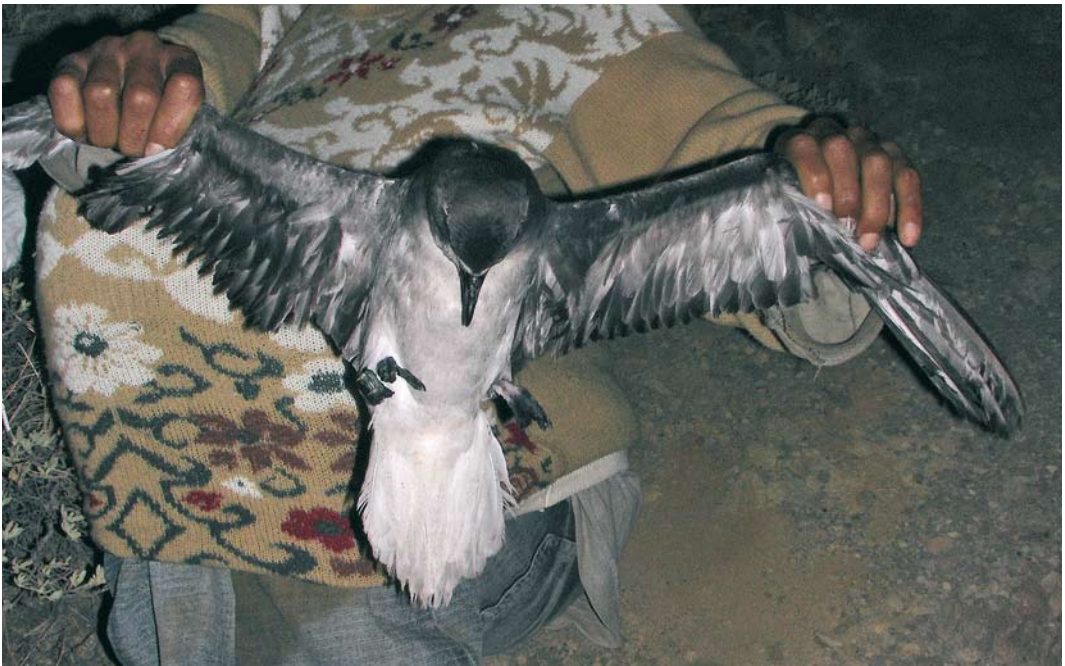
394 Aberrant Fea's Petrel / Gon-gon Pterodroma feae , adult, Fogo, Cape Verde Islands, 21 March 2007. Note grey wash on whole of underparts and very dark underwing.