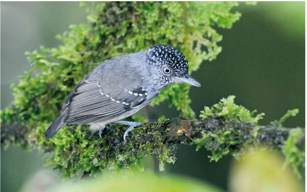
343 Spot-crowned Antvireo / Vlekkapmiervireo Dysithamnus puncticeps , male, El Valle, 8 March 2009 (Roef Mulder)