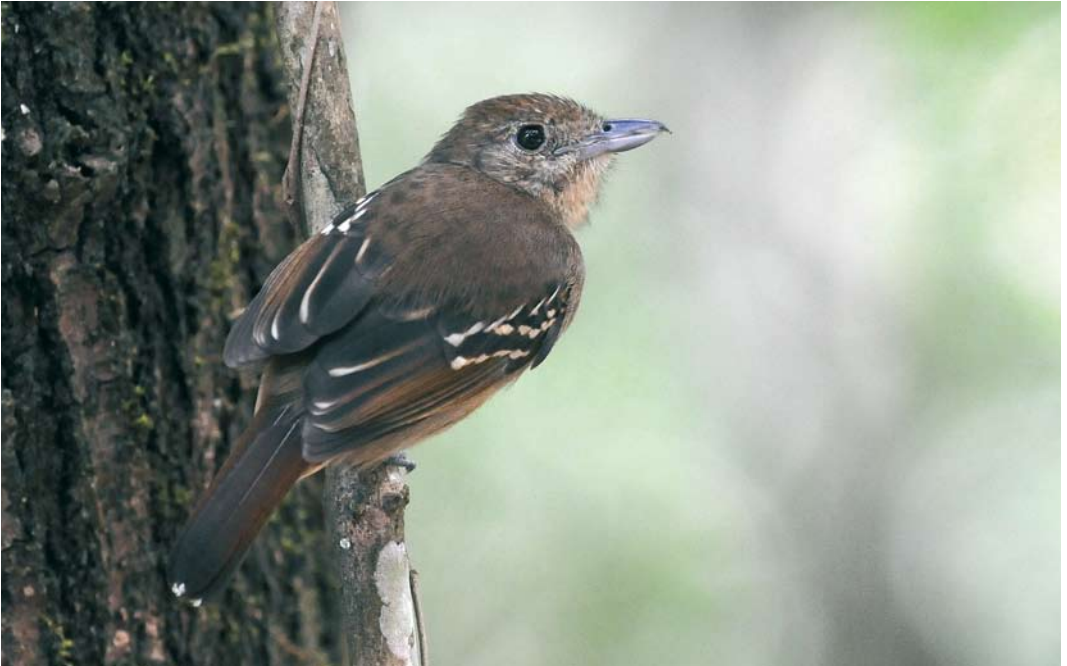
342 Western Slaty Antshrike / Westelijke Gevlekte Mierklauwier Thamnophilus atrinucha , female, Pipeline Road, Panama, 4 March 2009 (Roef Mulder)