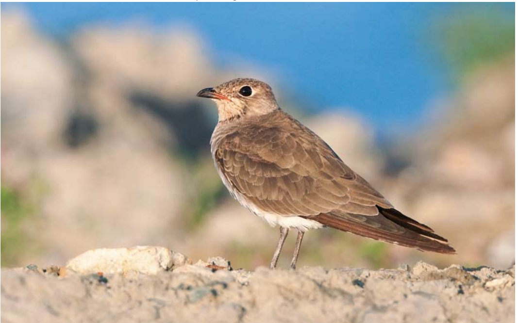
399 Oriental Pratincole / Oosterse Vorkstaartplevier Glareola maldivarum , Grilstadfjæra, Trondheim, Sør-Trøndelag, Norway, 23 August 2009 ( Christian Tiller )