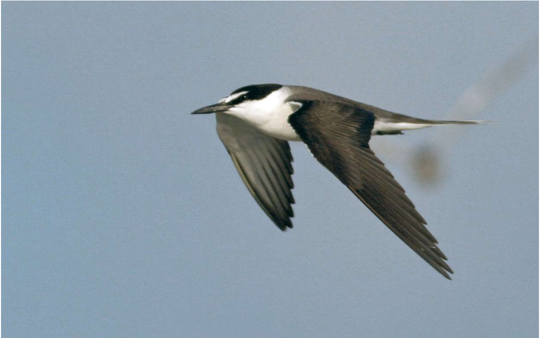
403 Bridled Tern / Brilstern Onychoprion anaethetus , Nachlieni, Western Galilee, Israel, 6 August 2009 (Asaf Mayrose)