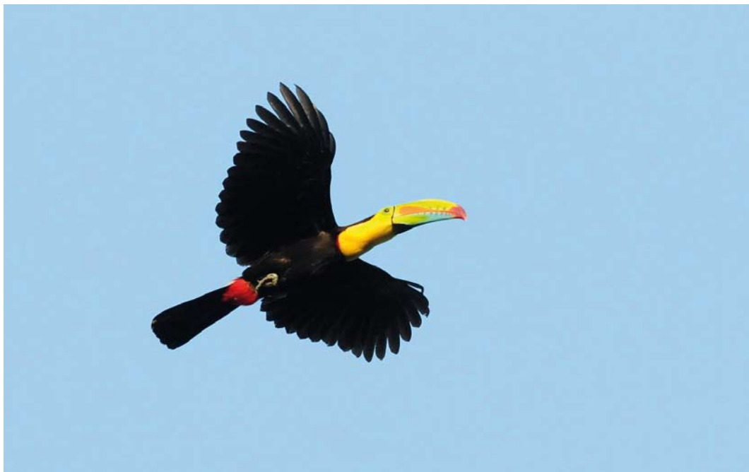
369 Keel-billed Toucan / Zwartborsttoekan Rhamphastos sulfuratus , Pipeline Road, Panama, 15 March 2009