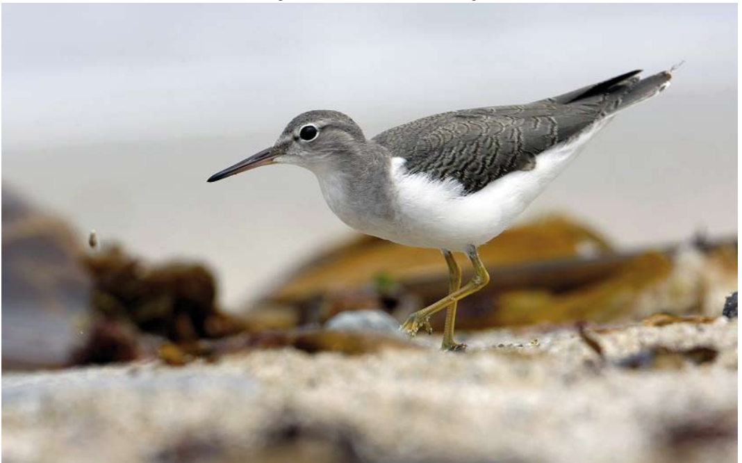
404 Spotted Sandpiper / Amerikaanse Oeverloper Actitis macularius , first-year, Ferrol, A Coruña, Spain, 2 August 2009