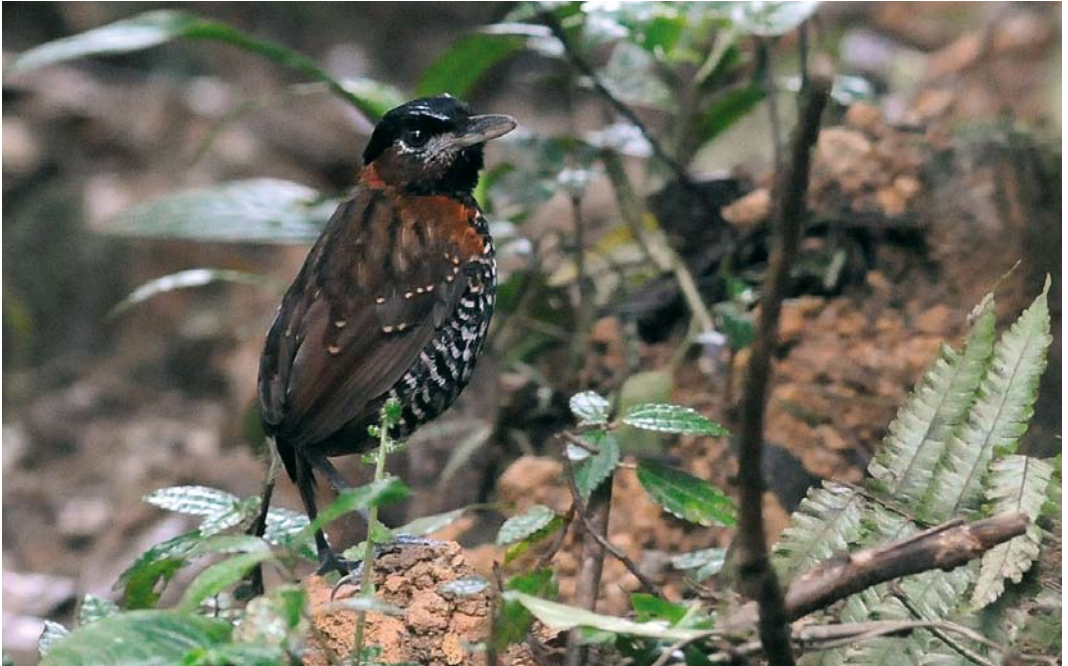
344 Black-crowned Antpitta / Zwartkruinmierpitta Pittasoma michleri , male, El Valle, Panama, 18 June 2009 (Roef Mulder)