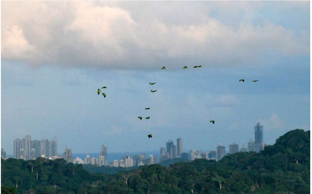
371 Red-lore Parrots / Geelwangamazones Amazona autumnalis , Canopy Tower, Soberanía National Park, Panama, 15 June 2009 (Roef Mulder). Forest view from Canopy Tower, with Panama City in background.

mogelijkheden voor vogelfotografie. Door de grote verscheidenheid en de spectaculair getekend soorten is het een aantrekkelijke bestemming voor vogelfotografen maar in het regenwoud zijn de omstandigheden vaak erg lastig (weinig licht, vochtig, slecht zicht) en vraagt het goed fotograferen veel geduld en inzet. In deze omstandigheden is het fotograferen uit de hand met een gestabiliseerde lens met niet al te grote vergroting (200-400 mm) het meest geschikt, omdat met dergelijke apparatuur snel gereageerd kan worden op wendbare vogels in het bos. ‘Digiscopen’ is in het regenwoud en eigenlijk alleen geschikt om bewijsplaatjes te maken, behalve als aan de bosrand of op een uitkijkpunt boven de bomen de lichtomstandigheden beter zijn.