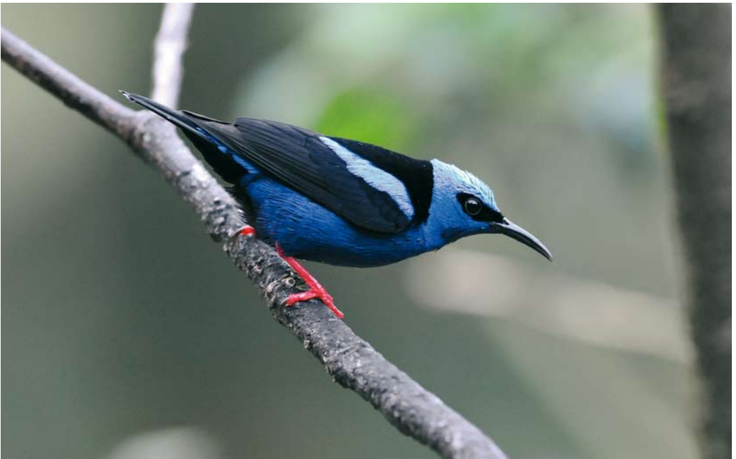
366 Red-legged Honeycreeper / Blauwe Suikervogel Cyanerpes cyaneus , male, Canopy Lodge, El Valle, Panama, 10 March 2009 (Roef Mulder)