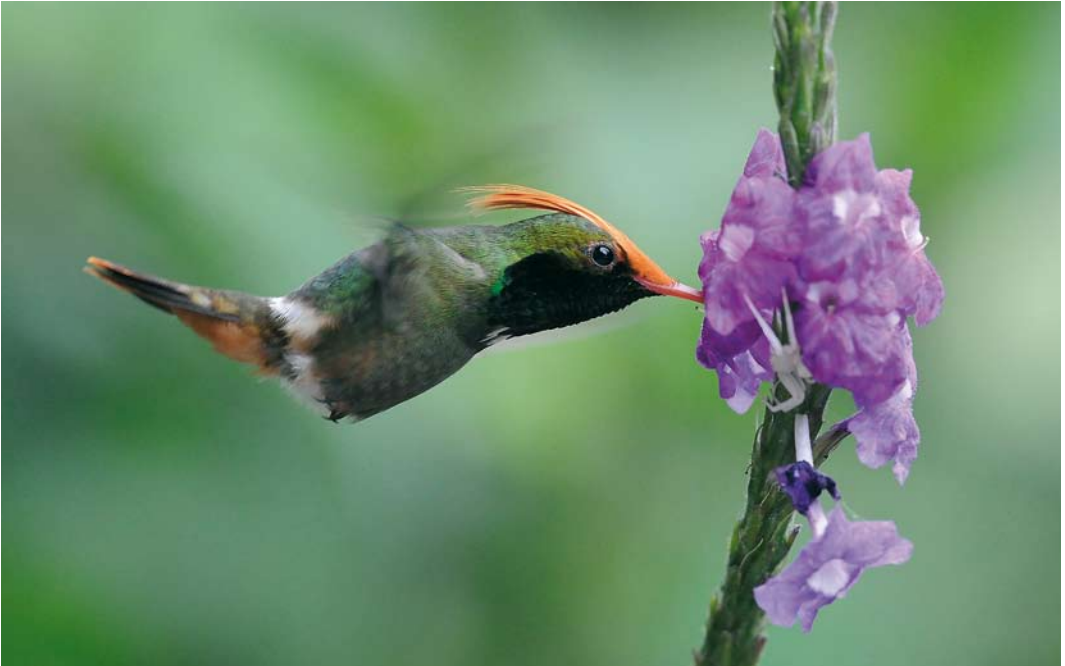
348 Rufous-crested Coquette / Vuurkuifkoketkolibrie Lophornis delattrei , male, El Valle, Panama, 9 March 2009 (Roef Mulder)