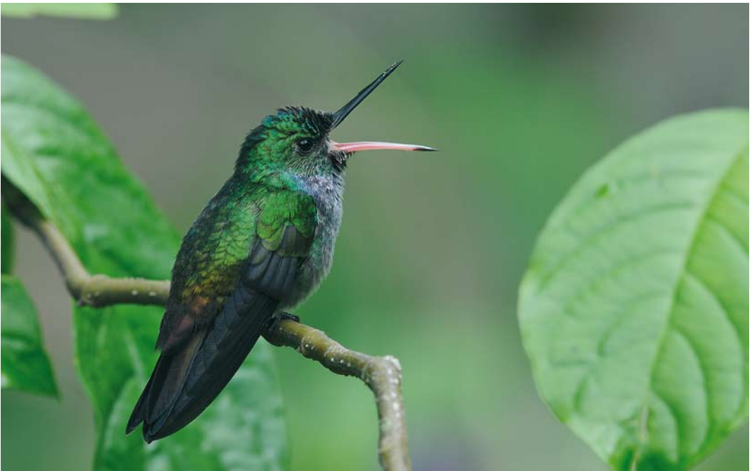
349 Blue-chested Hummingbird / Blauwborstamazilia Amazilia amabilis , Canopy Tower, Soberanía National Park, Panama, 11 June 2009