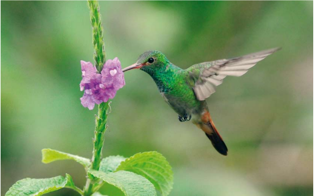
350 Rufous-tailed Hummingbird / Roodstaartamazilia Amazilia tzacatl , Forest Discovery Center, Panama, 13 June 2009 (Roef Mulder)