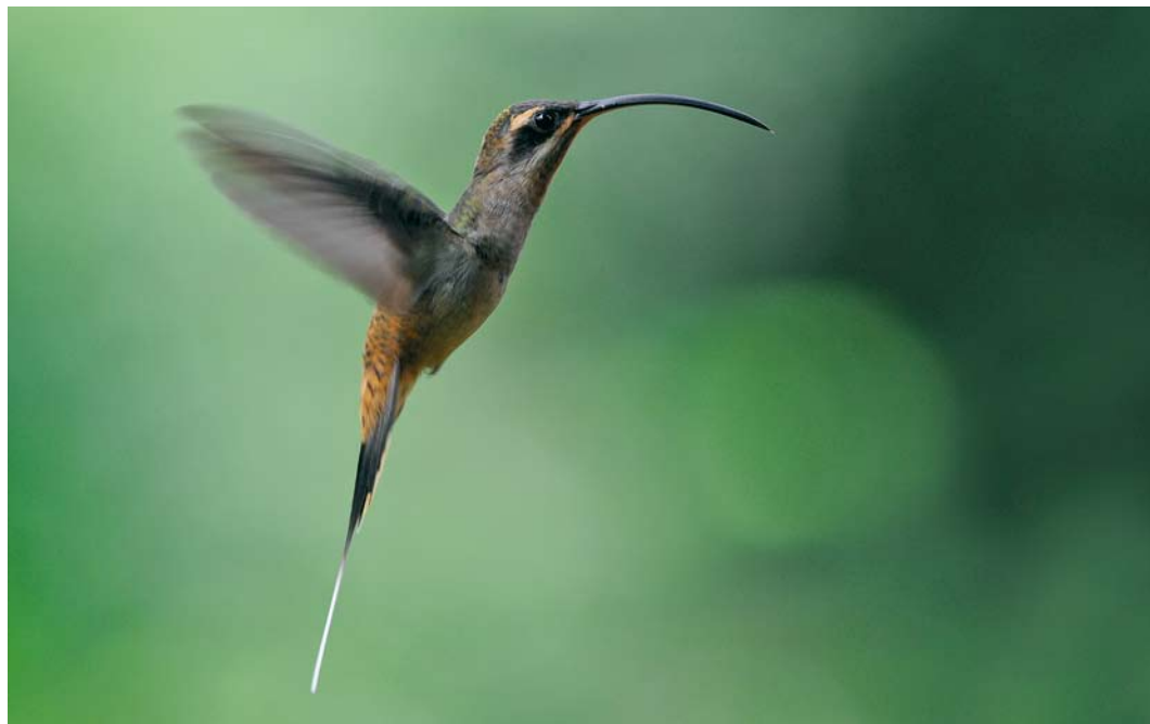
352 Long-billed Hermit / Grote Heremietkolibrie Phaethornis longirostris , Forest Discovery Center, Panama, 6 March 2009