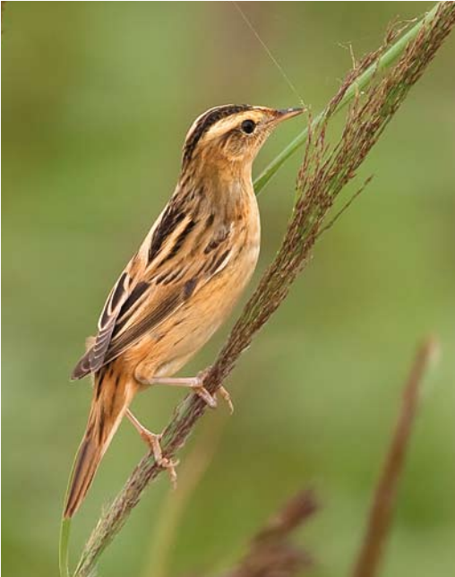
434 Waterrietzanger / Aquatic Warbler Acrocephalus paludicola , De Schorren, Texel, Noord-Holland, 18 augustus 2009