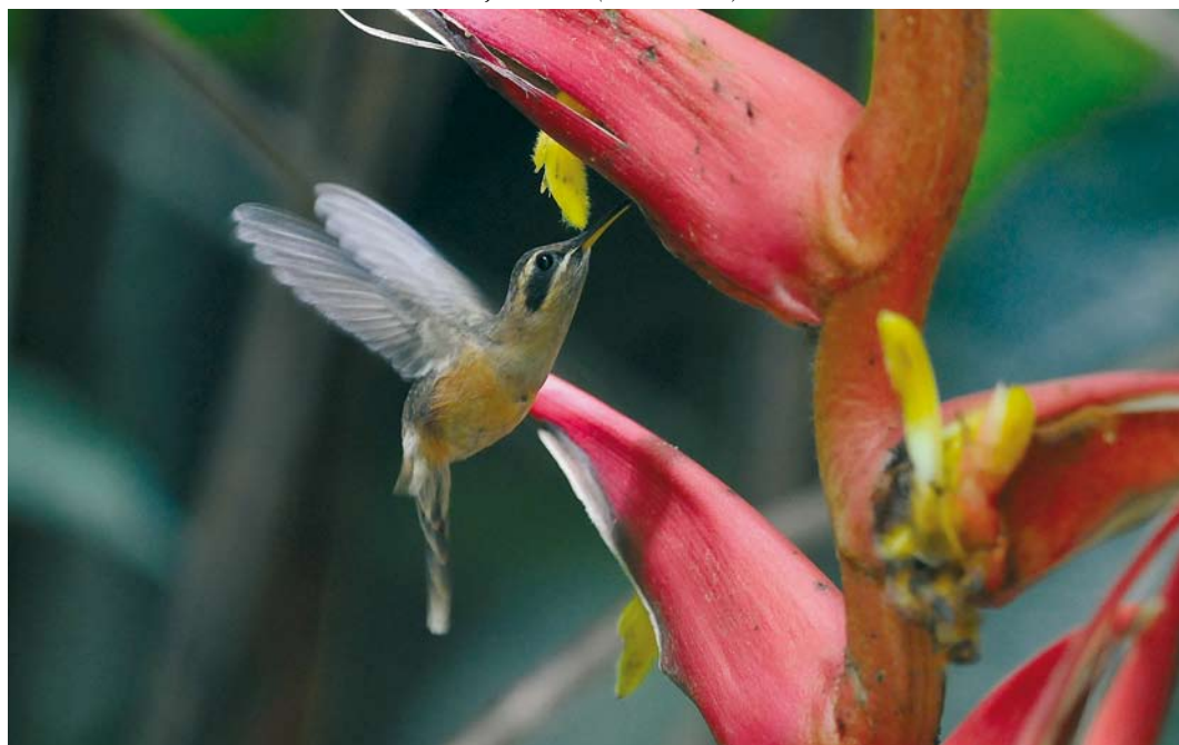
353 Stripe-throated Hermit / Kleine Streepkeelheremietkolibrie Phaethornis striigularis , El Valle, Panama, 16 June 2009