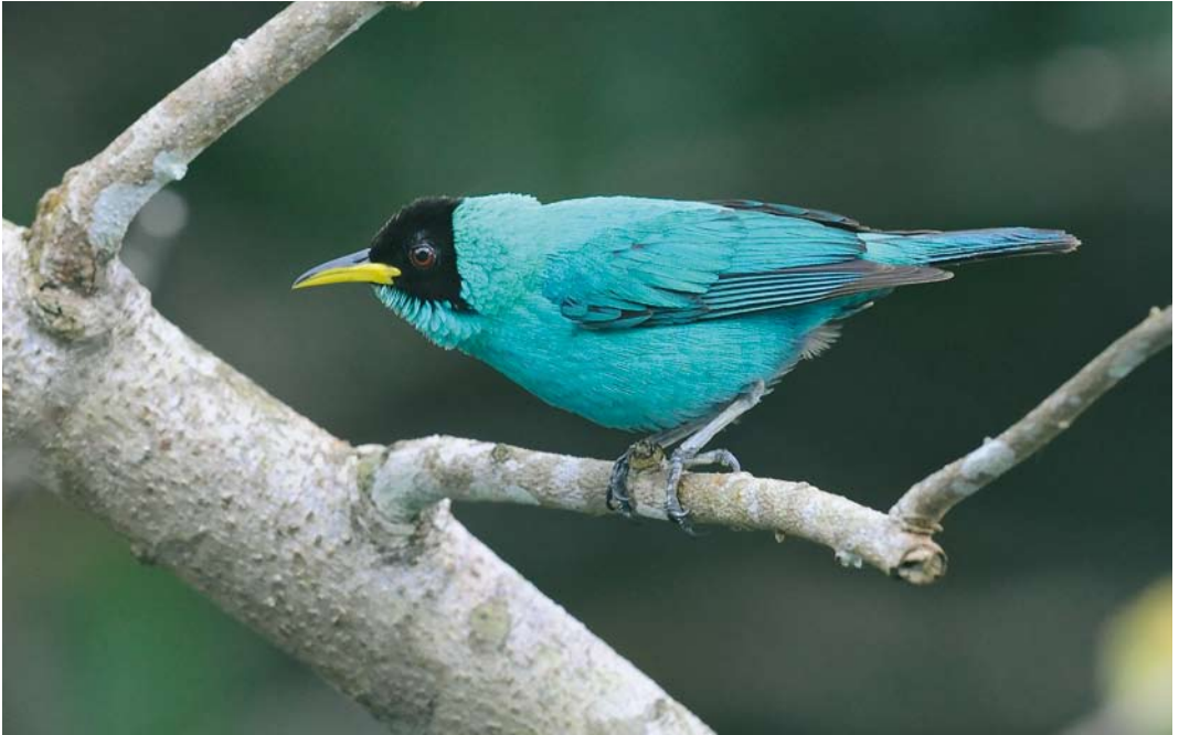
365 Green Honeycreeper / Groene Suikervogel Chlorophanes spiza , male, Canopy Tower, Soberanía National Park, Panama, 11 June 2009 (Roef Mulder)