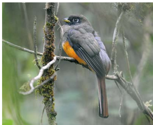
357 White-tipped Sickletail / Haaksnavelkolibrie Eutoxeres aquila , El Valle, Panama, 16 June 2009 (Roef Mulder) 358 Violet-headed Hummingbird / Paarskopkolibrie Klais guimeti , female, Canopy Lodge, El Valle, Panama, 15 June 2009 (Roef Mulder) 359 White-necked Jacobin / Witnekkolibrie Florisuga mellivora , Forest Discovery Center, Panama, 6 March 2009 (Roef Mulder) 360 Violet-bellied Hummingbird / Paarsbuikkolibrie Damophila julie , Forest Discovery Center, Panama, 13 June 2009 (Roef Mulder) 361 Red-capped Manakin / Geelbroekmanakin Pipra mentalis , male, Canopy Tower, Soberanía National Park, Panama, 2 March 2009 (Roef Mulder) 362 Orange-bellied Trogon / Oranjebuiktrogon Trogon aurantiiventris , male, Cerro Gaital, Panama, 9 March 2009 (Roef Mulder)