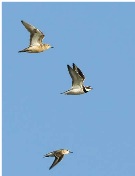
425 Marmereend / Marbled Duck Marmaronetta angustirostris , Westkapelle, Zeeland, 11 juli 2009 (Marten van Dijl/charlatanmessiah.com) 426 Blonde Ruiters / Buff-breasted Sandpiper Tryngites subruficollis , adult, met Bontbekplevier / Greater Ringed Plover Charadrius hiaticula en Kleine Strandloper / Little Stint Calidris minuta , Ezumakeeg, Friesland, 21 augustus 2009 (Jan Bosch) 427 Kleine Burgemeester / Iceland Gull Larus glaucooides , eerste-zomer, Scheveningen, Zuid-Holland, 15 juli 2009 (Marten van Dijl/charlatanmessiah.com)