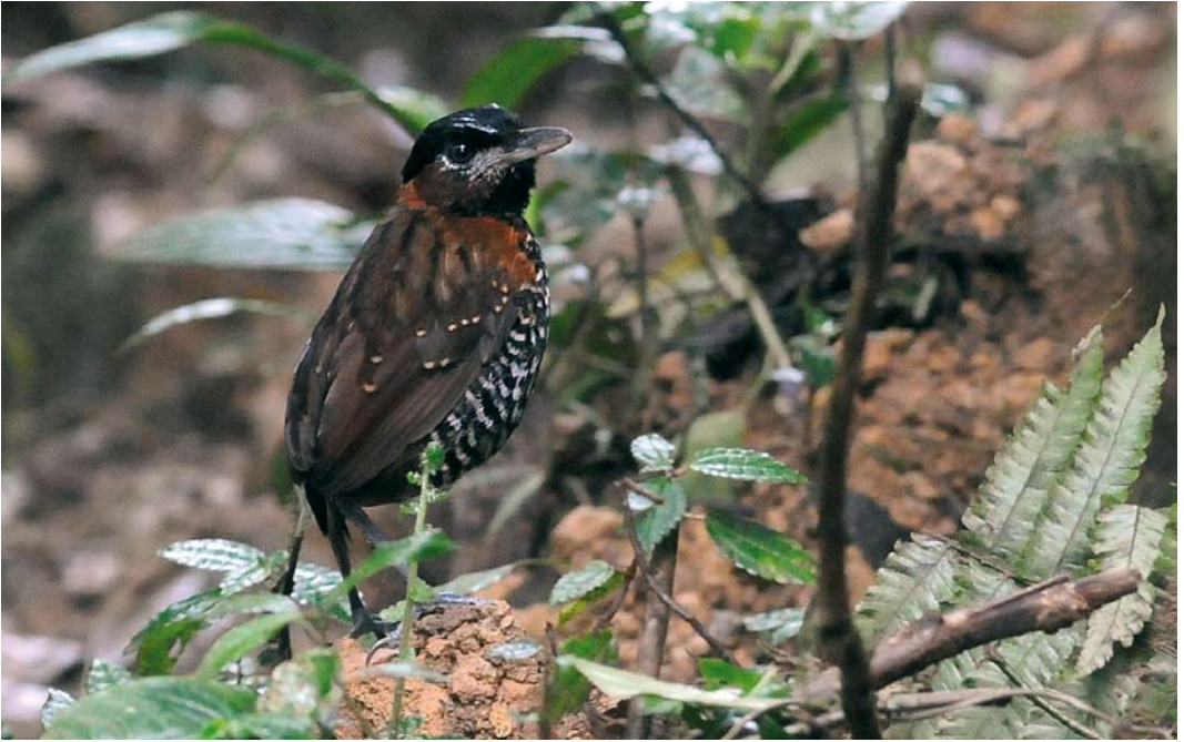
344 Black-crowned Antpitta / Zwartkruinmierpitta Pittasoma michleri , male, El Valle, Panama, 18 June 2009 (Roef Mulder)