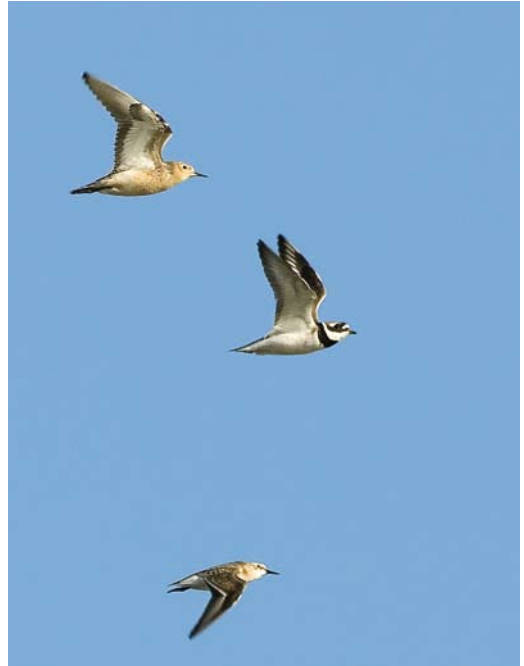
425 Marmereend / Marbled Duck Marmaronetta angustirostris , Westkapelle, Zeeland, 11 juli 2009 (Marten van Dijl/charlatanmessiah.com) 426 Blonde Ruiters / Buff-breasted Sandpiper Tryngites subruficollis , adult, met Bontbekplevier / Greater Ringed Plover Charadrius hiaticula en Kleine Strandloper / Little Stint Calidris minuta , Ezumakeeg, Friesland, 21 augustus 2009 (Jan Bosch) 427 Kleine Burgemeester / Iceland Gull Larus glaucooides , eerste-zomer, Scheveningen, Zuid-Holland, 15 juli 2009 (Marten van Dijl/charlatanmessiah.com)