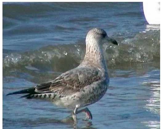
374 Stormmeeuw / Mew Gull Larus canus met kenmerken van Kamtsjatkastormmeeuw / showing characters of Kamtschatka Gull L c kamtschatschensis , eerstejaars (links / left), met / with Zilvermeeuw / Herring Gull L argentatus , eerstejaars / first-year, Egmond aan Zee, Noord-Holland, 11 februari 2005 (Leon Edelaar) 375-379 Stormmeeuw / Mew Gull Larus canus met kenmerken van Kamtsjatkastormmeeuw / showing characters of Kamtschatka Gull L c kamtschatschensis , eerstejaars, Egmond aan Zee, Noord-Holland, 11 februari 2005 (Leon Edelaar)