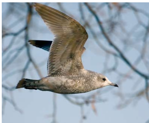
384-387 Stormmeeuw / Mew Gull Larus canus , eerste-winter, Visé, Liège, België, december 2008. Verenkleeft met aantal kenmerken van kamtschatschensis maar formaat en snavelvorm duiden op nominaat canus / Plumage showing characters of kamtschatschensis but size and bill shape indicate nominate canus .

nominaat canus en (westelijke) heinei niet altijd duidelijk is worden ze behandeld zonder apart te worden benoemd, tenzij dit aan de orde is.