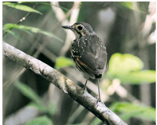
347 Streak-chested Antpitta / Brilmierpitta Hylopezus perspicillatus , male, Pipeline Road, Panama, 12 June 2009 (Roef Mulder)

Panama Bay offers shorebirds and seabirds and a half-day visit to the coast can strongly boost the trip-list, although many of the species present