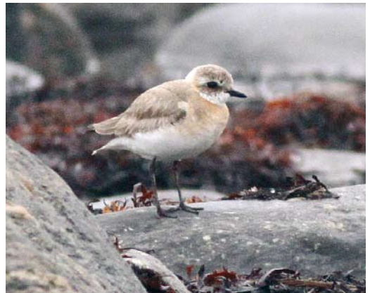
405 Eleonora's Falcon / Eleonora's Valk Falco eleonorae , Ribeira de Janela, Madeira, 14 August 2009 406 Steppe Eagle / Stepparend Aquila nipalensis , third calendar-year, Ifjordfjellet, Finnmark, Norway, 3 August 2009 407-408 Saker Falcon / Sakervalk Falco cherrug , first-year female ('Piros'), Castilla y León, Spain, 24 August 2009 409 Brown Booby / Bruine Gent Sula leucogaster , immature, off Desertas, Madeira, 1 September 2009 410 Lesser Sand Plover / Mongoolse Plevier Charadrius mongolus , female, Kristiinankaupunki, Finland, 27 July 2009