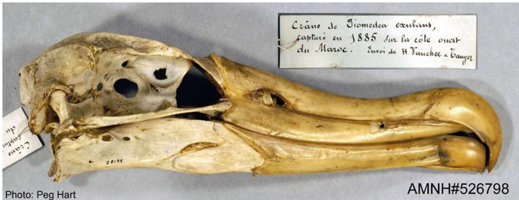
FIGURE 6 Wandering Albatross / Grote Albatros Diomedea exulans , found at Moroccan west coast, around 1885 (Peg Hart/American Museum of Natural History, New York)

nied by 'hard evidence' such as photographs (table 2). There is only one indisputable case, of a Diomedea crashing on a coastal road near Palermo, Sicily, Italy, where it was killed by a passing motorist. This is the only case of a bird that has properly been described, photographed and preserved (Orlando 1958; see below).