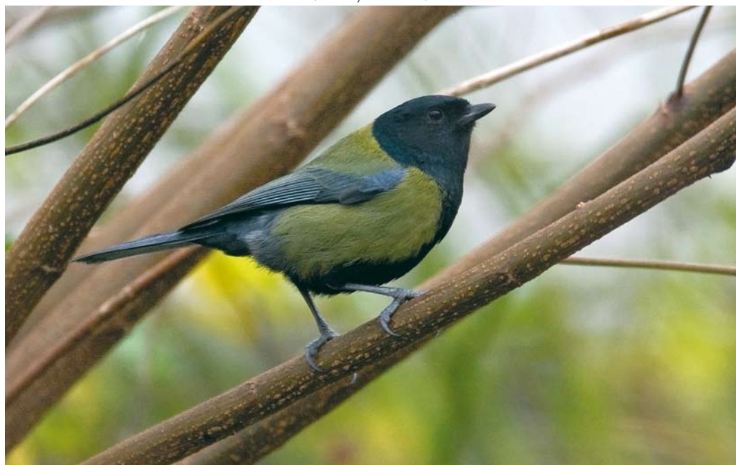
18 Koolmees / Great Tit Parus major , Krimpen aan den IJssel, Zuid-Holland, 29 november 2008 (Harvey van Diek)

Naar aanleiding van de waarneming in Krimpen aan den IJssel meldde Chris van Rijswijk (in litt) dat een vergelijkbare 'Zwartkopkoolmees' al drie winters lang (2006/07 tot 2008/09) dagelijks de tuin van zijn ouders bezoekt in Rotterdam-Overschie, Zuid-Holland (c 15 km van Krimpen aan den IJssel). Het verenkleed lijkt sterk op dat