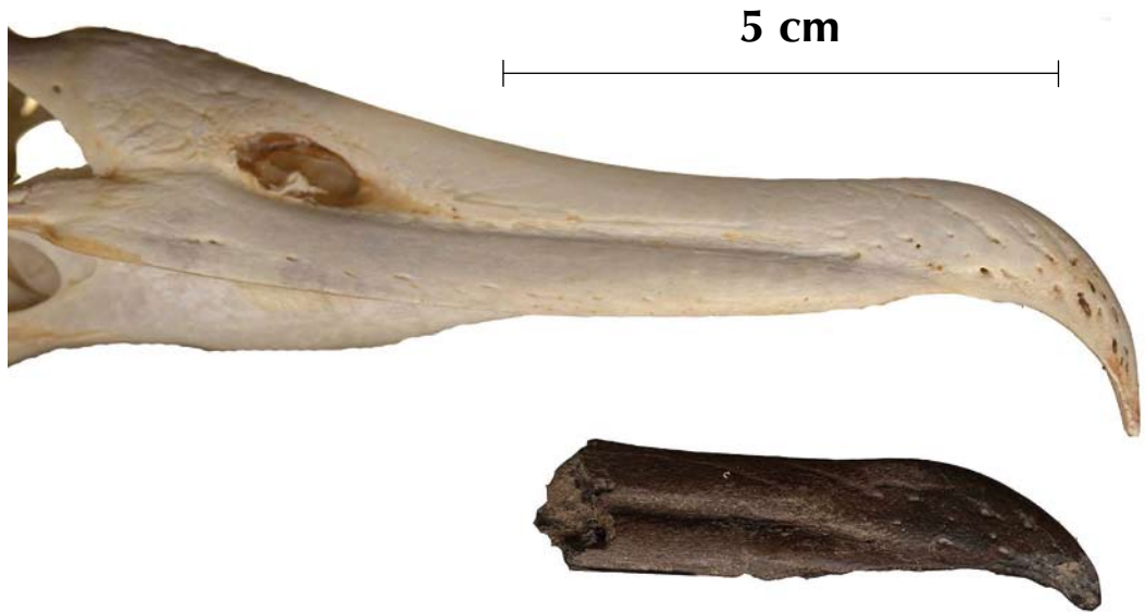
FIGURE 3 Bill-tip of Phoebastria albatross (lower), discovered among many fossil bones from late Neogene (supposedly Pliocene) deposits at Mill, Noord-Brabant, Netherlands (Erik Wijnker). Specimen is kept in Prehistoric Times Museum (Oertijdmuseum 'De Groene Poort'), Boxtel, Noord-Brabant, Netherlands (# MAB F3399). See also Olson & Hearty (2003, figure 3A) for similar fossil Phoebastria bill-tip found on Bermuda. Upper mandible (without ramphotheca) of modern Black-footed Albatross Phoebastria nigripes included for comparison.

stantial evidence, the most likely period for this bill to originate from is the early 17th century until 1876, when the old harbour front was filled up.