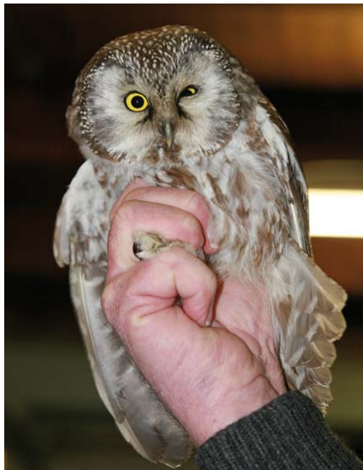
45 Koereiger / Cattle Egret Bubulcus ibis , Schiedam, Zuid-Holland, 22 december 2008 ( Wilma van Holten ) 46 Ruigpootuil / Boreal Owl Aegolius funereus (gevonden in Heino, Overijssel, op 16 december 2008), Beerzerveld, Overijssel, 17 december 2008 ( David Uit de Weerd ) 47 Kleine Burgemeester / Iceland Gull Larus glaucoides , eerstejaars, Den Helder, Noord-Holland, 27 december 2008 ( René Pop )