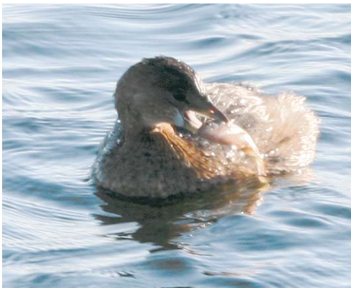
68-69 Dikbekfuut / Pied-billed Grebe Podilymbus podiceps , Kluizen, Oost-Vlaanderen, 6 januari 2009 (Johan Buckens)

Reeds eerder, op 20 oktober 2008, had ik een flitsontmoeting met vermoedelijk dezelfde vogel op precies dezelfde plaats. Tijdens een telling zag ik toen op een veel te grote afstand en in tegenlicht exact hetzelfde silhouet en gedrag. Samen met mijn vriendin Petra Beernaert hebben we nog zeker twee uur vruchteloos gezocht naar de verdachte 'dikke Dodaars'. De naam Dikbekfuut viel toen al maar het was Petra die maande tot voorzichtigheid. Verschillende bezoeken daarna leverden niets meer op en de 'zaak Dikbekfuut' werd gesloten – tot vandaag! Beseffend dat dit de eerste waarneming was voor België en een volkstoeloop kon en zou teweegbrengen belde ik dezelfde avond nog met Danny Camerlinck (die de waargenomen kenmerken kon verifiëren aan de hand van veldgidsen), Pieter d'Haluin, Peter Adriaens en Hilbran Verstraete voor overleg. Dinsdagmorgen 6 januari konden bovengenoemde personen samen met Johan Buckens en Kenny Hessel de waarneming bevestigen. Nog voordat we definitieve toelatingen konden regelen om het terrein te betreden ging dit nieuws als een lopend vuurtje rond en waren nieuwsgierigen niet meer tegen te houden. Bijna kwam mijn vergunning in het geding omdat vele enthousiastelingen over hekken en draad het terrein binnenslopen. Dankzij overleg, lobbywerk en bemiddeling via Peter Adriaens en Lieven De Schampheleere (Natuurpunt) met de algemene directeur Alfred Bauwens van de Vlaamse Maatschappij voor Watervoorziening (eigenaar