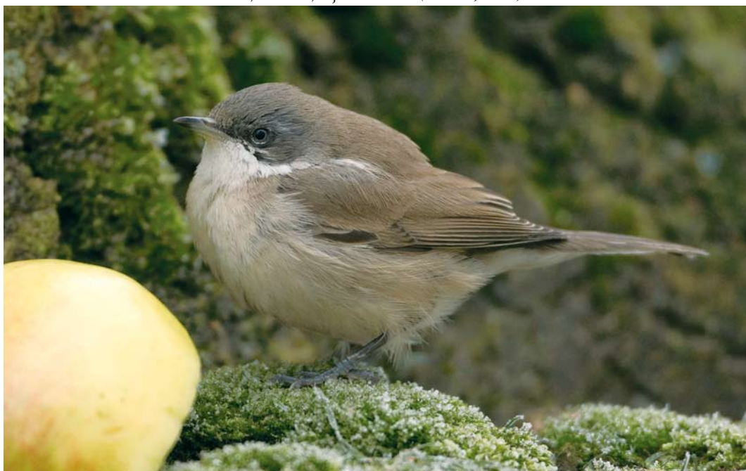
60 Waarschijnlijke Vale Braamsluiper / presumed Central Asian Lesser Whitethroat Sylvia curruca halimodendri , Ees, Drenthe, 8 januari 2009