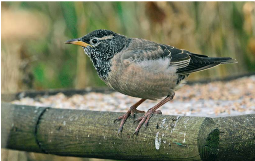
61 Roze Spreeuw / Rosy Starling Pastor roseus , eerstejaars, Den Helder, Noord-Holland, 27 december 2008