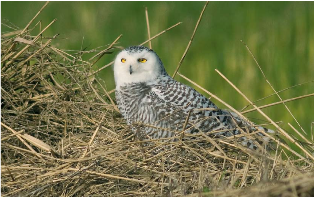
44 Sneeuwuil / Snowy Owl Bubo scandiacus , eerstejaars vrouwtje, Zeeburg, Texel, Noord-Holland, 17 november 2008