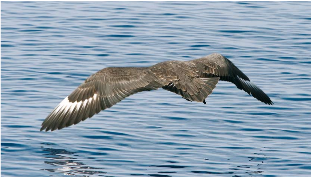
7 South Polar/Brown Skua / Zuidpooljager/Subantarctische Grote Jager Stercorarius maccormicki/antarcticus , off La Palma, Canary Islands, 6 October 2005

South Polar Skua is a monotypic species and breeds around the coast of Antarctica between October and February. After breeding, adults probably stay close to their breeding grounds. Juveniles and immatures, on the other hand, are long-distance migrants and perform a clockwise movement in the Pacific and Atlantic Ocean. In the Pacific Ocean, it is a common visitor along the coasts of Japan, and the west coast of Canada, the USA and Mexico. In the Atlantic Ocean, South Polar Skua is much scarcer. There are several