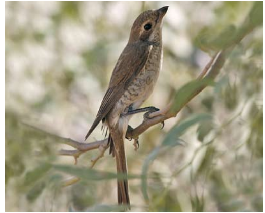
24 Red-backed Shrike / Grauwe Klauwier Lanius collurio , first-winter, El Gouna, Egypt, 11 September 2008

age distinctly concave, producing a narrow or thin bill-tip, whilst on Sykes's the sides are more convex, producing a broader bill when viewed from above or below. In the mystery bird, the bill looks rather long but more details are not visible due to its posture. The longer bill, however, is again in favour of Sykes's.