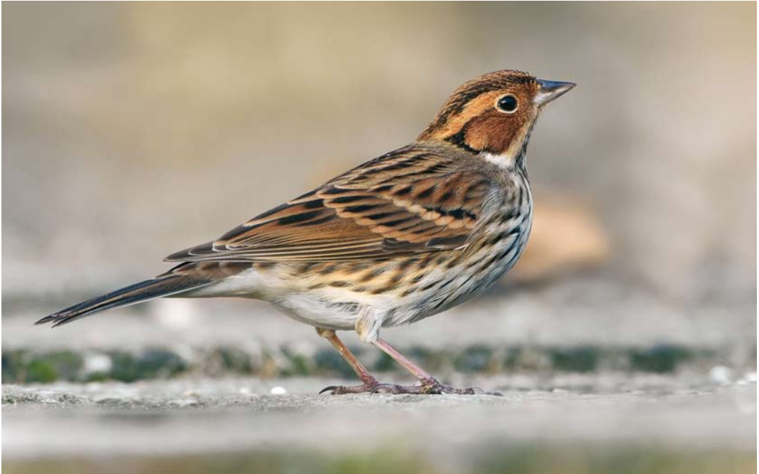
63 Dwerggors / Little Bunting Emberiza pusilla , Westzeedijk, Rotterdam, Zuid-Holland, 22 december 2008

trekkende Ijsgorzen Calcarius lapponicus doorgegeven. Een late Bosgors Emberiza rustica werd op 17 november gevangen op Schiermonnikoog. Het merendeel van de najaarsgevallen stamt uit de periode tussen 21 september en 21 oktober. Tot en met 2007 zijn er vier gevallen uit november, waarvan die op 9 november 1993 in Spaarnwoude, Noord-Holland, de laatste datum betrof. Op 7 november trok een Dwerggors E pusilla langs de Nolledijk bij Vlissingen, Zeeland, en van 15 tot 22 december hield een andere zich op midden in Rotterdam. In het hamsterreservaat bij Sibbe, Limburg, werden deze