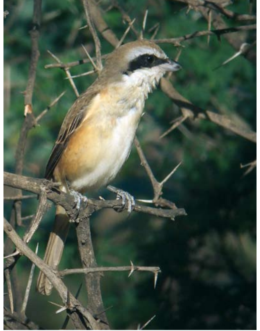
38 Snowy Owl / Sneeuwuil Bubo scandiacus , Uitkerke, West-Vlaanderen, Belgium, 29 December 2008 ( Filip De Ruwe ) 39 Brown Shrike / Bruine Klauwier Lanius cristatus cristatus , adult female, Ayn Hamran, Oman, 28 November 2008 ( Mattias Ullman ) 40 Snowy Owl / Sneeuwuil Bubo scandiacus , Uitkerke, West-Vlaanderen, Belgium, 29 December 2008 ( Filip De Ruwe )