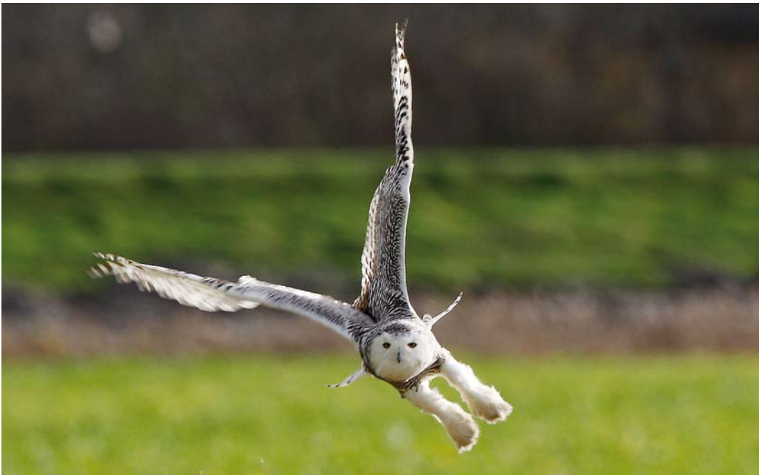
22 Sneeuwuil / Snowy Owl Bubo scandiacus , eerstejaars vrouwtje, Zeeburg, Texel, Noord-Holland, 17 november 2008 (Eric Menkveld)

Otus scops met voorkeur voor de laatste. Annelies raakte in een drukke mailwisseling met Bas van der Burg die aangaf dat het vast wel om een Vroedmeesterpad zou gaan. Ook dat was echter interessant voor de regio, dus na zwaar aandringen van Annelies ging Bas op zondag 25 mei eindelijk eens luisteren – en al vanuit de auto moest hij toegeven dat hij luisterde naar de achtste Dwergooruil ooit. Omdat de vogel zich op het terrein van een zorginstelling bevond werden met het bestuur spelregels afgesproken. Het was de eerste twitchbare sinds het geval in de Ooijpolder, Gelderland, in mei-juni 1998, en hij trok de volgende avond ruim 200 waarnemers. Tot en met 19 juni was hij te horen en soms in de schemering vliegend te zien en het bleef een publiekstrekker. Eveneens op 23 mei werd een Oeraluil Strix uralensis gefotografeerd bij Boxmeer, Noord-Brabant, die uiteindelijk belandde in een vogelopvang in St Anthonis. Hij droeg een ring die wijst op niet-wilde herkomst. Opmerkelijk is dat er in het voorjaar twee Velddrietzangers Acrocephalus agricola werden gevangen: op 30 mei bij Beetsterzwaag, Friesland, en op 2 juni in het Zwanenwater, Noord-Holland. Deze laatste was hier op 4 juni aan het zingen en werd nogmaals gevangen maar