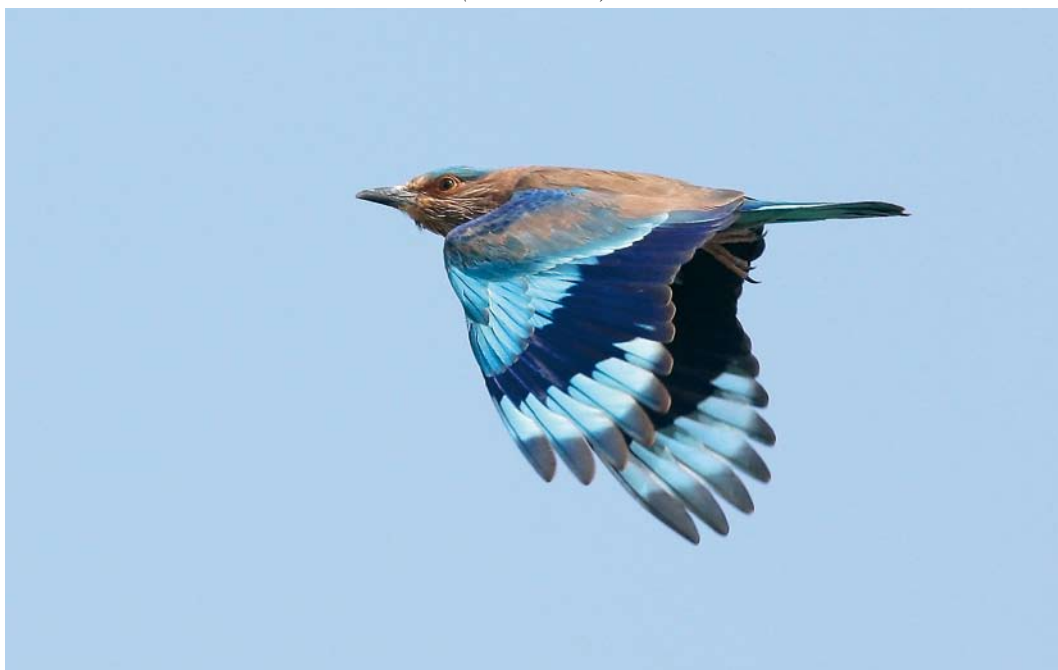
28 Indian Roller / Indische Scharrelaar Coracias benghalensis , Jahra farms, Kuwait, 27 December 2008 ( Kris De Rouck )