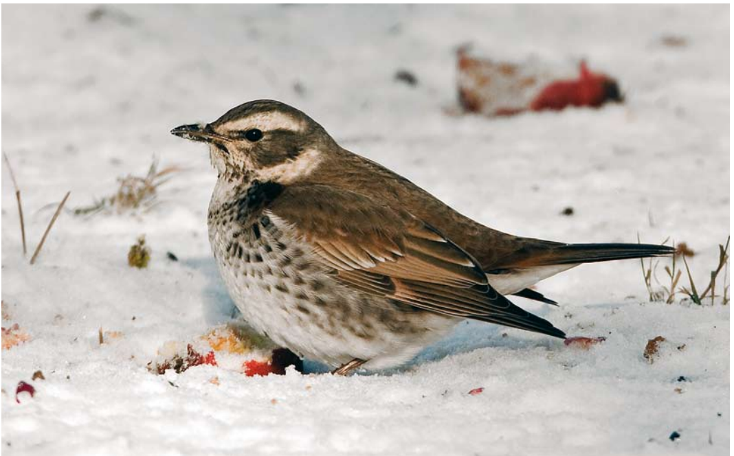
67 Dusky Thrush / Bruine Lijster Turdus eunomus , first-winter, Ezerée, Luxembourg, Belgium, 9 January 2009