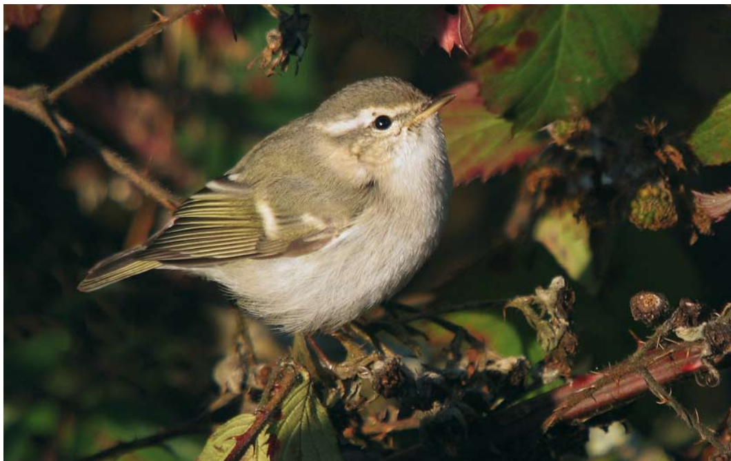
59 Humes Bladkoning / Hume's Leaf Warbler Phylloscopus humei , Offingawier, Friesland, 28 december 2008