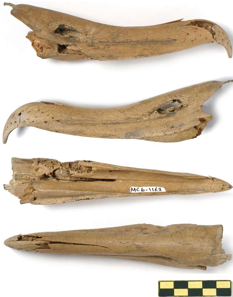
FIGURE 1 Lateral (upper two), ventral and dorsal (lower) views of upper mandible of Diomedea albatross found in Amsterdam, Noord-Holland, Netherlands, on 19 October 1977