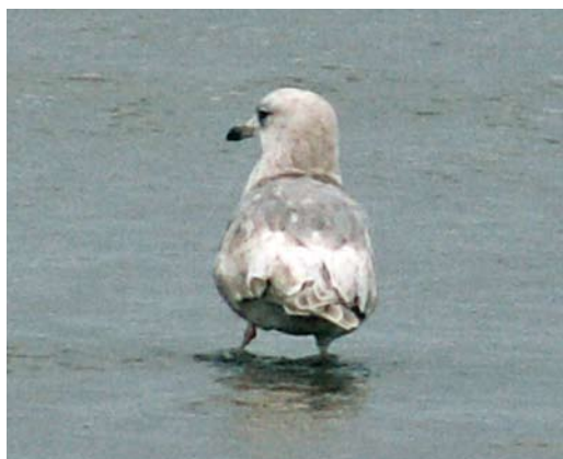
1-6 Kumliens Meeuw / Kumlien's Gull Larus glaucooides kumlieni , tweede-winter, West aan Zee, Terschelling, Friesland, 30 januari 2005 (Martijn Bunskoek)