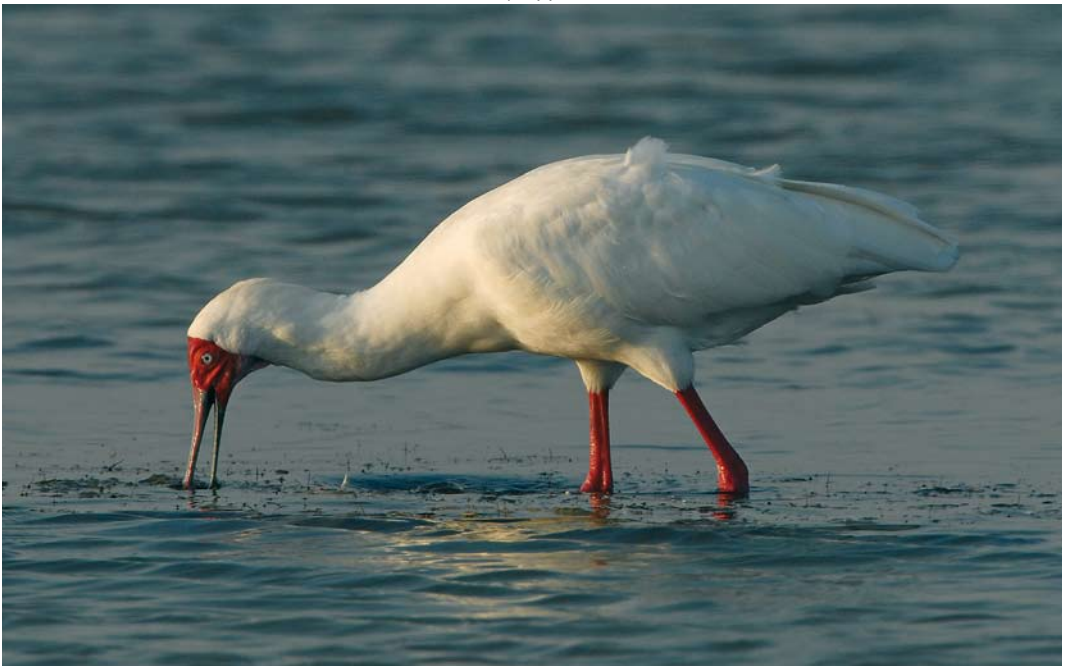
26 African Spoonbill / Afrikaanse Lepelaar Platalea alba , East Khawr, Salalah, Oman, 12 November 2008 (Ray Tipper)