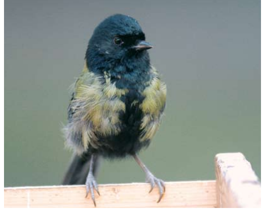
21 Koolmees / Great Tit Parus major , Rotterdam-Overschie, Zuid-Holland, 29 december 2008

het meespeuren op internet naar meer informatie.