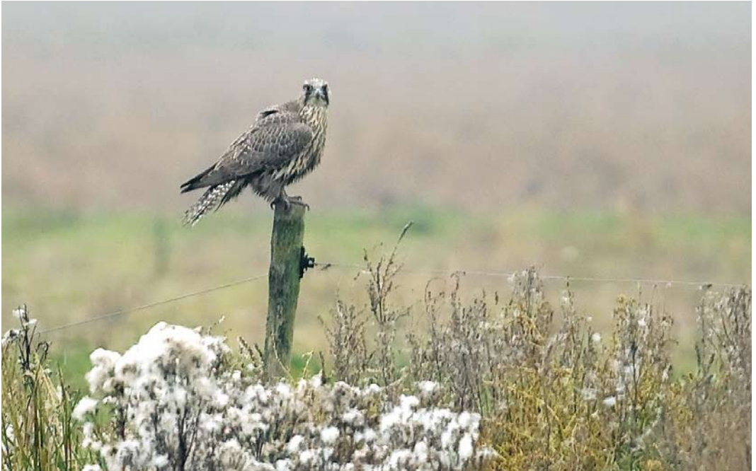
43 Giervalk / Gyr Falcon Falco rusticolus , onvolwassen, Hongerige Wolf, Groningen, 3 november 2008