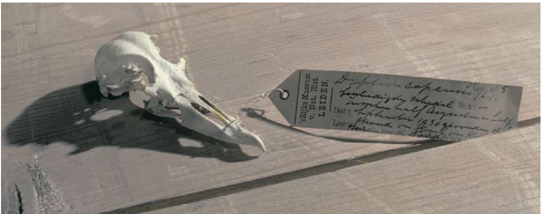
11 Cape Petrel / Kaapse Stormvogel Daption capense (reportedly shot at Crumlin, near Dublin, Dublin, Ireland, on 30 October 1881), Natural History Museum of Ireland, Dublin, Ireland, 7 March 2008 (Nigel Monaghan/Natural History Museum of Ireland) 12 Cape Petrel / Kaapse Stormvogel Daption capense , immature (collected at sea, off Sciacca, Agrigento, Sicily, Italy, in September 1964), private collection of Gino Fantin, Treviso, Veneto, Italy, November 1973 (Bruno Massa) 13 Cape Petrel / Kaapse Stormvogel Daption capense , skull (found at Hoek van Holland, Zuid-Holland, Netherlands, between mid August and mid September 1930), Nationaal Natuurhistorisch Museum/Naturalis, Leiden, Zuid-Holland, Netherlands, April 1983 (Arnoud B van den Berg)

1998) mainly because of the probability of ship assistance (Paul Milne in litt).