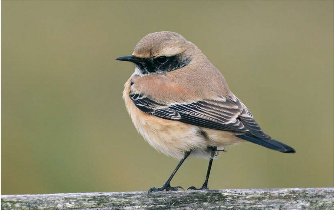
57 Woestijntapuit / Desert Wheatear Oenanthe deserti , mannetje, Schoorl, Noord-Holland, 12 november 2008 (Thomas Luiten)