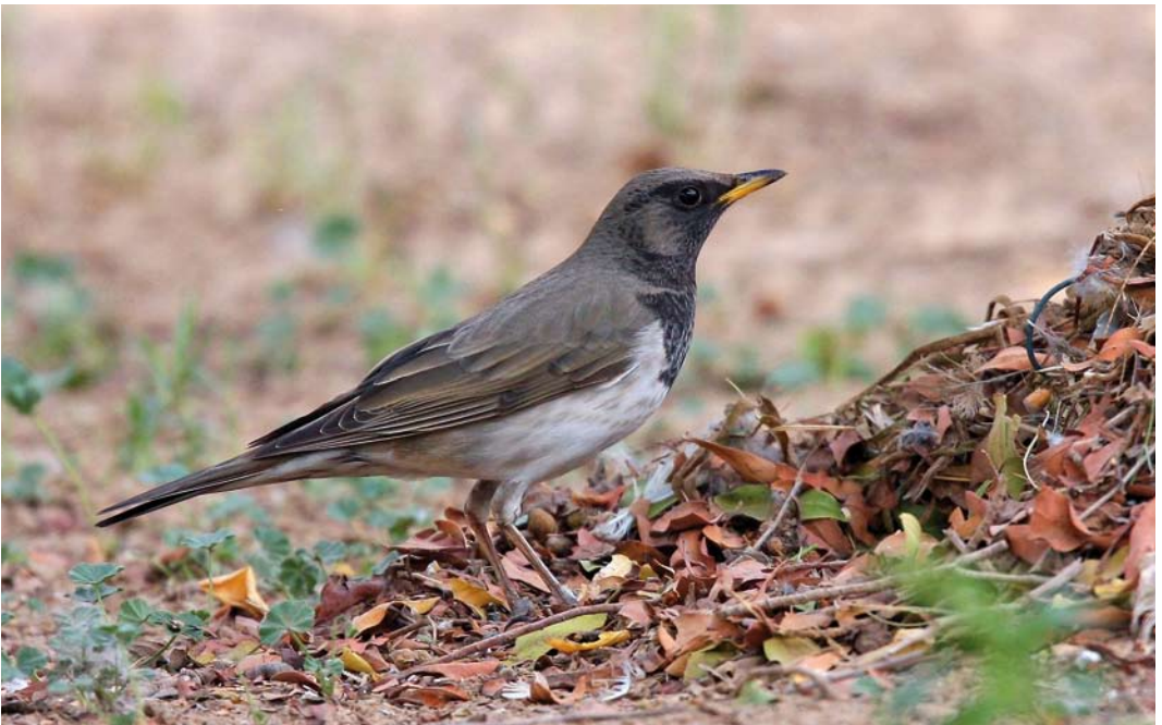
42 Black-throated Thrush / Zwartkeellijster Turdus atrogularis , male, Jahra farms, Kuwait, 30 December 2008