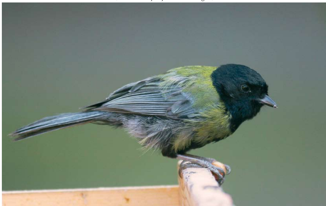
19 Koolmees / Great Tit Parus major, Rotterdam-Overschie, Zuid-Holland, 29 december 2008