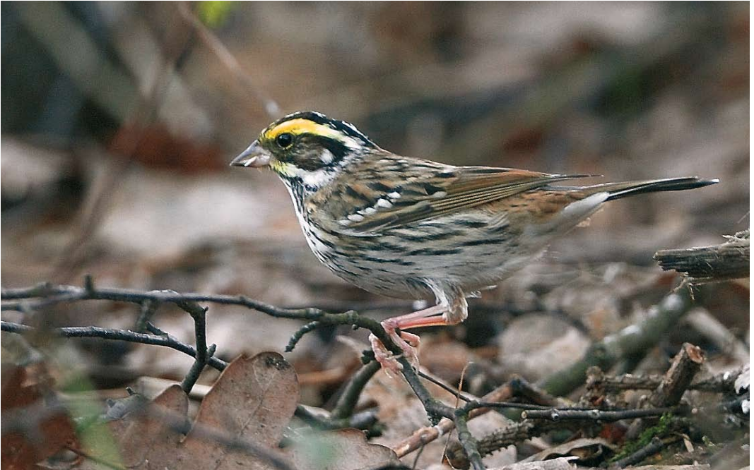
41 Yellow-browed Bunting / Geelbrauwgors Emberiza chrysophrys , Säbysjön, Uppland, Sweden, 14 January 2009 (Michael Bergman)