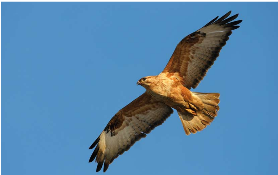
27 Long-legged Buzzard / Arendbuiserz Buteo rufinus , subadult, Doel, Oost-Vlaanderen, Belgium, 11 January 2009 ( Jan den Hertog )