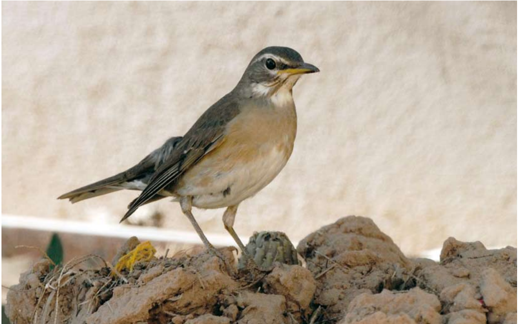
16-17 Eyebrowed Thrush / Vale Lijster Turdus obscurus , first-year, Merzouga, Tafilalt, Morocco, 17 December 2008