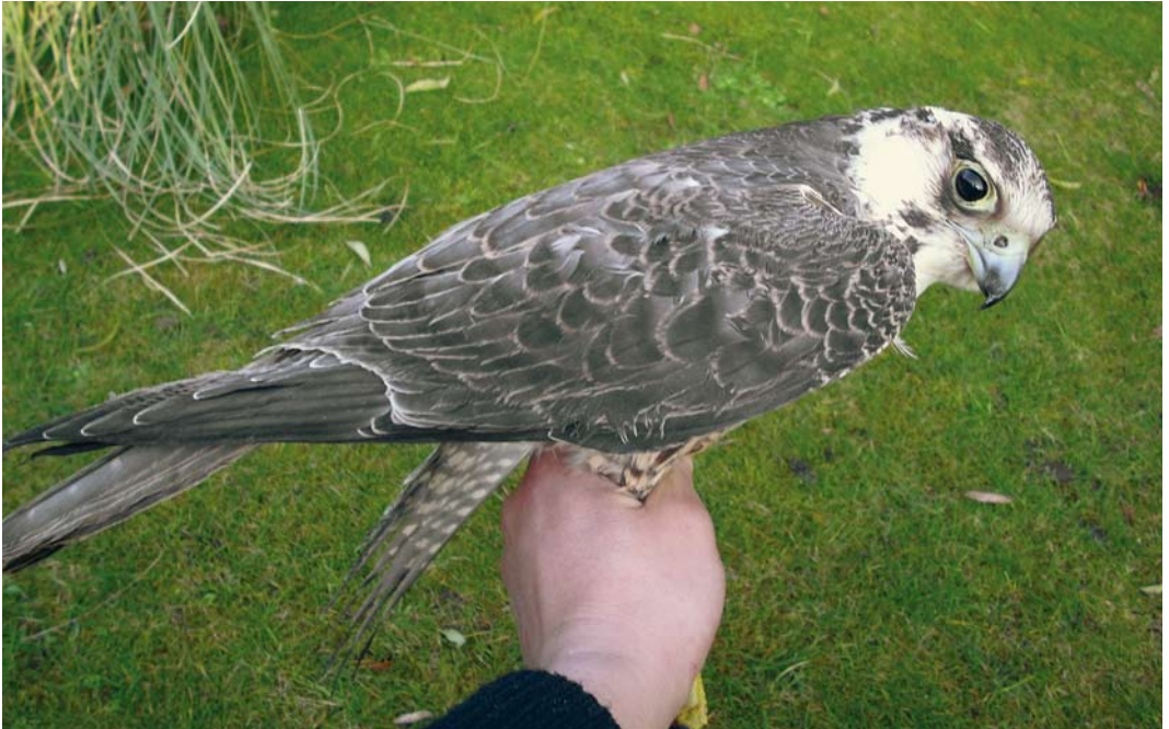
64-65 Toendraslechtvalk / Tundra Peregrine Falcon Falco peregrinus calidus , eerstejaars, Darisdonk, Oud-Turnhout, Antwerpen, België, 13 december 2008