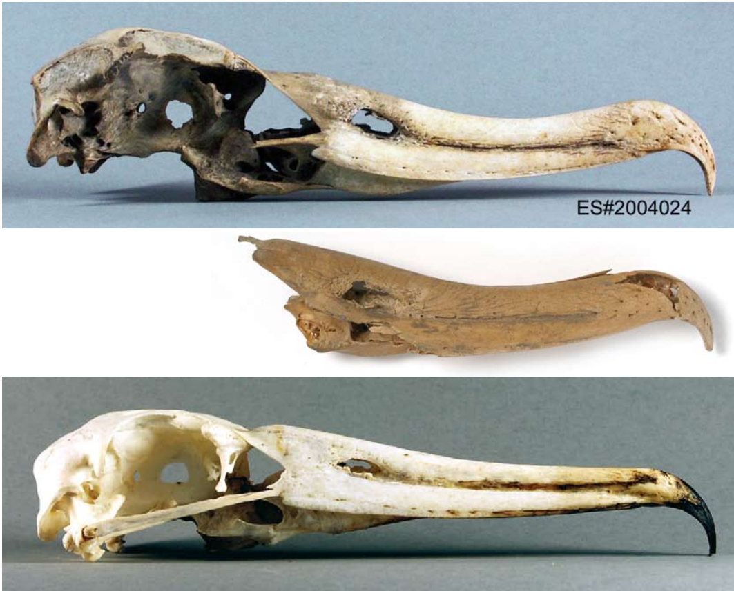
FIGURE 2 Mandible of Diomedea albatross found in Amsterdam, Noord-Holland, Netherlands, on 19 October 1977 (middle) compared with similarly sized bills (brain case and upper mandible only) of Wandering Albatross Diomedea exulans (top) and Waved Albatross Phoebastria irrorata (bottom). Note different profiles: clearly curved in Diomedea and much straighter in Phoebastria . Phoebastria also has more delicate bill-tip than Diomedea .

C14 from pools in which C14 may have circulated for a long time. As a result, deviations of up to 400 years make this method useless for recent marine top predators. Therefore, dating the bill by analyzing the local circumstances seems the most realistic approach. However, location MC6 is problematic in this respect. The old harbour front has been filled up with refuse, and the 20th century digging did not produce a clear stratigraphy. Only artifacts from the second half of the 15th century and from the 19th century were found (Wiard Krook in litt) and artifacts from the centuries in between were lacking. As pointed out below, it is very likely that the albatross bill belonged to a bird that was caught by a sailor or ship passenger and discarded in the harbour directly, or that it ended up in town