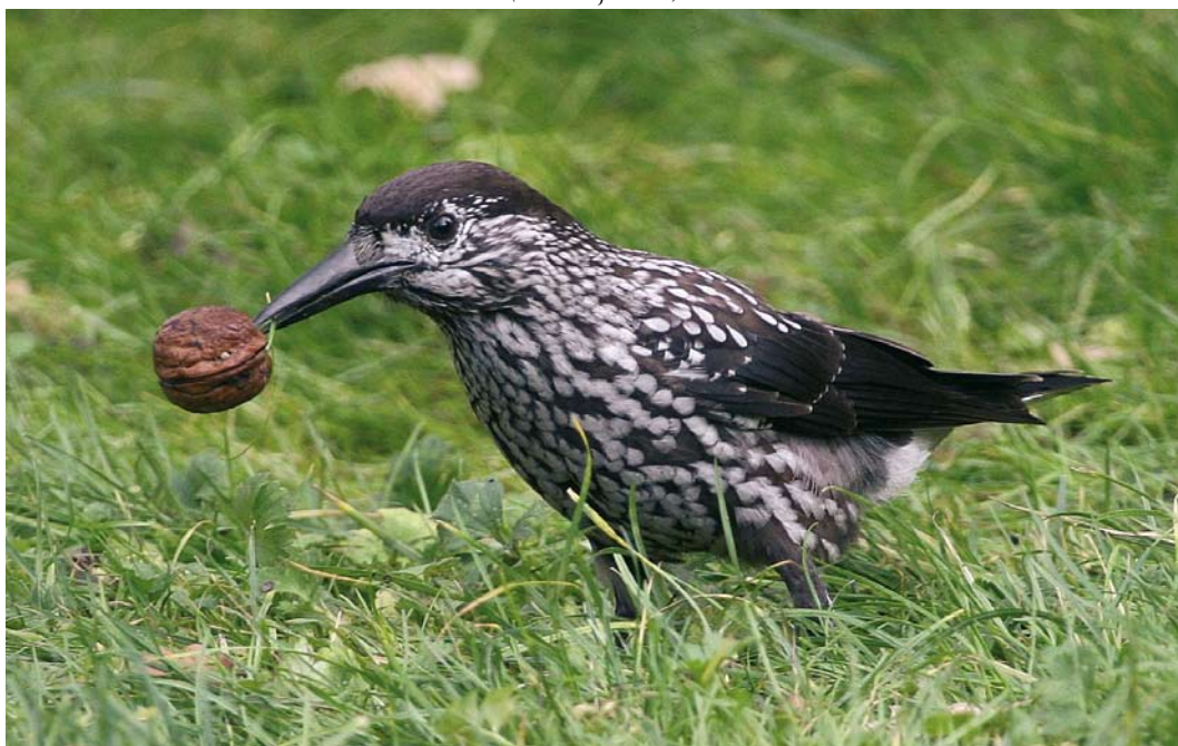
62 Notenkraker / Spotted Nutcracker Nucifraga caryocatactes , Dongen, Noord-Brabant, 8 november 2008