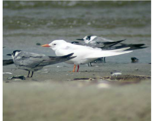
14-15 Leucistic Common Tern / Visdief Sterna hirundo , with normally coloured Common Tern / Visdief and Black Terns / Zwarte Sterns Chlidonias niger , Swinoujscie, Poland, 4 August 2008 (Lukasz Lawicki)

was detected. In general, plumage mutations among Sternidae are rare (van Grouw 2006, Hein van Grouw in litt). Up to now, only one example of a leucistic Common Tern has been published in the literature. This concerns a bird photographed by Martin Budding at Maasvlakte, Zuid-Holland, the Netherlands, on 11 September 1988 (cf Dutch