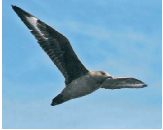
8-9 South Polar/Brown Skua / Zuidpooljager/Subantarctische Grote Jager Stercorarius maccormicki/antarcticus , off La Palma, Canary Islands, 6 October 2005

records from Brazil, the West Indies, Newfoundland, Canada, and Greenland (Salomonsen 1976) but only one definite record from the eastside of the ocean: a bird collected in the Faeroes in September 1889. The only two other Western Palearctic records are from Eilat, Israel (3-6 June 1983 and 28 June 1992; Shirihai 1996). The status of a bird reported between Hurghada and Giftun island, Egypt, on 10 June 1991 (cf Shirihai 1996) is unclear. In addition, for Egypt, Goodman & Meininger (1989) give five older records of 'Great or South Polar Skua' during March-January 1959-64 at Port Said and in the Gulf of Suez on 17 August 1957. Off the coast of Senegal, it is apparently a regular visitor (cf Baillon & Dubois 1992, Marr & Porter 1992).