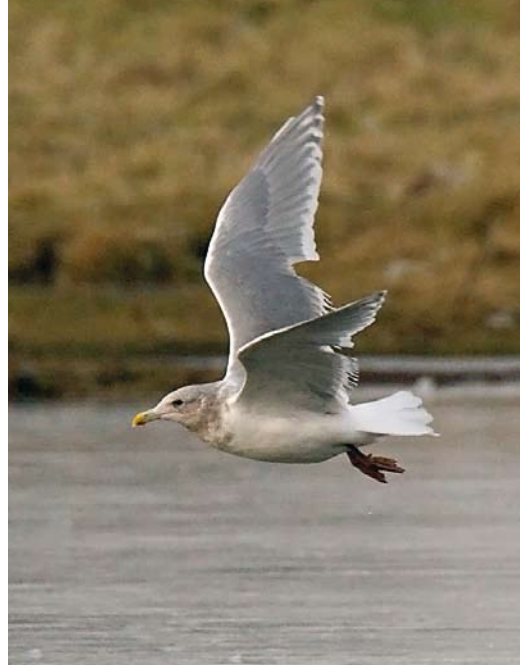
35 Green Heron / Groene Reiger Butorides virescens , adult, Berre l'Étang, Bouches-du-Rhône, France, 29 December 2008 36 Glaucous-winged Gull / Beringmeeuw Larus glaucescens , adult, Cowpen Bewley, Cleveland, England, 10 January 2009 37 Ivory Gull / Ivoormeeuw Pagophila eburnea , first-year, Simrishamn, Skåne, Sweden, 13 December 2008