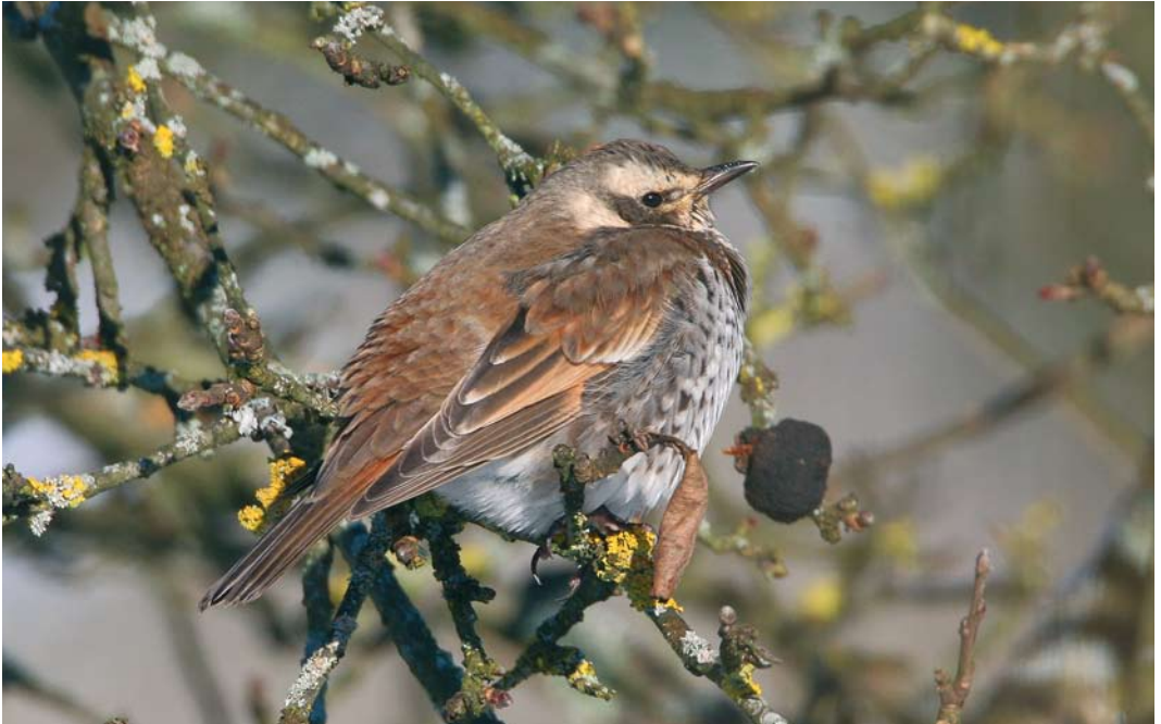
66 Dusky Thrush / Bruine Lijster Turdus eunomus , first-winter, Ezerée, Luxembourg, Belgium, 9 January 2009 (Martin van der Schalk)