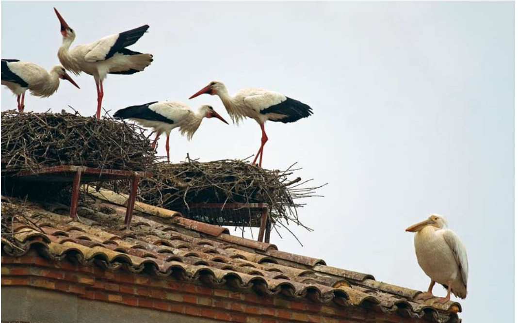
25 Great White Pelican / Roze Pelikaan Pelecanus onocrotalus , with White Storks / Ooievaars Ciconia ciconia , Torres de Segre, Lerida, Spain, 22 December 2008