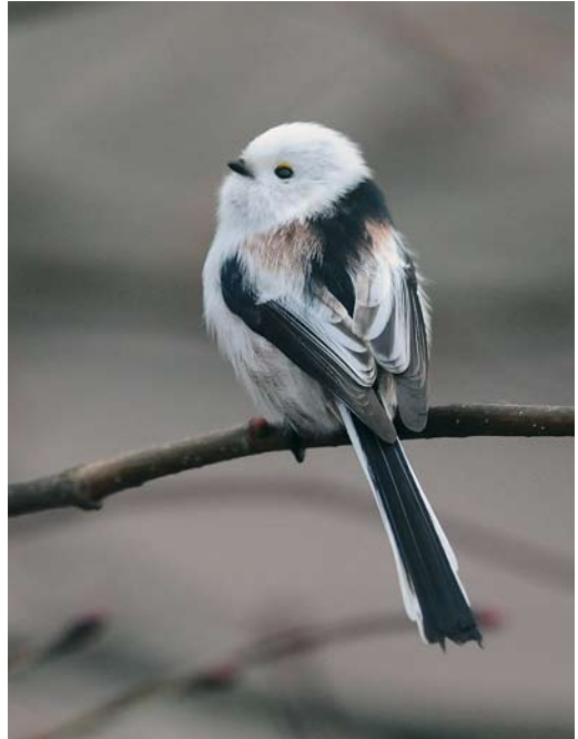
48 Witstuitbarmsijs / Arctic Redpoll Carduelis hornemanni , Acht, Noord-Brabant, 22 november 2008 49 Witkopstaartmees / White-headed Long-tailed Tit Aegithalos caudatus caudatus , Pieterzijl, Groningen, 21 december 2008 50 Beflijster / Ring Ouzel Turdus torquatus , mannetje, Berkheide, Zuid-Holland, 30 december 2008