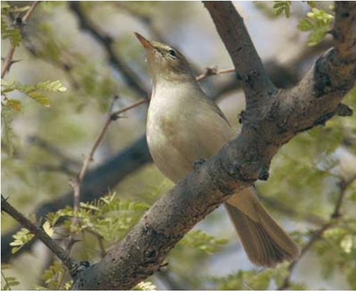
23 Sykes's Warbler / Sykes' Spotvogel Acrocephalus rama , Pushkar, Rajasthan, India, 6 January 2008 (Sander Lagerveld)