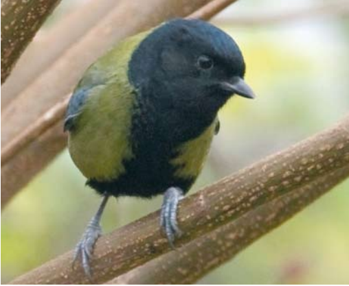
20 Koolmees / Great Tit Parus major , Krimpen aan den IJssel, Zuid-Holland, 29 november 2008 (Harvey van Diek)