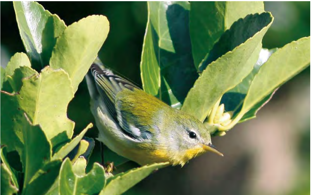
530 Northern Parula / Brilparulazanger Parula americana , Île de Sein, Finistère, France, 23 October 2009 (Julien Renoult)