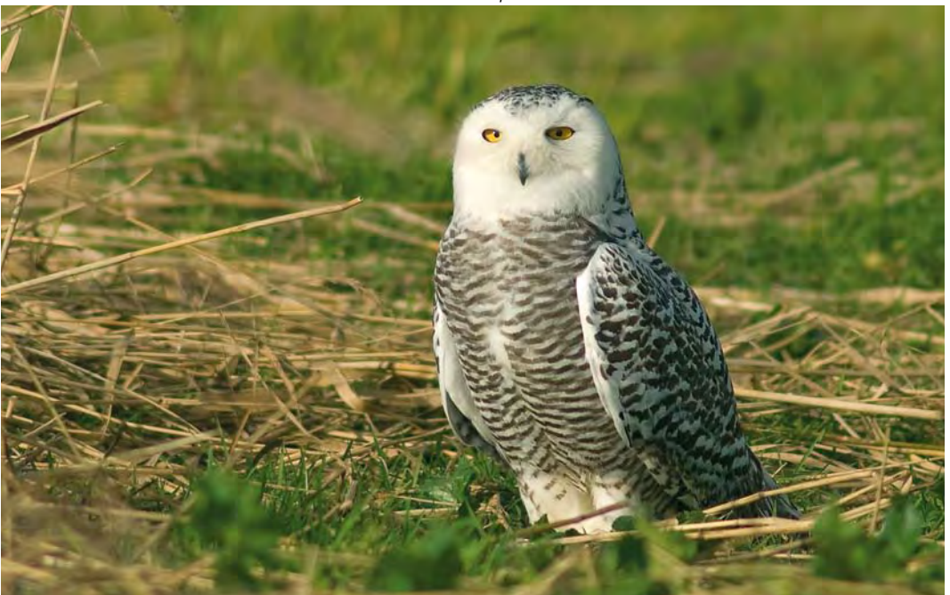
450 Snowy Owl / Sneeuwuil Bubo scandiacus , first-winter female, Texel, Noord-Holland, 17 November 2008