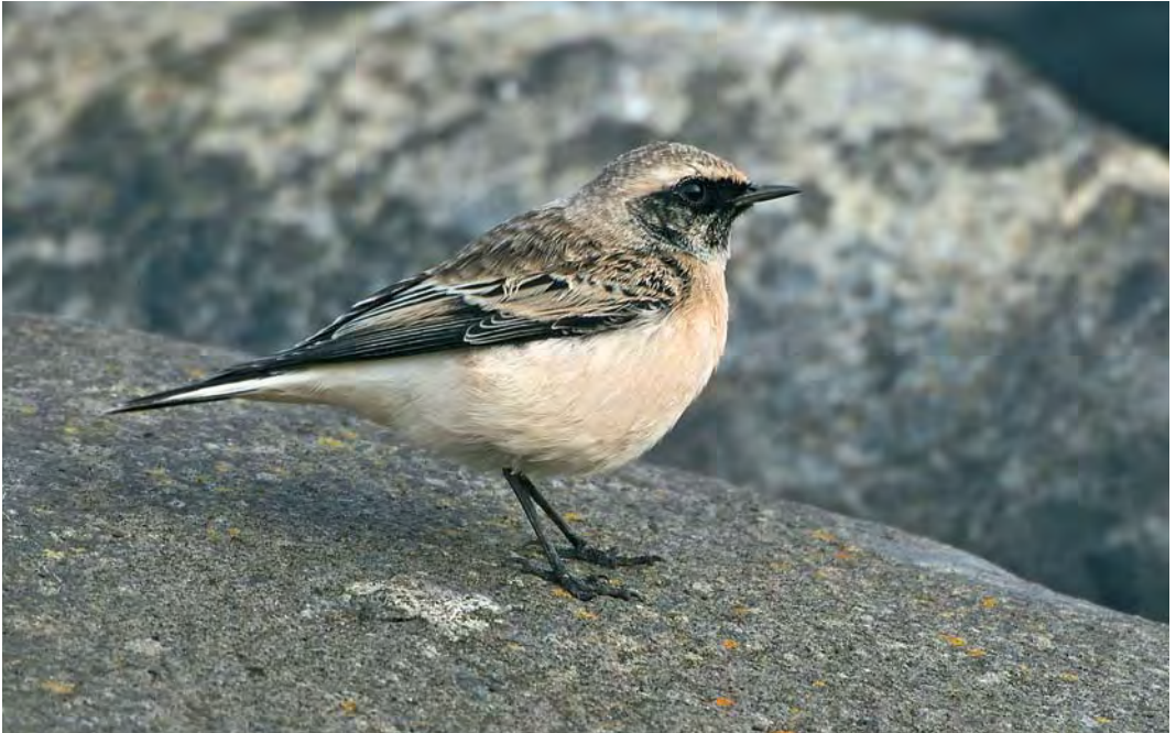
455 Pied Wheatear / Bonte Tapuit Oenanthe pleschanka , adult male, Jan Ayeslag, Texel, Noord-Holland, 13 October 2008