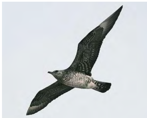
492 Parasitic Jaeger / Kleine Jäger Stercorarius parasiticus , first-summer, Skagen, Nordjylland, Denmark, 16 July 2009. Note juvenile-like plumage in both pattern and freshness, comparable with first-summer Long-tailed Jaeger S. longicaudus . This individual seemed to have completed its post-juvenile moult. Central tail-feathers missing or growing, possibly indicating start of moult to second-winter plumage.