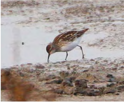
568 Taigastrandloper / Long-toed Stint Calidris subminuta , juveniel, Vreugderijkerwaard, Overijssel, 24 oktober 2009 (Martin van der Schalk)