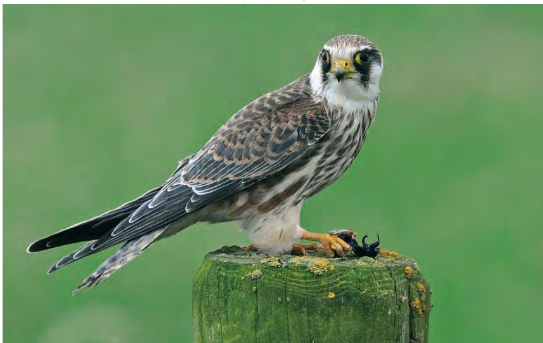
545 Roodpootvalk / Red-footed Falcon Falco vespertinus , juveniel, Kollumerwaard, Friesland, 6 september 2009 (Roef Mulder)