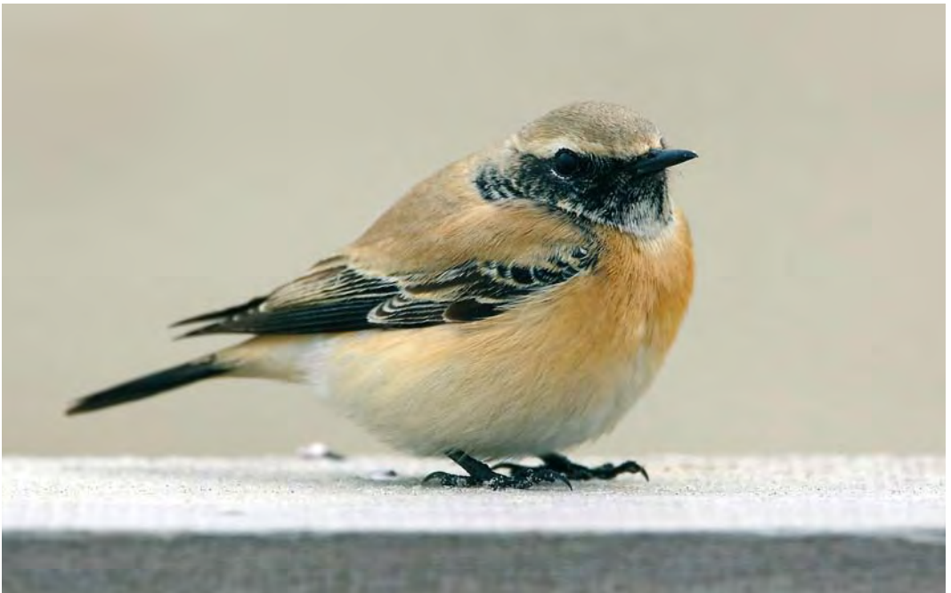
456 Desert Wheatear / Woestijntapuit Oenanthe deserti , male, Schoorl, Noord-Holland, 10 November 2008