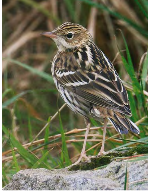
517 Brown Shrike / Bruine Klauwier Lanius cristatus , first-year, Staines Moor, Surrey, England, 7 November 2009 518 Pechora Pipit / Petsjorapieper Anthus gustavi , Whalsay, Shetland, Scotland, 2 October 2009 519 Arctic Warbler / Noordse Boszanger Phylloscopus borealis , Cape Clear, Cork, Ireland, 10 October 2009