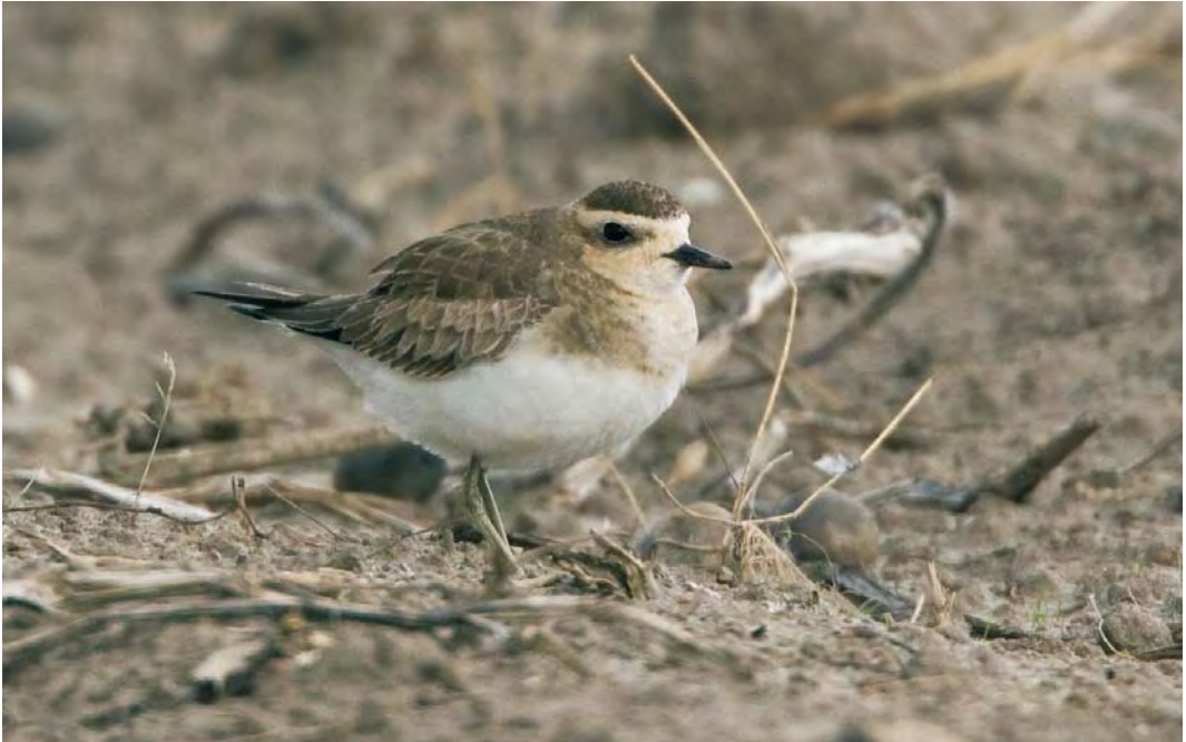
495 Caspian Plover / Kaspische Plevier Charadrius asiaticus , first-year, Buitendijk, Texel, Noord-Holland, Netherlands, 19 October 2009