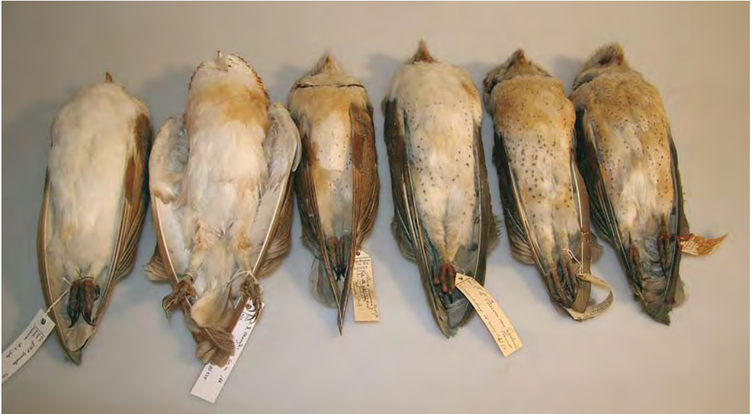
472-473 Witte Kerkuil / Pale Barn Owl Tyto alba alba (links / left; verzameld tussen / collected between Axel en / and Zuiddorp, Zeeland, 14 maart 1983). Vijf vogels rechts / five birds on right: Kerkuilen / Dark Barn Owls T. guttata , verzameld in Nederland / collected in Netherlands. Vijf rechtse vogels zijn lichte guttata 's of vogels van intermediaire/hybride populatie; tweede van links is zelfde als in plaat 470-471. Let op variatie in zowel boven- als onderdelen. Met name derde vogel van links is voor guttata erg geelbruin op bovendelen maar heeft vlekjes op onderdelen en behoorlijk crème bovenborst. Let ook op erg donkergrijze vlekken op bovendelen van drie rechter vogels / Five birds on right are pale guttata or 'intergrades/hybrids'; second left is same as in plate 470-471. Note variation in both upper- and underparts. Especially third bird from left is very yellow-brown on upperparts for guttata but has spots on underparts and rather cream-coloured upperbreast. Note also very dark grey spots on upperside in three on right. Van links naar rechts: twee mannetjes, twee vrouwtjes en twee mannetjes / from left to right: two males, two females and two males. Nationaal Natuurhistorisch Museum Naturalis, Leiden, 14 september 2007