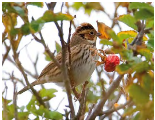
558 Siberische Tjiftjaf / Siberian Chiffchaff Phylloscopus collybita tristis , Noordwijkerhout, Zuid-Holland, 27 oktober 2009 (René van Rossum) 559 Blauwstaart / Red-flanked Bluetail Tarsiger cyanurus , eerstejaars, Oranjezon, Zeeland, 9 oktober 2009 (Adri Joosse) 560 Citroenkwikstaart / Citrine Wagtail Motacilla citreola , eerstejaars, Oegstgeest, Zuid-Holland, 4 september 2009 (Enno B Ebels) 561 Izabeltapuit / Isabelline Wheatear Oenanthe isabellina , Oost-Vlieland, Vlieland, Friesland, 19 september 2009 (Bas van den Boogaard) 562 Raddes Boszanger / Radde's Warbler Phylloscopus schwarzi , Katwijk aan Zee, Zuid-Holland, 27 september 2009 (René van Rossum) 563 Dwerggors / Little Bunting Emberiza pusilla , Vlieland, Friesland, 2 oktober 2009 (Han Zevenhuizen)