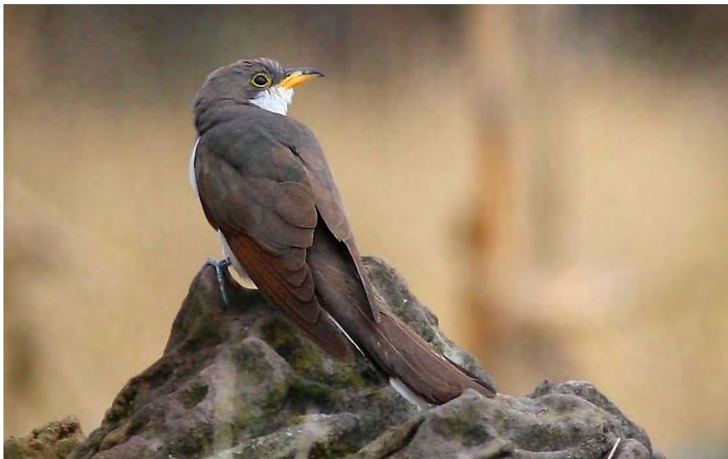
525 Yellow-billed Cuckoo / Geelsnavelkoekoek Coccyzus americanus , Corvo, Azores, 19 October 2009 (Kris De Rouck)