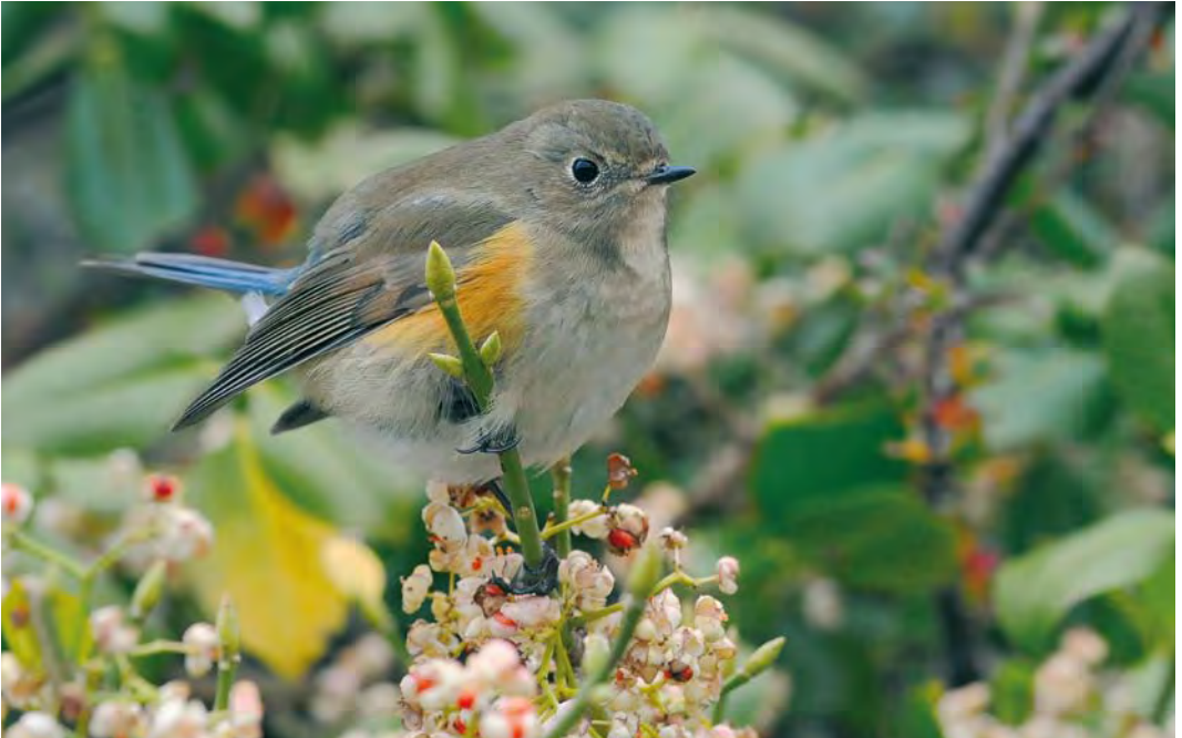
513 Red-flanked Bluetail / Blauwstaart Tarsiger cyanurus , first-year, Helgoland, Schleswig-Holstein, Germany, 31 October 2009