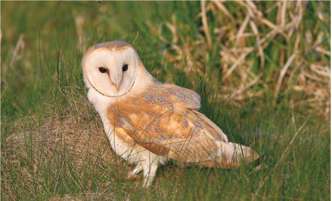
484-485 Waarschijnlijke Witte Kerkuil / probable Pale Barn Owl Tyto alba alba , Alphen aan den Rijn, Zuid-Holland, 20 april 2008. Let op geelbruine bovendelen met weinig licht grijze tekening en zeer lichte onderzijde (met wel wat donkere stipjes en tekening op onderkant van buitenste handpennen). Let ook op afgeknipte of afgebroken buitenste handpennen aan linkervleugel, wat samen met tamme gedrag wijst op een mogelijke herkomst uit gevangenschap / Note yellow-brown upperparts with little pale grey markings and very pale underparts (but with a few dark dots and markings on underside of outer primaries). Also note clipped or broken outer primaries on left wing which, combined with tameness, indicates possible captive origin.