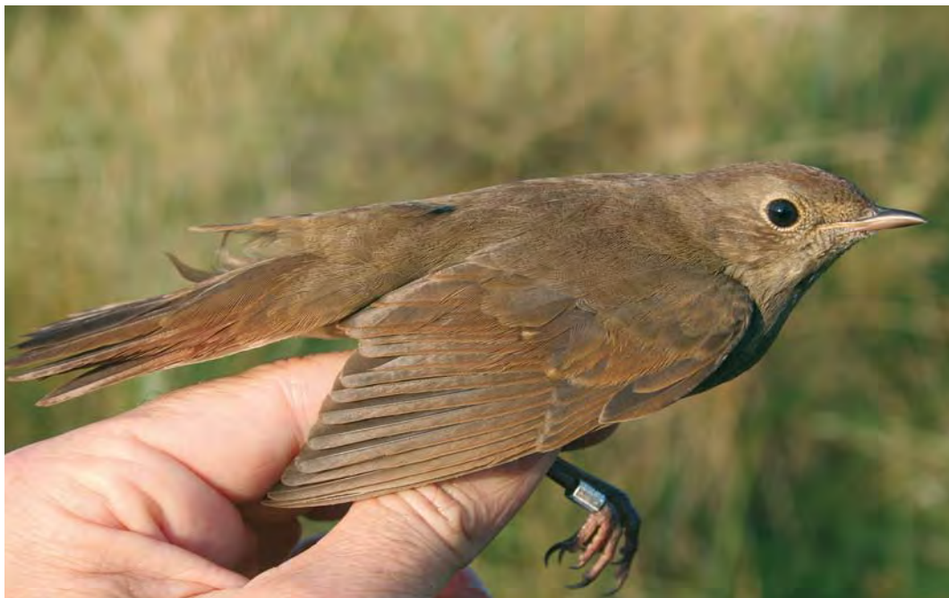
453 Thrush Nightingale / Noordse Nachtegaal Luscinia luscinia , Noordhollands Duinreservaat, Castricum, Noord-Holland, 31 August 2009 (Guido O Keijl)