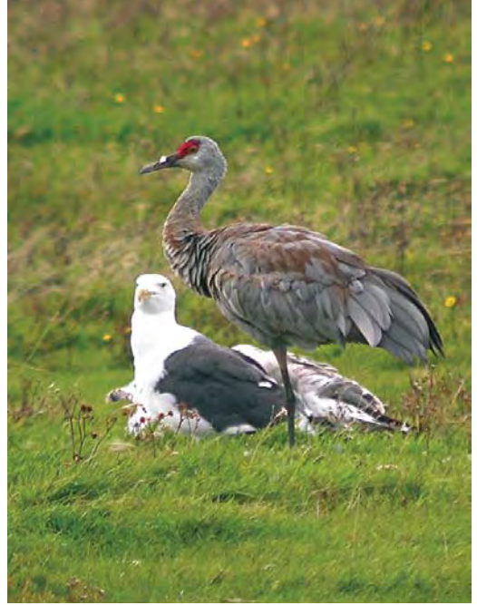
497 American Great Egret / Amerikaanse Grote Zilverreiger Casmerodius albus egretta , Pico, Azores, 28 October 2009 (Gerbrand Michielsen) 498 Sandhill Crane / Canadese Kraanvogel Grus canadensis , South Ronaldsay, Orkney, Scotland, 23 September 2009 (Steve Nuttall) 499 Western Reef Egret / Westelijke Rifreiger Egretta gularis , with Little Egret / Kleine Zilverreiger Egretta garzetta , Oued Ksob, Essaouira, Morocco, 12 November 2009 (Ferry Ossendorp)