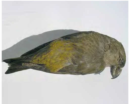
461 Rufous-tailed Rock Thrush / Rode Rotslijster Monticola saxatilis , male, Drouwenezand, Drenthe, 10 May 2008 462 Rustic Bunting / Bosgors Emberiza rustica , first-year female, Groene Glop, Schiermonnikoog, Friesland, 17 November 2008 463 Parrot Crossbill / Grote Kruisbek Loxia pytyopsittacus , Schoorl, Noord-Holland, Netherlands, 4 January 2008 464 Parrot Crossbill / Grote Kruisbek Loxia pytyopsittacus , female (found dead at Eerbeek, Gelderland, on 7 March 2008), Eerbeek, Gelderland, 24 March 2008

This concerns a date extension of a record already mentioned in van der Vliet et al (2002). It appears that the bird was trapped not only on 13 September but also two days earlier (André van Loon/Vrs Schiermonnikoog in litt).