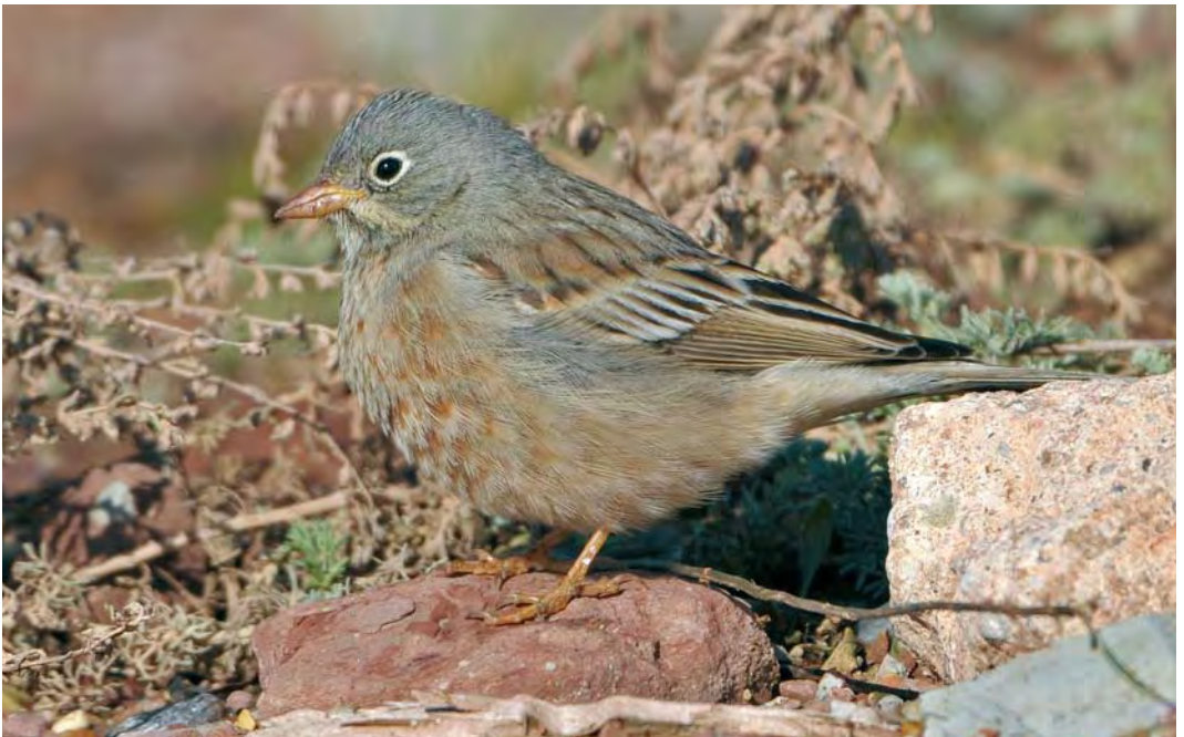
516 Grey-necked Bunting / Steenortolaan Emberiza buchanani , Helgoland, Schleswig-Holstein, Germany, 13 October 2009 (Gabriël Schuler)