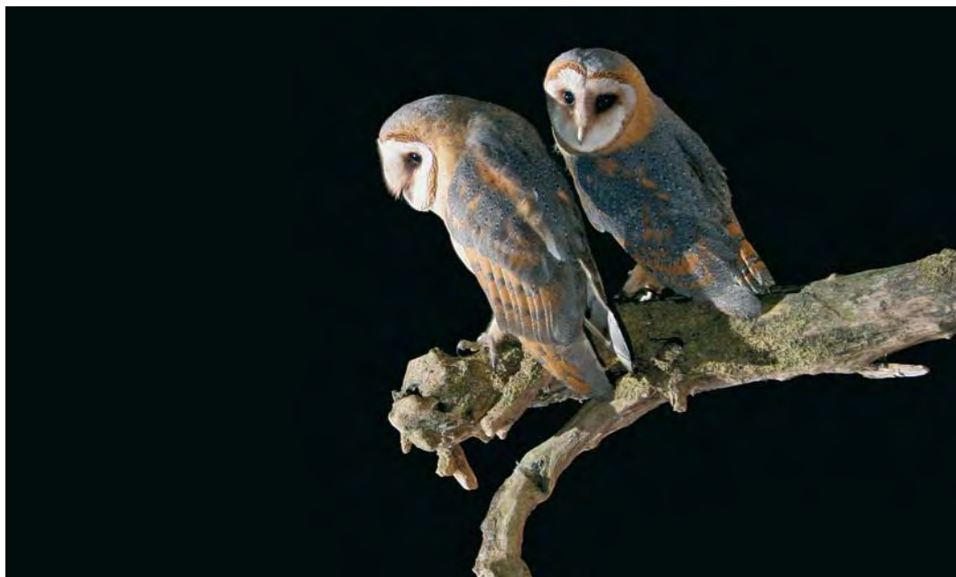
487 Kerkuilen / Dark Barn Owls Tyto alba guttata , juveniel, Barneveld, Gelderland, 27 augustus 2005. Let op vele donkergrijs op bovendelen / Note much dark grey on upperparts.