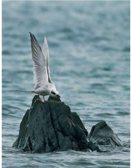
501 Forster's Tern / Forsters Stern Sterna forsteri , Cruisetown Strand, Louth, Ireland, 19 October 2009