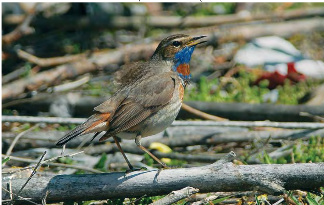
454 Red-spotted Bluethroat / Roodsterblauwborst Luscinia svecica svecica , male, Maasvlakte, Zuid-Holland, 18 May 2008 (Ellen Sandberg)