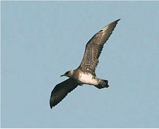
494 Pomarine Skua / Middelste Jager Stercorarius pomarinus , first-summer, Skagen, Nordjylland, Denmark, 5 September 2008. In this individual, post-juvenile moult not completed by September, indicated by old central secondaries and active moult in outer hand. Such slow moult progression is normal for Pomarine in second calendar-year.

their pelagic winter range during summer of which an unknown part wanders north to European waters. First-summer birds probably just occasionally reach the breeding grounds (eg, Meltofte 2007). Older immatures (second- and third-summer birds) more often reach the breeding grounds (increasingly per age-class) (de Korte 1986, Furness 1987, Olsen & Larsson 1997). So, the number of first-summer birds in western Europe is small.