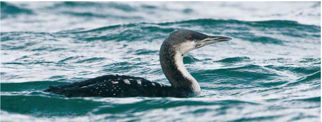
502 White-headed Duck / Witkopeend Oxyura leucocephala , Sidi Bou Rhaba, Kénitra, Morocco, 5 October 2009 503 American Scoter / Amerikaanse Zee-eend Melanitta americana , adult male, Miedzywodzie, Poland, 19 October 2009 504 Pacific Loon / Pacifische Parelduiker Gavia pacifica , Hayle Estuary, Cornwall, England, 22 November 2009

route of Common Cranes G grus and, therefore, it seems likely that the Sandhill will join them into Spain.