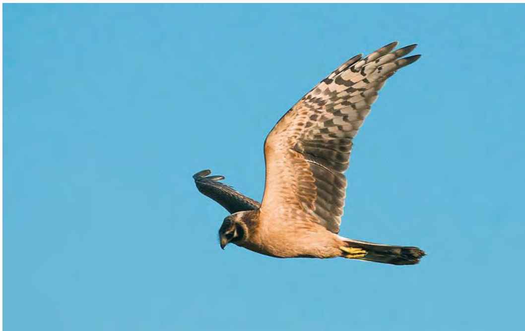
544 Steppekiekendief / Pallid Harrier Circus macrourus , eerstejaars mannetje, Dordtse Biesbosch, Zuid-Holland, 8 oktober 2009 (Hans Gebuis)