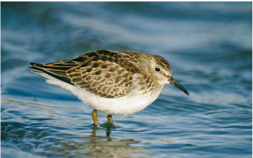
496 Least Sandpiper / Kleinste Strandloper Calidris minutilla , juvenile, Bakkatjörn, Seltjarnarnes, Iceland, 11 October 2009 ( Alex Máni )