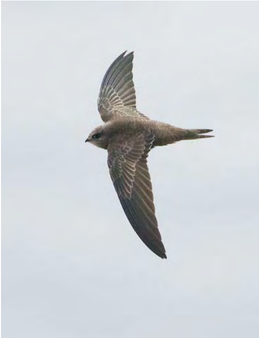
500 Pallid Swift / Vale Gierzwaluw Apus pallidus , Helgoland, Schleswig-Holstein, Germany, 29 October 2009 (Heiko Schmaljohann)