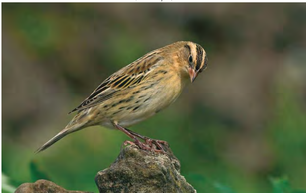
526 Bobolink / Bobolink Dolichonyx oryzivorus , Corvo, Azores, 11 October 2009 (Ferran López)