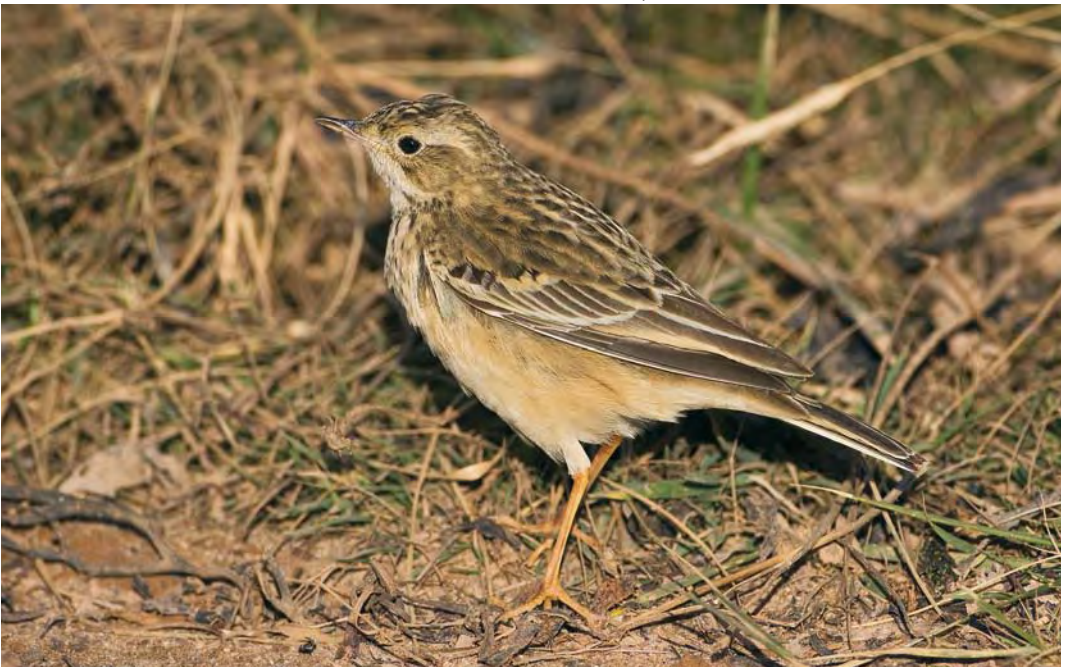
514 Blyth's Pipit / Mongoolse Pieper Anthus godlewskii , Helgoland, Schleswig-Holstein, Germany, 20 October 2009