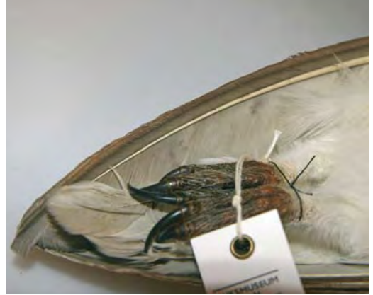
474 Witte Kerkuil / Pale Barn Owl Tyto alba alba (verzameld tussen / collected between Axel en / and Zuid-dorp, Zeeland, 14 maart 1983). Let op lichte ondervleugel zonder tekening en lichte onderzijde van staart / Note pale underwing without markings and pale underside of tail. Nationaal Natuurhistorisch Museum Naturalis, Leiden, 14 september 2007

De voorzichtige conclusie hiervan is dat in Nederland alleen de meest lichte alba 's met zekerheid op naam zijn te brengen en lichte guttata 's uitsluiten. Een aanvaardbare alba moet voldoen