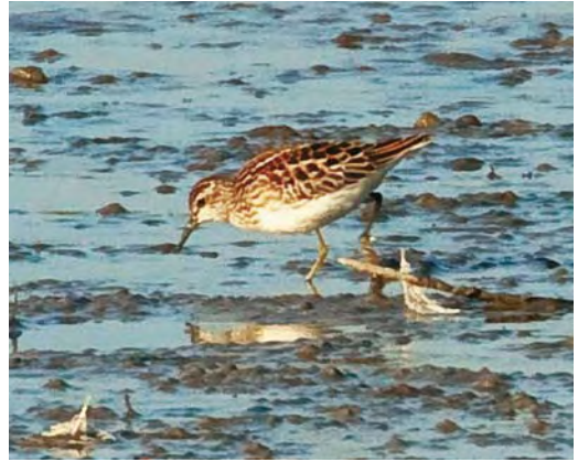
569 Taigastrandloper / Long-toed Stint Calidris subminuta , juveniel, Vreugderijkerwaard, Overijssel, 24 oktober 2009 (Dirk Ottenburghs)

waarschijnlijk naar een Taigastrandloper keken! Per telefoon en met veel enthousiasme kreeg HP te horen dat de vogel nu dichtbij zat en dat het waarschijnlijk een Taigastrandloper betrof! We besloten om de vogel voorzichtig te melden want we vonden het risico op een foutieve determinatie nog te hoog. Door kennis te nemen van de piep konden geïnteresseerde vogelaars zelf afwegen te gaan rijden of niet. Wietze Janse belde binnen zeven minuten na het inspreken terug en piepte de waarneming om 16:00 door met code 'mogelijk deze soort, determinatie lastig, wordt aan gewerkt'.