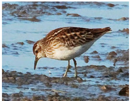
547 Baltische Mantelmeeuw / Baltic Gull Larus fuscus , Westkapelle, Zeeland, 6 oktober 2009 548 Vorkstaartmeeuw / Sabine's Gull Xema sabini , Rottumerplaat, Groningen, 2 oktober 2009 549 Amerikaanse Goudplevier / American Golden Plover Pluvialis dominica , adult, Buitendijk, Texel, Noord-Holland, 18 oktober 2009 550 Amerikaanse Goudplevier / American Golden Plover Pluvialis dominica , adult, Buitendijk, Texel, Noord-Holland, 11 oktober 2009 551 Bonapartes Strandloper / White-rumped Sandpiper Calidris fuscicollis , eerstejaars (links), met Bonte Strandloper / Dunlin C alpina , Dijkgatweg, Wieringermeer, Noord-Holland, 16 oktober 2009 552 Taigastrandloper / Long-toed Stint Calidris subminuta , juveniel, Vreugderijkerwaard, Overijssel, 24 oktober 2009