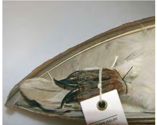
474 Witte Kerkuil / Pale Barn Owl Tyto alba alba (verzameld tussen / collected between Axel en / and Zuid-dorp, Zeeland, 14 maart 1983). Let op lichte ondervleugel zonder tekening en lichte onderzijde van staart / Note pale underwing without markings and pale underside of tail. Nationaal Natuurhistorisch Museum Naturalis, Leiden, 14 september 2007

De voorzichtige conclusie hiervan is dat in Nederland alleen de meest lichte alba 's met zekerheid op naam zijn te brengen en lichte guttata 's uitsluiten. Een aanvaardbare alba moet voldoen