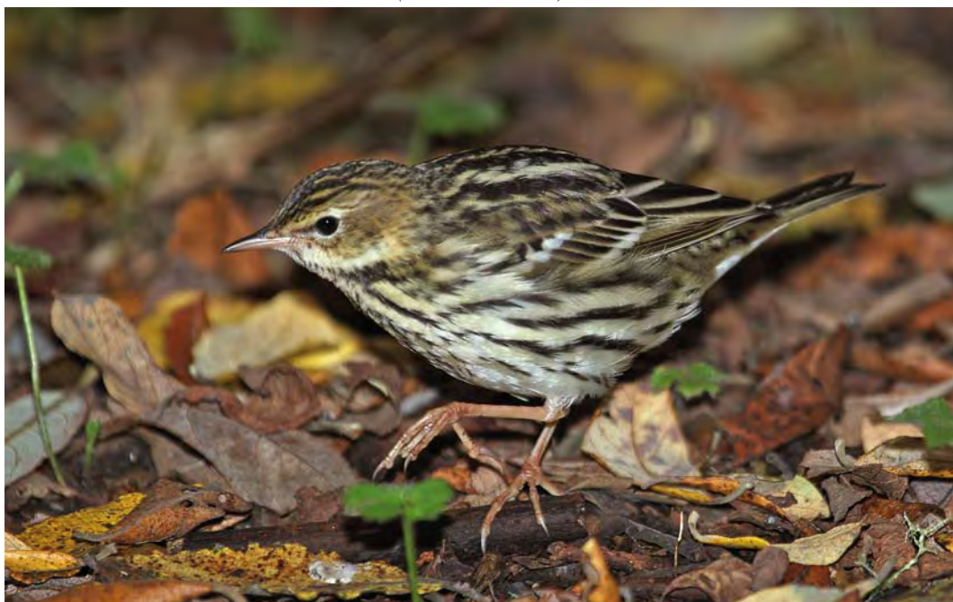
510 Pechora Pipit / Petsjorapieper Anthus gustavi , Ouessant, Finistère, France, 9 October 2009