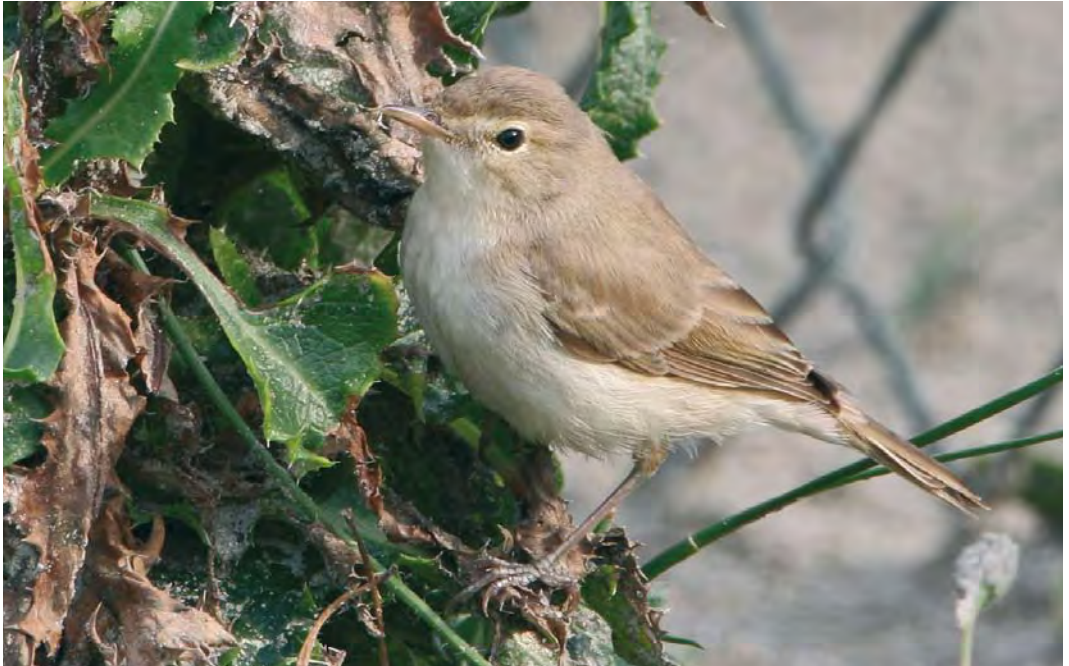
465 Booted Warbler / Kleine Spotvogel Acrocephalus caligatus , Maasvlakte, Zuid-Holland, Netherlands, 13 September 2008 (Martin van der Schalk)