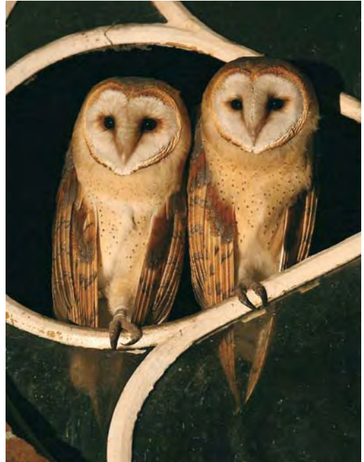
468 Witte Kerkuil / Pale Barn Owl Tyto alba alba , adult, Zuid-Holland, 2 juni 2007 (Chris van Rijswijk/birdshooting.nl). Let op geheel witte onderdelen en ondervleugel / Note completely white underparts and underwing. 469 Hybriden Witte Kerkuil x Kerkuil / hybrids Pale x Dark Barn Owl Tyto alba alba x alba guttata , juveniel, Zuid-Holland, 6 augustus 2007 (Chris van Rijswijk/birdshooting.nl). Bewezen hybriden uit gemengd broedgeval. Deze vogels zijn niet te onderscheiden van guttata / Proven hybrids from mixed breeding pair. These birds are inseparable from guttata .

1976. De vogel was een kippenboerderij binnen-gevlagen en kon worden gevangen en geringd. Hij werd als volgt beschreven: 'geheel zijdeachtige witte onderzijde, wangen en ondervleugels zonder ook maar een spoor van donkere stippen; de bovenzijde oranje-geel'. Bij het artikel is een foto geplaatst van de vogel in de hand. Hij werd op 22 april 1976 dood aangetroffen als verkeersslachtoffer bij Varades, Loire-Atlantique, Frankrijk, waar alba broedvogel is. Het is de enige door van den Berg & Bosman (2001) vermelde alba en aangezien dit taxon tot voor kort niet door de Commissie Dwaalgasten Nederlandse Avifauna (CDNA) werd beoordeeld tevens het enige bekende geval. Op basis van onderstaande criteria is deze vogel nu alsnog beoordeeld en aanvaard door de CDNA (cf Ovaa et al 2009).