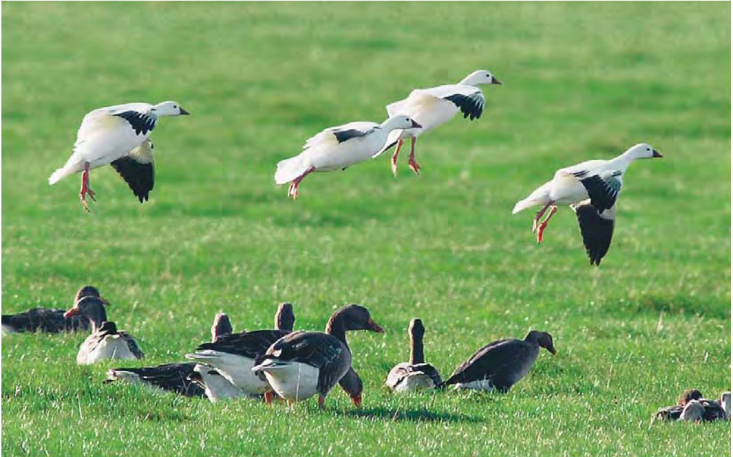
542 Ross' Ganzen / Ross's Geese Anser rossii , met Grauwe Ganzen / Greylag Geese A anser , Ottersaat, Texel, Noord-Holland, 12 oktober 2009