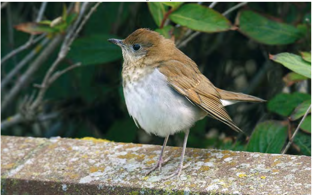
528 Veery / Veery Catharus fuscescens , first-year, Whalsay, Shetland, Scotland, 4 October 2009 (Hugh Harrop)