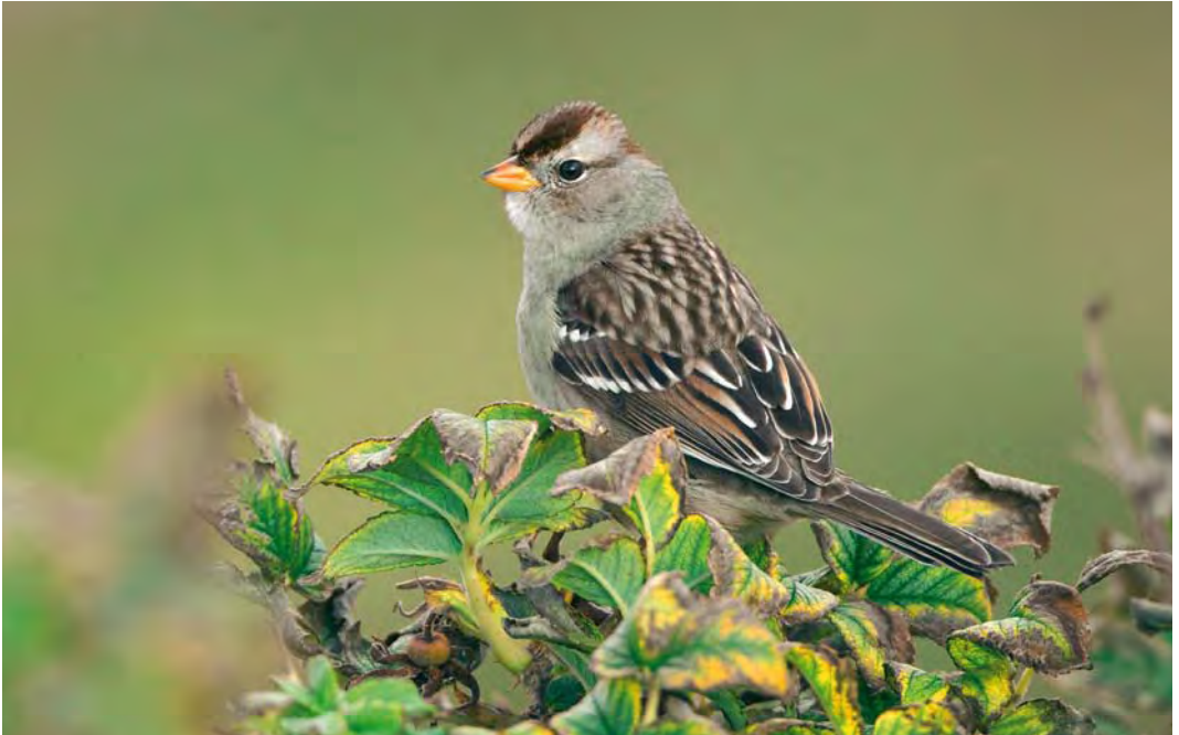
527 White-crowned Sparrow / Witkruingors Zonotrichia leucophrys , first-year, Ona, Sandøy, Møre og Romsdal, Norway, 9 October 2009 (Christian Tiller)