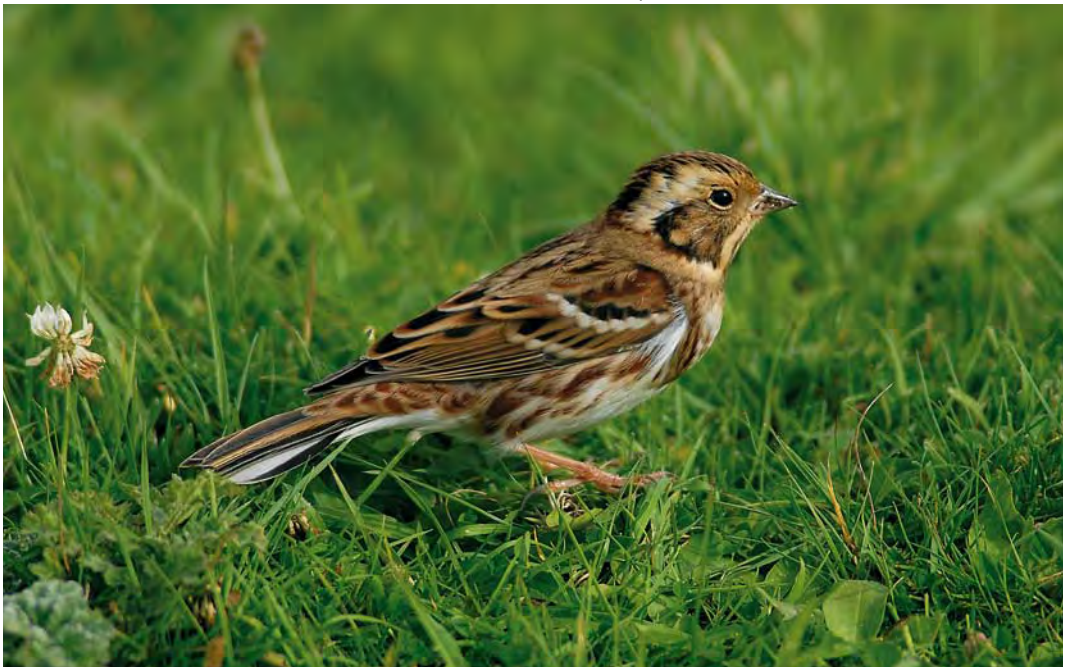
466 Rustic Bunting / Bosgors Emberiza rustica , first-year, De Cocksdoorp, Texel, Noord-Holland, Netherlands, 4 October 2008