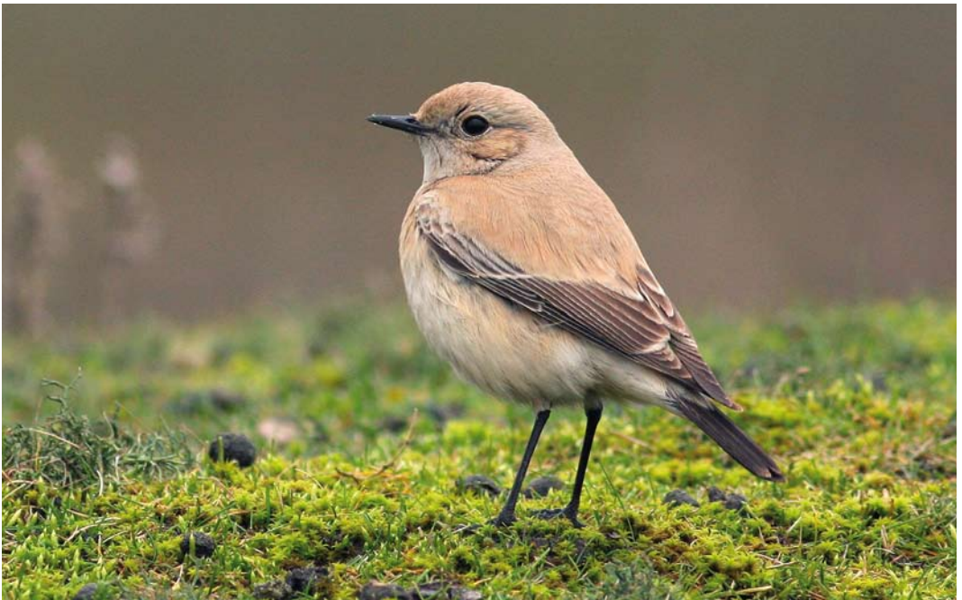
58 Woestijntapuit / Desert Wheatear Oenanthe deserti , vrouwtje, Verdronken Land van Saeftinghe, Zeeland, 20 december 2008