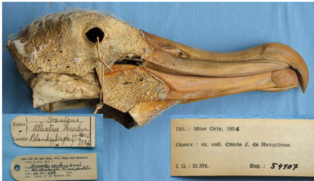
FIGURE 7 Wandering Albatross / Grote Albatros Diomedea exulans , found at Blankenberghe, West-Vlaanderen, Belgium, on 27 April 1887 (George Lenglet/Royal Belgian Institute of Natural Sciences, Brussel)

Blankenberghe on 27 April 1887. The story goes that the bird was eaten by the port warden's family but that the head was kept, although it only just escaped being eaten by a cat or by rats (Jacobs & Dirx 1945). The head ended up in the collection of a small zoo in Gent, Oost-Vlaanderen. When this zoo went out of business, the head was acquired by the count De Hemptinne for his private collection. Shortly after the count's death in September 1942, Dupond (1943) visited the count's widow to verify the find. He found the head in a poor state ('badly eaten by mites'). De Hemptinne's collection was transferred to baron P de Moffarts, who donated it in May 1958 to the Royal Belgian Institute of Natural Sciences in Brussels where it is still kept (KBIN 54107) (figure 7). The bird can be identified as exulans , with a culmen of 164.8 mm and a bill width of 44.4 mm (figure 5). The bill is nicked at the cutting edge of the inner hook.