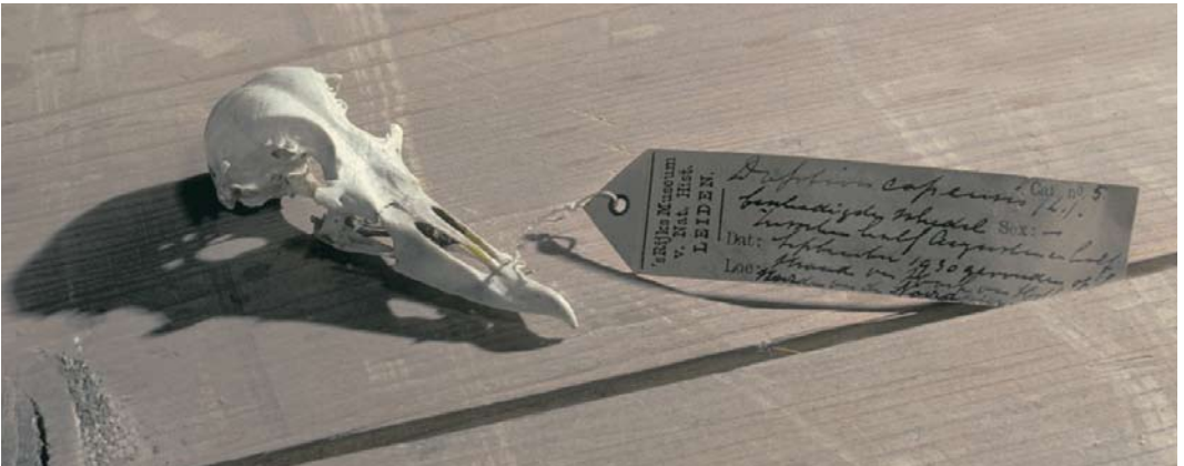
11 Cape Petrel / Kaapse Stormvogel Daption capense (reportedly shot at Crumlin, near Dublin, Dublin, Ireland, on 30 October 1881), Natural History Museum of Ireland, Dublin, Ireland, 7 March 2008 (Nigel Monaghan/Natural History Museum of Ireland) 12 Cape Petrel / Kaapse Stormvogel Daption capense , immature (collected at sea, off Sciacca, Agrigento, Sicily, Italy, in September 1964), private collection of Gino Fantin, Treviso, Veneto, Italy, November 1973 (Bruno Massa) 13 Cape Petrel / Kaapse Stormvogel Daption capense , skull (found at Hoek van Holland, Zuid-Holland, Netherlands, between mid August and mid September 1930), Nationaal Natuurhistorisch Museum/Naturalis, Leiden, Zuid-Holland, Netherlands, April 1983 (Arnoud B van den Berg)

1998) mainly because of the probability of ship assistance (Paul Milne in litt).