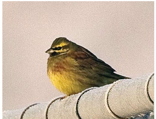
29 Iceland Gull / Kleine Burgemeester Larus glaucooides , first-year, Villa Real de Santo Antonio, Portugal, 4 January 2009 30 Franklin's Gull / Franklins Meeuw Larus pipixcan , Étang d'Entressens, Bouches-du-Rhône, France, 30 December 2008 31 Glaucous-winged Gull / Beringmeeuw Larus glaucescens , adult, Cowpen Bewley, Cleveland, England, 10 January 2009 32 Slaty-backed Gull / Kamtsjatkameeuw Larus schistisagus , adult, Klaipeda, Liettuva, Lithuania, 17 November 2008 33 Naumann's Thrush / Naumanns Lijster Turdus naumanni , Neiden, Sor-Varanger, Norway, 11 December 2008 34 Cirl Bunting / Cirlgors Emberiza cirlus , male, Doelpolder, Oost-Vlaanderen, Belgium, 10 January 2009