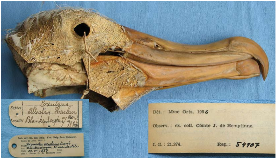
FIGURE 7 Wandering Albatross / Grote Albatros Diomedea exulans, found at Blankenberghe, West-Vlaanderen, Belgium, on 27 April 1887