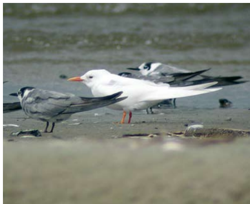
14-15 Leucistic Common Tern / Visdief Sterna hirundo , with normally coloured Common Tern / Visdief and Black Terns / Zwarte Sterns Chlidonias niger , Swinoujscie, Poland, 4 August 2008 (Lukasz Lawicki)

was detected. In general, plumage mutations among Sternidae are rare (van Grouw 2006, Hein van Grouw in litt). Up to now, only one example of a leucistic Common Tern has been published in the literature. This concerns a bird photographed by Martin Budding at Maasvlakte, Zuid-Holland, the Netherlands, on 11 September 1988 (cf Dutch