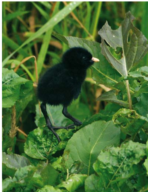
152 Kleinst Waterhoen / Baillon's Crake Porzana pusilla , kuiken, Groene Jonker, Zevenhoven, Zuid-Holland, 19 juli 2009 (Jan den Hertog)

paring en het feit dat de ene vogel veelvuldig riep en de andere niet.