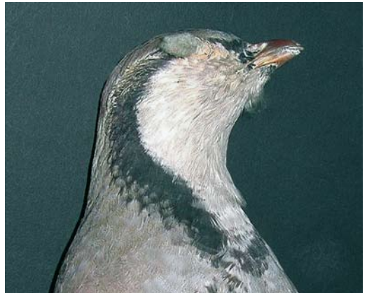
108 Sicilian Rock Partridge / Siciliaanse Steenpatrijs Alectoris (graeca) whitakeri , Monti Nebrodi, Sicily, Italy ( Andrea Corso ). Close-up view showing variegated colour of throat as in some birds, being mixed drab greyish-isabelline. 109 Sicilian Rock Partridge / Siciliaanse Steenpatrijs Alectoris (graeca) whitakeri , collected at Monti Nebrodi, Sicily, Italy ( Andrea Corso ). Bird with whiter and cleaner throat and unbroken collar. 110 Alpine Rock Partridge / Alpensteenpatrijs Alectoris graeca saxatilis (collected at Brescia, Brescia, Italy), Arrigoni degli Oddi collection, Museo di Scienze Naturali, Roma, Italy ( Andrea Corso ). Note width of collar at sides, intense greyish-tinged throat, and near absence of ear-coverts stripe. 111 Sicilian Rock Partridge / Siciliaanse Steenpatrijs Alectoris (graeca) whitakeri (collected at Monte Etna, Sicily, Italy), Arrigoni degli Oddi collection, Museo di Scienze Naturali, Roma, Italy ( Andrea Corso ). Note width of collar at sides, broken collar in front, spotted, white creamy-tinged throat, visible ear-coverts stripe.

the present study in Italian taxa. The white or pale supercilium is also variable, more extensive in saxatilis and orlandoi . Interestingly, in this character, whitakeri is most different from chukar which has a broader and paler supercilium, not reaching the forehead or diffusely so.