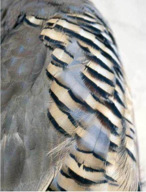
118 Sicilian Rock Partridge / Siciliaanse Steenpatrijs Alectoris (graeca) whitakeri , collected at Monti Nebrodi, Sicily, Italy, in winter (Andrea Corso).