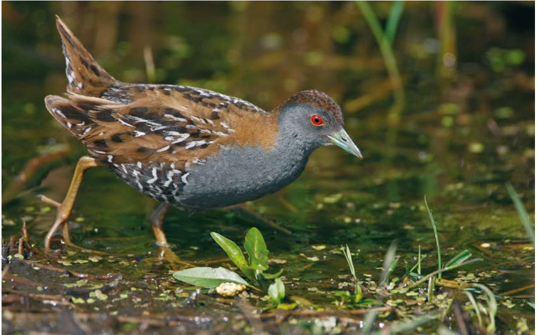
143 Kleinst Waterhoen / Baillon's Crake Porzana pusilla , mannetje, Groene Jonker, Zevenhoven, Zuid-Holland, 13 juni 2009