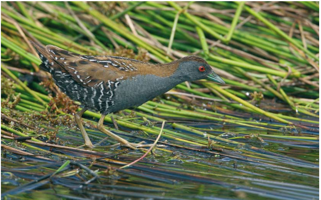
144 Kleinst Waterhoen / Baillon's Crake Porzana pusilla , mannetje, Groene Jonker, Zevenhoven, Zuid-Holland, 20 juni 2009 ( Jaap Denee )