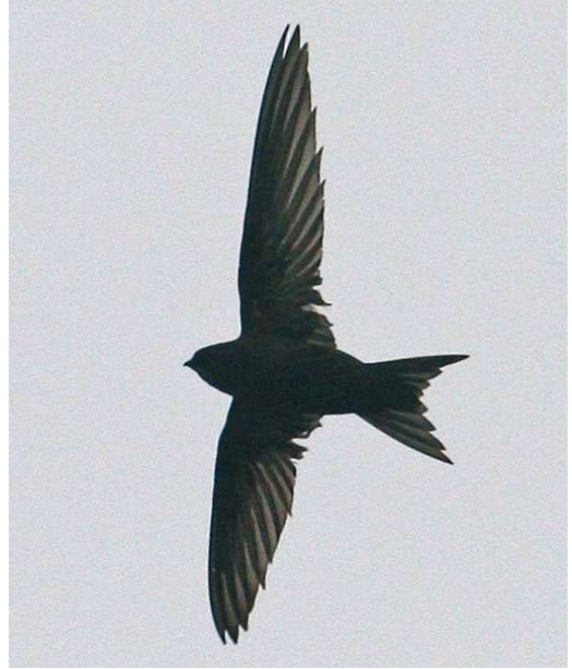
128 Pallid Swift / Vale Gierzwaluw Apus pallidus , Marrakech, Morocco, 3 April 2007 (Stef McElwee). Pale head with contrasting, blackish eye-mask and dark scaling of belly/flanks more prominent than on undertail-coverts instantly separate this bird from Common Swift A. apus . Note also rather pale median coverts. 129 Common Swift / Gierzwaluw Apus apus apus , Selby, North Yorkshire, England, 5 August 2008 (Ross Ahmed)

bird there is at least a degree of consistency in its appearance (and apparent hues), as it is in relatively constant light conditions (balance of light and shade) for comparatively long periods of time, this is not the case with swifts. As they are such aerial and fast-flying birds, they interact with the light in a more dynamic, ever-changing way. Photographs capture a bird in an instant in time. They show how the bird appears in that instant, as it 'interacts' with the light conditions prevailing at that precise moment. In that instant, it is very possible that various feather tracts will catch the light, causing all taxa to appear very similar. Over a more extended period of observation, the light will interplay with the plumage in a more varied way. This point illustrates that a bird must be watched carefully over a reasonable period, so that the true 'colour balance' can be better evaluated and that temporary 'artefacts' can be eliminated. Similarly, single photographs can easily give a false impression, and to be totally convincing, a series of images is required which all show a consistent appearance. At least however in swifts, the shadows created by for example leaves and buildings, which affect many species of birds, are less of an issue. In the nominate apus in plate 124 & 126, much of the scaled effect and brown