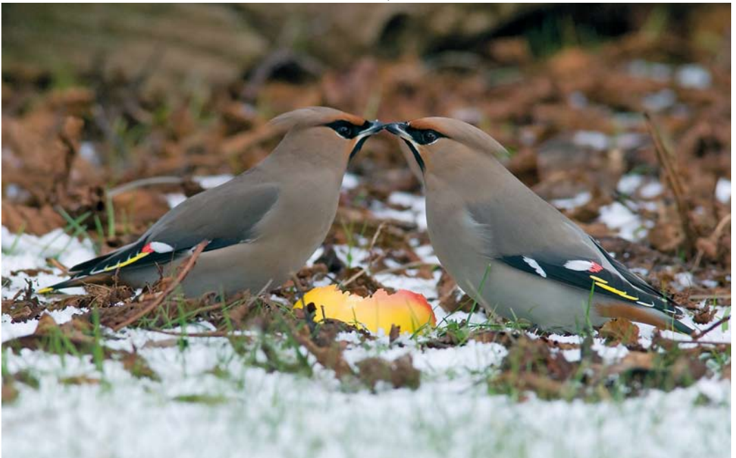
193 Pestvogels / Bohemian Waxwings Bombycilla garrulus , De Cocksdorp, Texel, Noord-Holland, 11 februari 2010