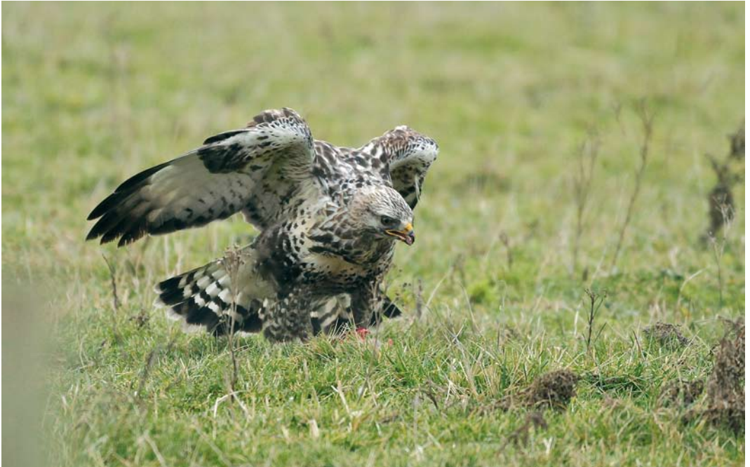
192 Ruigpootbuiserd / Rough-legged Buzzard Buteo lagopus , Cadzand, Zeeland, 21 januari 2010