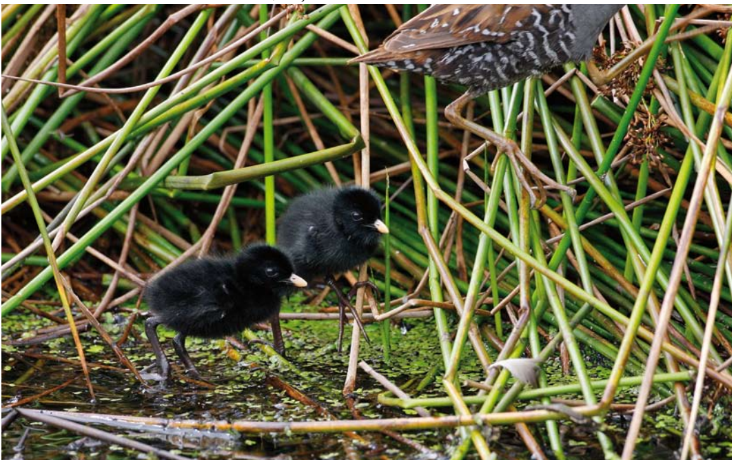
150 Kleinst Waterhoen / Baillon's Crake Porzana pusilla , kuikens en adult, Groene Jonker, Zevenhoven, Zuid-Holland, 18 juli 2009 ( Martin van der Schalk )