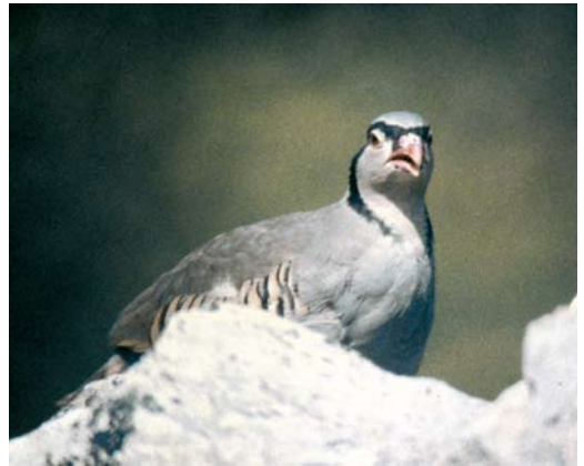
98-99 Sicilian Rock Partridge / Siciliaanse Steenpatrijs Alectoris (graeca) whitakeri , Monti Sicani, Sicily, Italy, spring 2004 ( Andrea Ciaccio ). Note very warm and uniform brownish olive or even rusty upperparts, more intense than in other taxa, with just slightly paler, barely contrasting uppertail-coverts. This bird shows creamy or isabelline-tinged throat patch. Black collar (neck-lace) is barely broken in front, appearing just disjoint and spotted. Note obvious ear-coverts stripe, almost like Chukar Partridge A chukar . 100-101 Sicilian Rock Partridge / Siciliaanse Steenpatrijs Alectoris (graeca) whitakeri , Monti Iblei, Sicily, Italy, autumn 1999 ( Saverio Cacopardi ). Two old photographs, appearing much more bluish than bird actually was. Note very typical open broken black collar and conspicuous ear-coverts stripe.

eastern Serbia and northern Albania and the Republic of Macedonia seem to exhibit some clinal intergradation with nominate graeca (Cramp 1980, Priolo 1984, Snow & Perrins 1998). According to Vaurie (1965), this taxon is limited to the Alps and he regarded the other populations as belonging to nominate graeca . Orlando (1967) further complicated the situation, stating that the range of saxatilis was limited to the western Alps, as the other populations in the Alps are very similar to the population in the Apennines. Priolo (1984) claimed that the Alpine populations all belong to saxatilis , and that this taxon enters former Yugoslavia, intergrading here (Republic of Mace-