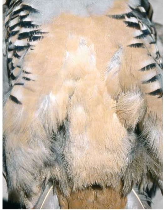
119 Sicilian Rock Partridge / Siciliaanse Steenpatrijs Alectoris (graeca) whitakeri , collected at Monti Nebrodi, Sicily, Italy (Angelo Scuderi). Note richly coloured underparts with intense creamy coloration, especially very saturated and deeply coloured undertail-coverts.

other tail-feathers. Nominata graeca shows more often mottling on t1, rarely with barely visible vermiculations also on the uppertail-coverts (three birds out of 40). However, contrary to previous literature that mainly refers to the central pair (t1) and the uppertail-coverts, the truly typical whitakeri character are the dark vermiculations on the base of the complete tail (figure 4), which, during the present study, was not found as conspicuously in any individual of the other taxa.