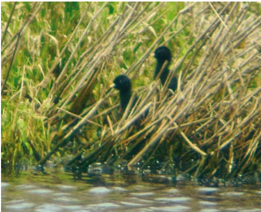
153 Kleinst Waterhoen / Baillon's Crake Porzana pusilla , kuikens, Oegstgeest, Zuid-Holland, 26 juli 2009 (Luuk Punt)

Het broedgeval vond plaats in een helofytenfilter dat onder beheer valt van het Hoogheemraadschap Rijnland. Dit in 2007 door Zuid-Hollands Landschap verworven en ingericht gebiedje grenst aan de noordzijde aan een natuurontwikkelingsgebied in de Klaas Hennepoelpolder en Veerpolder en valt net in de gemeente Warmond. Het bestaat uit rietkragen, enkele stukjes plasdras, een ringsloot en een paar sloten die het gebiedje doorsnijden. Het aangrenzende natuurontwikkelingsgebied bevat naast de natte habitats ook kruidenrijk grasland en bosschages.