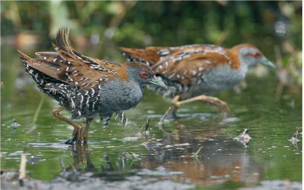
145 Kleinst Waterhoen / Baillon's Crake Porzana pusilla , mannetje en vrouwtje, Groene Jonker, Zevenhoven, Zuid-Holland, 20 juni 2009