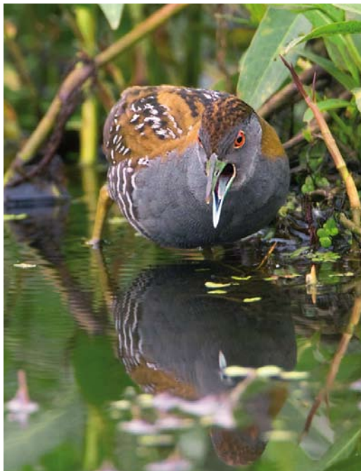
151 Kleinst Waterhoen / Baillon's Crake Porzana pusilla , roepend mannetje, Groene Jonker, Zevenhoven, Zuid-Holland, 10 juni 2009 (Roland Jansen)