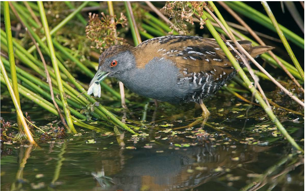
146 Kleinst Waterhoen / Baillon's Crake Porzana pusilla , mannetje, Groene Jonker, Zevenhoven, Zuid-Holland, 25 juni 2009 ( Roland Jansen )