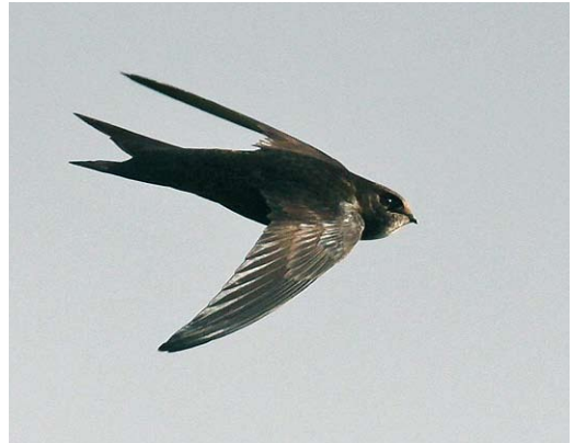
130-131 Asian Common Swift / Aziatische Gierzwaluw Apus apus pekinensis , Koko Nor (now known as Qinghai lake), Qinghai province, China, 27 May 2008 (Paul French). Note dark head without obvious eye-mask, and scaling of undertail-coverts more prominent than on belly/flanks. 132 Asian Common Swift / Aziatische Gierzwaluw Apus apus pekinensis , Koko Nor (now known as Qinghai lake), Qinghai province, China, 27 May 2008 (Paul French). In this photograph, probably not safely told from Pallid Swift A pallidus except perhaps for slimmer, more elongated tail and rump. Brief views of pekinensis may strongly suggest pallidus ! 133 Common Swift / Gierzwaluw Apus apus apus , Selby, North Yorkshire, England, 15 July 2008 (Ross Ahmed). Non-juvenile bird. Note dark head, with limited pale throat patch not reaching past eye.

different feathers tracts in any individual swift should also be described in relative terms; for example, 'the greater primary coverts were usually paler than the outer primaries'. The use of technology such as photographic editing software may be of use in comparing coloration in swifts. Such software is capable of numbering colours in, for example, the form of RGB values and thus removing the problem of ambiguity of colour names. Although there are a number of limitations, this may allow comparisons of RGB values within and between photographs, and could therefore provide a useful tool to aid identification; research is currently being undertaken in this area (Antero Lindholm in litt). It is also clear that the coloration