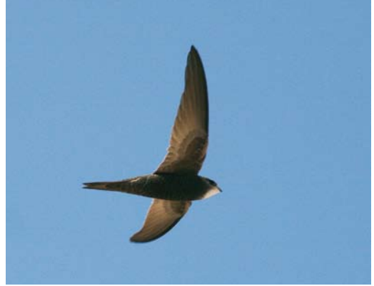
138 Pallid Swift / Vale Gierzwaluw Apus pallidus , Marrakech, Morocco, 29 March 2006 (James Lidster). Note pale head with blackish eye-mask. 139 Asian Common Swift / Aziatische Gierzwaluw Apus apus pekinensis , near Boon Tsagaan Nuur (Buuntsagaan lake), Mongolia, 10 June 2008 (James Lidster). Despite large white throat patch, note that head is still darker than in average Pallid Swift A. pallidus , and that scaling of undertail-coverts is more prominent than on belly/flanks. Median coverts clearly darker than greater coverts.