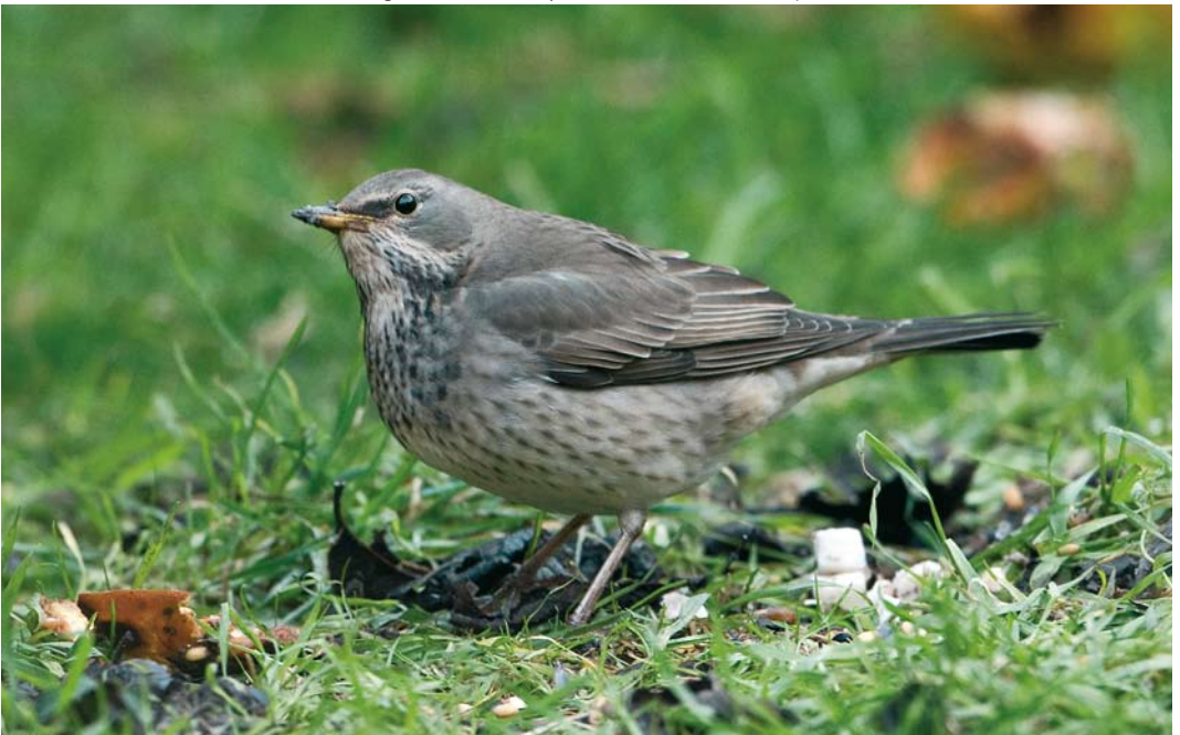
179 Black-throated Thrush / Zwartkeellijster Turdus atrogularis , female, Newholm, Whitby, North Yorkshire, England, 17 January 2010