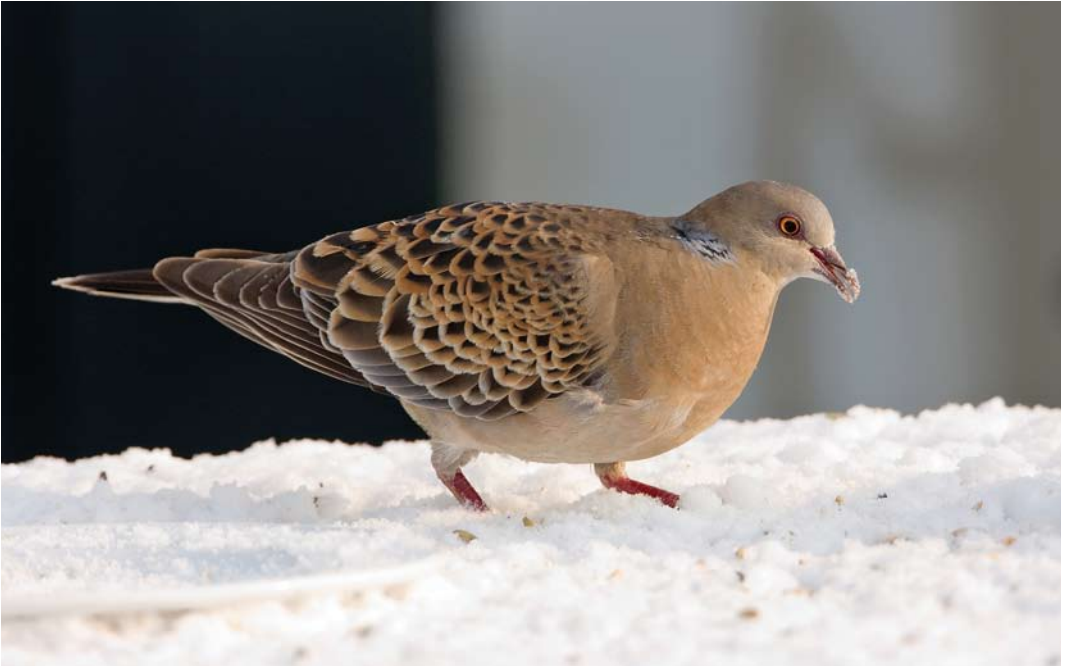
178 Western Oriental Turtle Dove / Westelijke Oosterse Tortel Streptopelia orientalis meena , adult, Wergea, Friesland, Netherlands, 25 January 2010 (Roland Jansen)