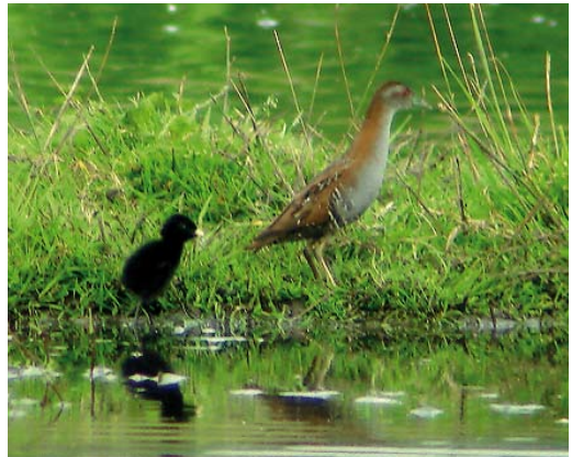
154 Kleinst Waterhoen / Baillon's Crake Porzana pusilla , adult met kuiken, Oegstgeest, Zuid-Holland, 29 juli 2009 (Luuk Punt)

Gevalen van voor 1980 werden niet herzien door de CDNA (in tegenstelling tot de meeste beoordeeltaxa op de Nederlandse lijst). Van den Berg & Bosman (1999, 2001) vermelden daarom