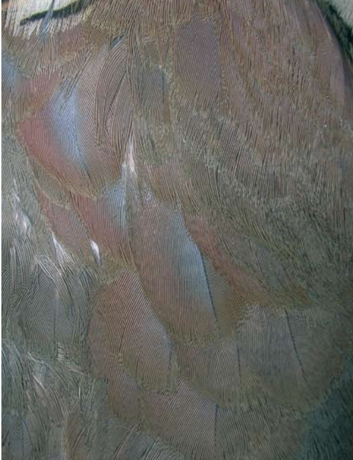
120 Details of scapulars and mantle side of Sicilian Rock Partridge / Siciliaanse Steenpatrijs Alectoris (graeca) whittakeri , collected at Monte Etna, Sicily, Italy (Andrea Corso). Note intense vinaceous tinge and cerulean centre of some feathers.