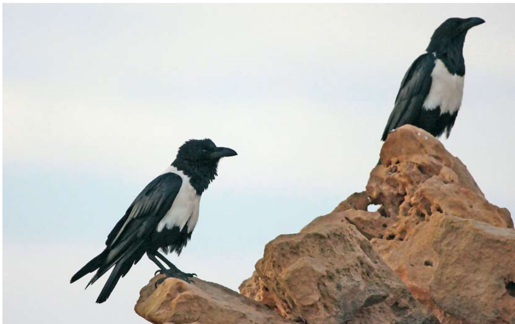
176 Pied Crows / Schildraven Corvus albus , 154 km north-east of Dakhla, Western Sahara, Morocco, 5 March 2010 ( Kris De Rouck )