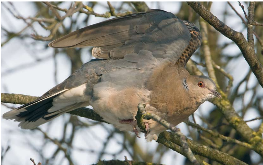
157 Westelijke Oosterse Tortel / Western Oriental Turtle Dove Streptopelia orientalis meena , adult, Wergea, Friesland, 26 januari 2010