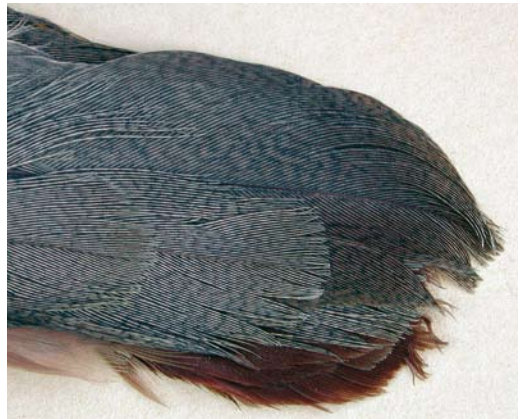
FIGURE 4 Tail pattern of Sicilian Rock Partridge / Siciliaanse Steenpatrijs Alectoris (graeca) whitakeri (below) and other Rock Partridge / Steenpatrijs A graeca taxa ( Lorenzo Starnini ). Note marked vermiculation on both uppertail-coverts and whole tail-feathers. In other taxa, uppertail-coverts more or less vermiculated (rarely almost in shape of dark bars), as can be central tail-feathers (t1), but tail never fully vermiculated/barring as in whitakeri .