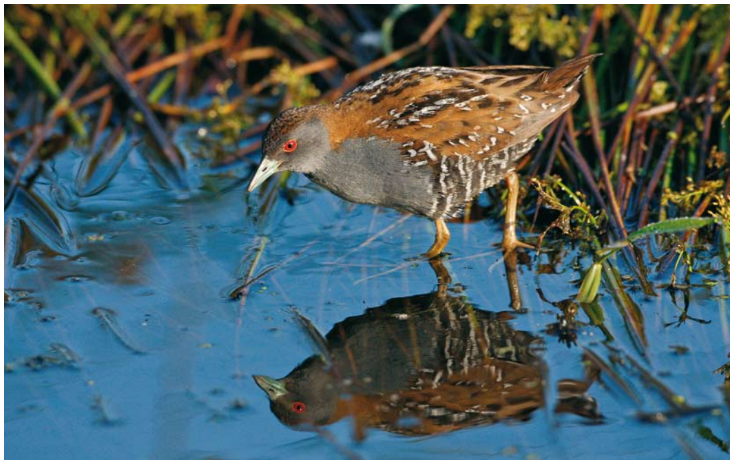
142 Kleinst Waterhoen / Baillon's Crake Porzana pusilla , mannetje, Groene Jonker, Zevenhoven, Zuid-Holland, 13 juni 2009 (Martin van der Schalk)

gehoord. De volgende dag hadden geïnteresseerden meer geluk; al vanaf de ochtendschemering lieten beide vogels zich goed zien. Gedurende de hele dag was het een komen en gaan van vele 10-tallen vogelaars. Na 9 juni werden ze in deze hoek niet meer gehoord of gezien. Diezelfde avond (9 juni) ontdekte Kees de Vries rond 21:00 een derde exemplaar in het gebied. Deze riep veelvuldig vanuit een smalle pitrusrand vlak langs het pad, tegenover de dierenbegraafplaats aan de Hogedijk. Ook deze vogel liet zich die avond en in de hierop volgende dagen zeer fraai en vaak van korte afstand bekijken, fotograferen en op video vastleggen (cf Plomp et al 2010). In de eerste dagen verplaatste hij zich soms over een afstand van 10-tallen meters maar later werd hij vaak op één plek gezien. Hij werd vanaf 12 juni vergezeld door een tweede vogel die 's ochtends vroeg was ontdekt door Phil Koken. Op 13 juni en de dagen erna werd van deze vogels meerdere keren paring en voedseloverdracht waargenomen. Ze waren vaak open en bloot foeragerend op een klein slikrandje te zien. Het paar trok 100en belangstellenden uit binnen- en buitenland. De soortdeterminatie was vanwege de goede waarnemingsomstandigheden eenvoudig; het zeer kleine formaat