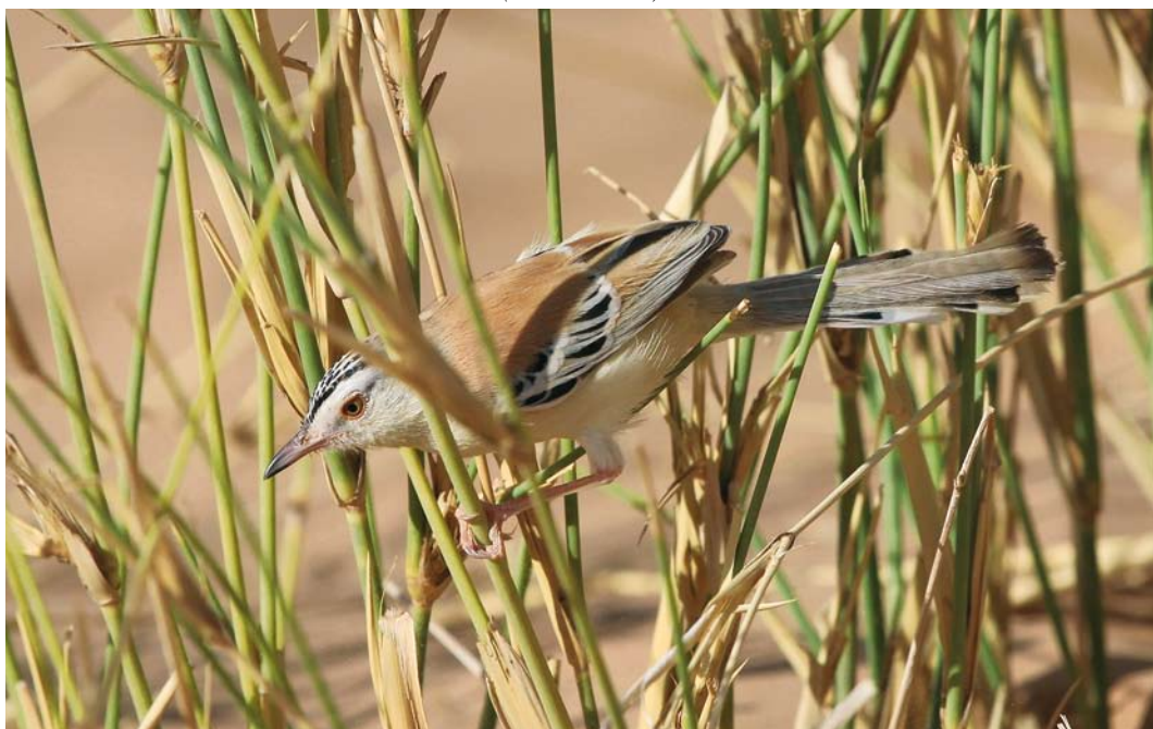
177 Cricket Warbler / Krekelprinia Spiloptila clamans , Aoussard, Western Sahara, Morocco, 6 March 2010