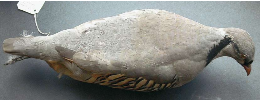
107 Italian Rock Partridge / Italiaanse Steenpatrijs Alectoris graeca orlandoi (collected in Monti Appennini, Italy), Arrigoni degli Oddi collection, Museo di Scienze Naturali di Roma, Roma, Italy ( Andrea Corso ). Note paleness, this bird being duller and less cerulean than some others. Note paler rump and uppertail-coverts, contrasting with shade duller, more olive-tinged mantle.

when still two to three juvenile primaries are retained (Priolo 1984; pers obs on 37 specimens and a few wild birds)