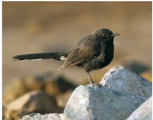
169 Glaucous-winged Gull / Beringmeeuw Larus glaucescens , fifth calendar-year, Århus, Jylland, Denmark, 21 February 2010 170 Long-tailed Jaeger / Kleinste Jager Stercorarius longicaudus , with Black-headed Gull / Kokmeeuw Chroicocephalus ridibundus , Mersin, Turkey, 21 December 2009 171 Greater Sand Plover / Woestijnplevier Charadrius leschenaultii , Ragusa, Sicily, Italy, 30 December 2009 cf Dutch Birding 32: 56, 2010 172 Black Scrub Robin / Zwarte Waaierstaart Cercotrichas podobe , Wadi Gemal, Egypt, 2 March 2010

first stayed here on 13-15 December 2007. In Spain, the long-staying Pied-billed Grebe Podilymbus podiceps at Begonto, Lugo, first found on 23 August 2007 was still present on 2 March. In the Azores, four remained on São Miguel through February (cf Dutch Birding 32: 54, 2010). In Ireland, singles were seen at Lough Gur, Limerick, from 20 February into March and at Lough Atedaun, Clare, from 6 March.