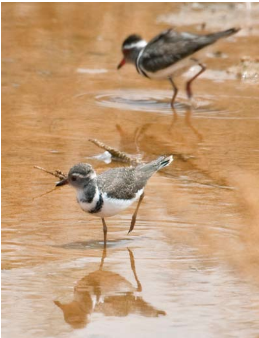
160 Three-banded Plovers / Driebandplevieren Charadrius tricollaris , juvenile and adult, Tut Amon, Aswan, Egypt, 30 April 2009 (Vincent Legrand)

and two recently fledged juveniles) actively foraging on the mudflat. We immediately started to take photographs but were rapidly interrupted by military guards requesting us to leave the area. In fact, we later learnt that the fishponds are situated within the highly protected area of the Aswan High Dam and that access is not permitted for civilians (and apparently with no possibility to obtain any kind of entry permit); obviously, the guard at the entrance had mistakenly opened the gate! Because of the fact that the juveniles had recently fledged (based on their very fresh plumage) and that the pair had been present since 2007, it is safe to conclude that the pair had bred locally and to exclude the possibility that this or another pair had bred further south and moved northward with their young in post-breeding dispersal.