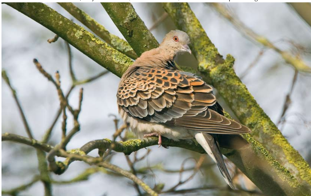
158 Westelijke Oosterse Tortel / Western Oriental Turtle Dove Streptopelia orientalis meena , adult, Wergea, Friesland, 31 januari 2010. P4 ontbrekend / p4 missing