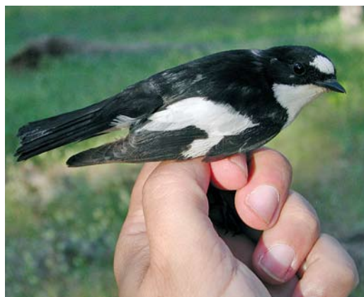
201 Atlas Flycatcher / Atlasvliegenvanger Ficedula speculigera , male, Ifrane, Morocco, 9 June 2009 (José Luis Copete). This could be a first-summer male (p2 is retained) with entirely black tail or an adult with aberrant post-breeding moult. Also note quite extensive white patch on rump. 202 Atlas Flycatcher / Atlasvliegenvanger Ficedula speculigera , adult male, Ifrane, Morocco, 9 June 2009 (José Luis Copete). Other bird than in plate 199. Note rump and entirely black tail. This bird with largest amount of white on rump, with birds in other plates showing common pattern. 203-204 Atlas Flycatcher / Atlasvliegenvanger Ficedula speculigera , adult male, Ifrane, Morocco, 9 June 2009 (José Luis Copete). Same bird as in plate 200. Rump patch showing common pattern.

pictured in that black-and-white plate, and another adult male (plate 201) with a quite extensive white patch. However, we feel that this is not the norm for speculigera , since the rest of the examined males were all showing very small or almost non-existent white rump patches. This was confirmed by close observations of 30+ individuals in the field.