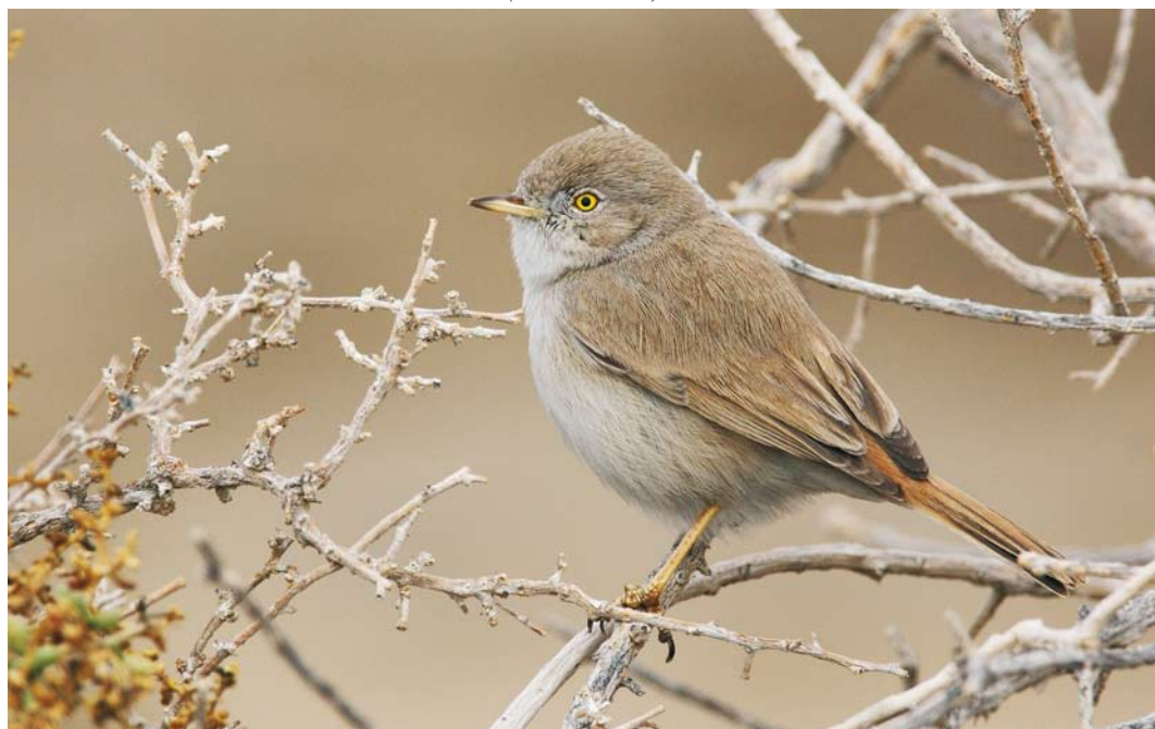
241 Asian Desert Warbler / Woestijngrasmus Sylvia nana , Dasht-e-Konar, Fars, Iran, 12 January 2009