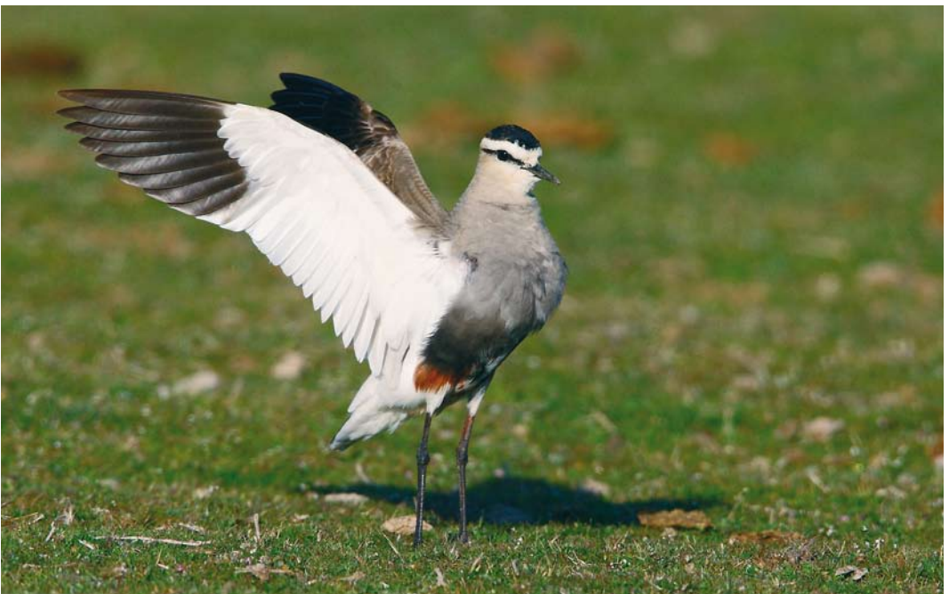
258 Sociable Lapwing / Steppekievit Vanellus gregarius , Valladolid, Castilla y León, Spain, 10 April 2010 (Juan Sagardía)