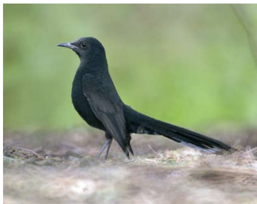
274 Pied Crow / Schildraaf Corvus albus , El Gouna, Egypt, 11 April 2010 275 Balearic Woodchat Shrike / Balearische Roodkopklauwier Lanius senator badius , west of El Kelaa, Morocco, 27 March 2010 276 Western Black-eared Wheatear / Westelijke Blonde Tapuit Oenanthe hispanica , Great Saltee Island, Wexford, Ireland, 15 May 2010 277 Black Scrub Robin / Zwarte Waaierstaart Cercothrichas podobe , Ofira Park, Eilat, Israel, 7 April 2010

were found in Vardø, Finnmark, Norway, on 10 May and at Sørvágur, Vágur, Faeroes, on 12 May (second for Faeroes this year). Laughing Gulls Larus atricilla occurred at Porthcawl, Glamorgan, Wales, on 13 March, at Quart de Poblet, València, Spain, on 6 April and at Oued Souss, Morocco, on 19 April (two). In Spain, an adult Franklin's Gull L. pipixcan stayed at Quart de Poblet dump, València, on 6-22 April. On 10 May, an adult Audouin's Gull L. audouinii was photographed when flying past over Grône, Valais, Switzerland. The third Yellow-legged Gull L. michahellis for Iceland photographed on Heimaey during 1-7 May was identified as an Atlantic Yellow-legged Gull L. m. atlantis . A good candidate Heuglin's Gull L. heuglini for Norway was a third-calendar-year photographed at Øra, Frederikstad, Østfold, on 24 April ( www.talk.gull-research.org/viewtopic.php?f=13&t=276&p=1099#p1099 ). In the Azores, a second-winter Smithsonian Gull L. smithsoni-