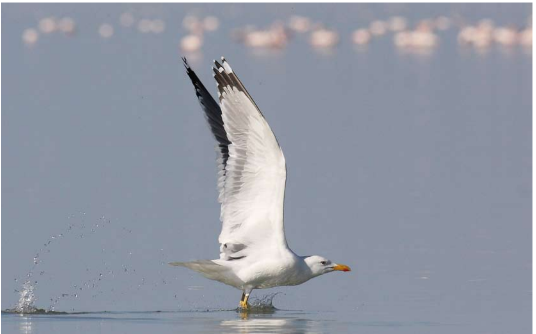
223 Baraba Gull / Barabameeuw Larus (cachinnans) barabensis , Gomishan, Golestan, Iran, 26 January 2009