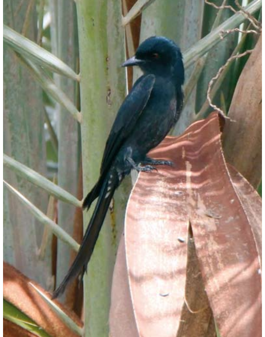
285 Pallid Swift / Vale Gierzwaluw Apus pallidus (left) and Alpine Swift / Alpengierzwaluw A. melba , Kessingland, Suffolk, England, 28 March 2010 ( Rebecca Nason ) 286 Ashy Drongo / Grijze Drongo Dicrurus leucophaeus , Jahra farms, Kuwait, 10 April 2010 ( Abdulrahman Al-Sirhan ) 287 Semicollared Flycatcher / Balkanvliegenvanger Ficedula semitorquata , female, Cabrera, Balearic Islands, Spain, 27 April 2010 ( David Cuenca )