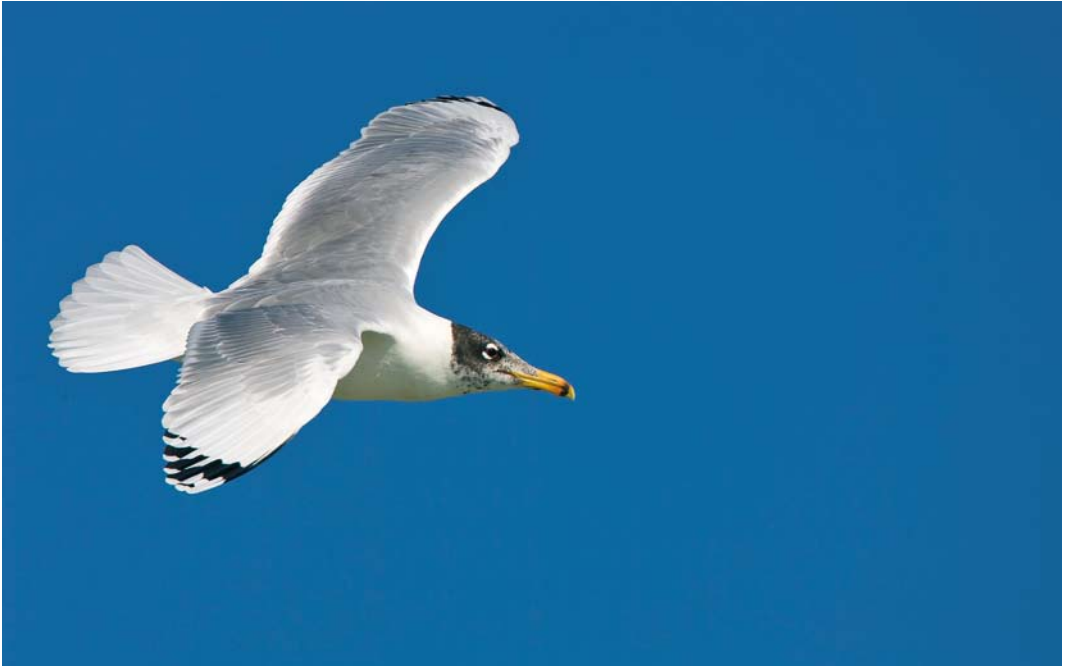
222 Pallas's Gull / Reuzenzwartkopmeeuw Larus ichthyaetus , Helleh delta, Bushehr, Iran, 16 January 2009