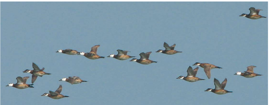
230 Amur Falcon / Amoerroodpootvalk Falco amurensis , first-winter, 15 km east of Chabahar Sistan Baluchestan, Iran, 24 January 2009 (Maarten Pieter Lantsheer) 231 Eastern Rock Nuthatch / Grote Rotsklever Sitta tephronota tephronota , Almehr valley, Golestan, Iran, 22 January 2009 (Edwin Winkel) 232 Eurasian Eagle-Owl / Oehoe Bubo bubo , Gomishan, Golestan, Iran, 19 January 2009 (Edwin Winkel) 233 Black-throated Loon / Parelduiker Gavia arctica , Jask, Hormuzgan, Iran, 19 January 2009 (Mark Zekhuis) 234 White-headed Ducks / Witkopeenden Oxyura leucocephala , Gorgan bay, Mazandaran, Iran, 20 January 2009 (Mervyn Roos)