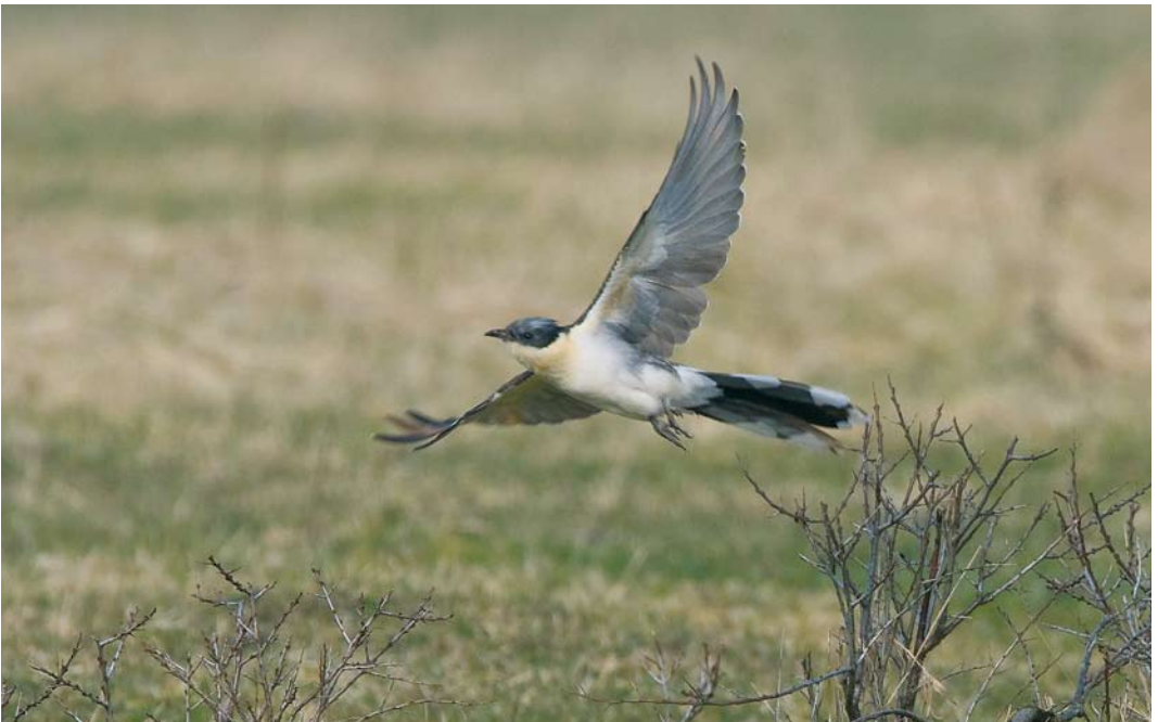
304 Kuifkoekoek / Great Spotted Cuckoo Clamator glandarius , Lentevreugd, Wassenaar, Zuid-Holland, 24 maart 2010 ( René van Rossum )