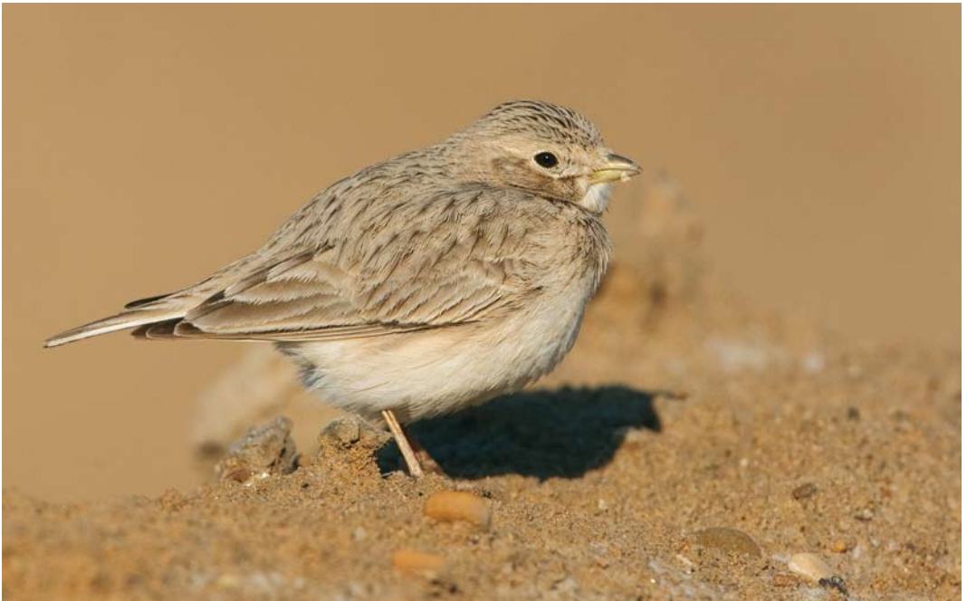
239 Indian Short-toed Lark / Indische Zandleeuwerik Calandrella raytal , Bander-e-Pol, Hormuzgan, 17 January 2009 (Arie Ouwerkerk)