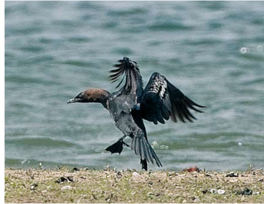
314 Dwergaalscholver / Pygmy Cormorant Phalacrocorax pygmeus , Ooijpolder, Gelderland, 16 mei 2010 (Toy Janssen)

Pas op vrijdag 14 mei werd de vogel weer gemeld toen hij om 09:40 in noordoostelijke richting over de