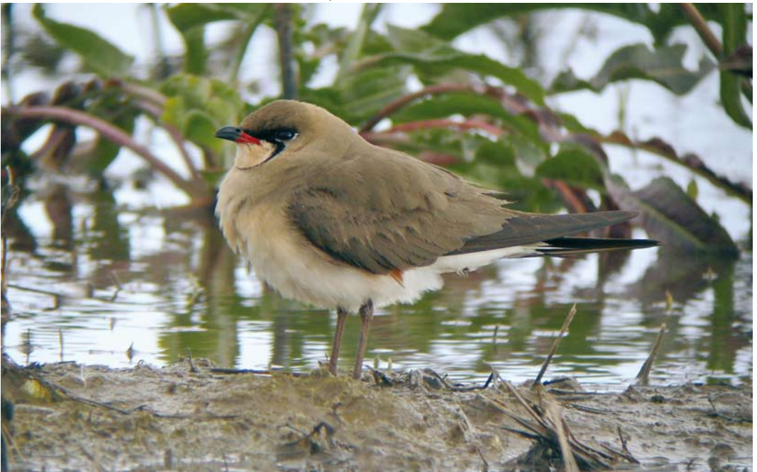
256 Oriental Pratincole / Oosterse Vorkstaartplevier Glareola maldivarum , Frampton Marsh, Lincolnshire, England, 12 May 2010