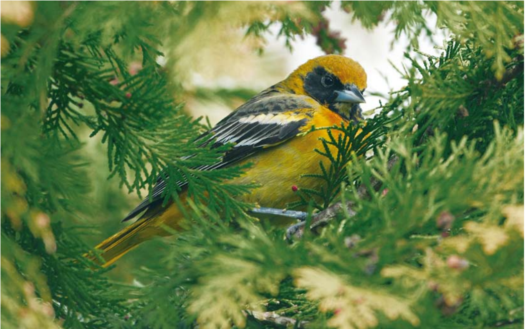
303 Baltimoretroepiaal / Baltimore Oriole Icterus galbula , eerste-winter mannetje ruiend naar eerste-zomer, Oudorp, Alkmaar, Noord-Holland, 11 april 2010