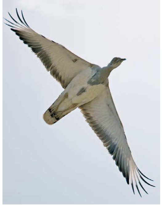
227 Masked Booby / Maskergent Sula dactylatra , Khoor-e Chal, Hormuzgan, Iran, 15 January 2009 228 Macqueen's Bustard / Oostelijke Kraagtrap Chlamydotis macqueenii , Mond protected area, Bushehr, Iran, 20 January 2009 229 Crested Honey Buzzard / Aziatische Wespendiff Pernis ptilorhyncus , adult male, Bandzark, Hormuzgan, Iran, 24 January 2009