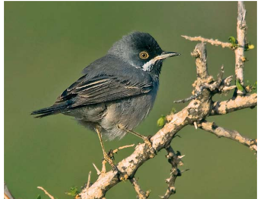
278 Iberian Pied Flycatcher / Iberische Bonte Vliegenvanger Ficedula hypoleuca iberiae , Touroug, Morocco, 10 April 2010 279 African Desert Warbler / Afrikaanse Woestijngasmus Sylvia deserti , Migra Ferha, Malta, 22 April 2010 280 Rüppell's Warbler / Rüppells Grasmus Sylvia rueppelli , Cabrera, Balearic Islands, Spain, 21 April 2010 281 Rüppell's Warbler / Rüppells Grasmus Sylvia rueppelli , Linosa, Sicily, Italy, 31 March 2010

first for Iceland since 2004. In Ireland, the Forster's Tern S forsteri at Nimmo's Pier, Galway, from 11 November 2009 stayed until at least 23 April; the one in Wexford returned at Tacumshin for another summer from 8 May.