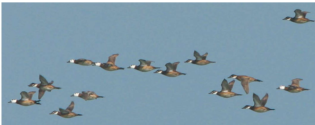
230 Amur Falcon / Amoerroodpootvalk Falco amurensis , first-winter, 15 km east of Chabahar Sistan Baluchestan, Iran, 24 January 2009 (Maarten Pieter Lantsheer) 231 Eastern Rock Nuthatch / Grote Rotsklever Sitta tephronota tephronota , Alneh valley, Golestan, Iran, 22 January 2009 (Edwin Winkel) 232 Eurasian Eagle-Owl / Oehoe Bubo bubo , Gomishan, Golestan, Iran, 19 January 2009 (Edwin Winkel) 233 Black-throated Loon / Parelduiker Gavia arctica , Jask, Hormuzgan, Iran, 19 January 2009 (Mark Zekhuis) 234 White-headed Ducks / Witkopeenden Oxyura leucocephala , Gorgan bay, Mazandaran, Iran, 20 January 2009 (Mervyn Roos)