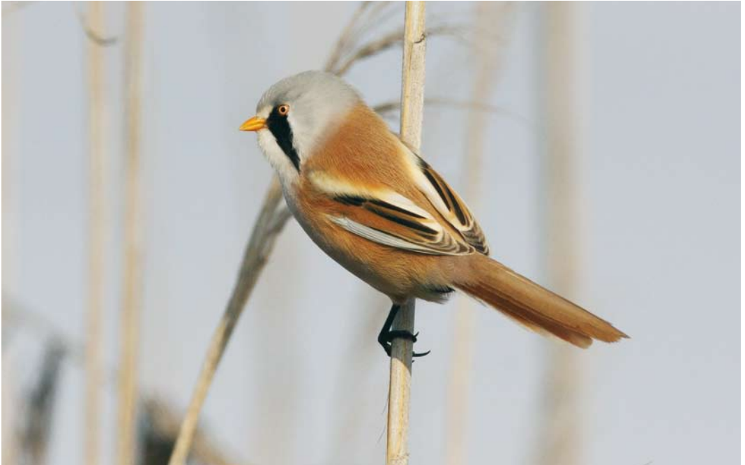
238 Bearded Reedling / Baardman Panurus biarmicus russicus , Gomishan, Golestan, Iran, 24 January 2009 (Edwin Winkel)