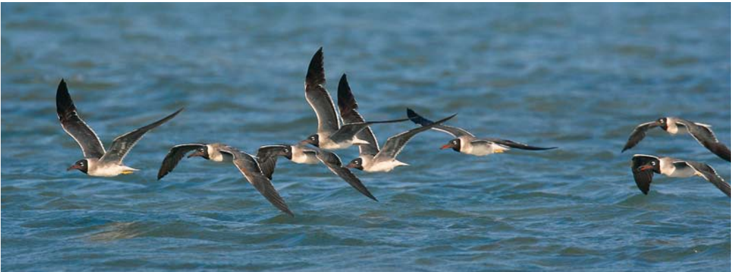
36 Sooty Gull / Hemprichs Meeuw Larus hemprichii , second-winter, El Gouna, Egypt, 11 October 2007 ( Edwin Winkel ). Note dark tail-band and pale greenish bill. Compared with White-eyed Gull L. leucophthalmus , Sooty is a more powerful flyer, with steady and direct flight. 37 White-eyed Gull / Witoogmeeuw Larus leucophthalmus , second-summer, El Gouna, Egypt, 14 May 2007 ( Edwin Winkel ). As adult but brownish hood still showing some white flecking. Bill predominantly dark and collar grey instead of strikingly white. Tail still showing some black markings. 38-39 White-eyed Gulls / Witoogmeeuwen Larus leucophthalmus , El Gouna, Egypt, 3 September 2009 ( Edwin Winkel ). Flight of White-eyed is swinging, playful and elegant like a tern. Note distinctive pale leading edge of wing, which is always absent in Sooty.