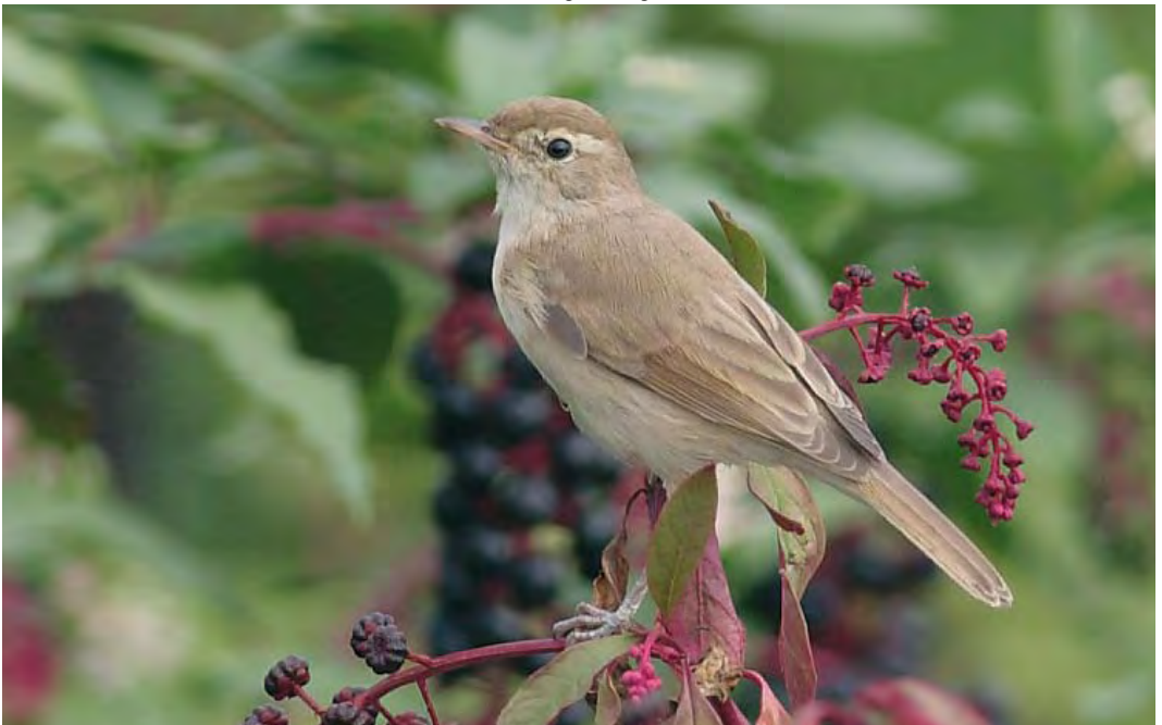
474 Booted Warbler / Kleine Spotvogel Iduna caligata , Rize, Rize, Turkey, 5 September 2010