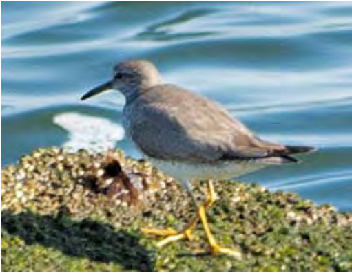
441 Siberische Grijsze Ruiters / Grey-tailed Tattler Tringa brevipes , IJmuiden, Noord-Holland, 28 juli 2010

sen suggereert dat veel vogels de afstand tussen Japan en Australië non-stop overbruggen (Bamford et al 2008).