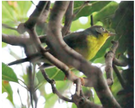
430 White-eyed Vireo / Witoogvireo Vireo griseus , Ribeira da Lapa, Corvo, Azores, 24 October 2008 (Edward Verduyze) 431 Hooded Warbler / Monnikszanger Wilsonia citrina , male, Cancelas, Corvo, Azores, 11 October 2008 (Dominic Mitchell) 432 American Redstart / Amerikaanse Roodstaart Setophaga ruticilla , Ribeira da Ponte, Corvo, Azores, 17 October 2009 (David Monticelli) 433 Canada Warbler / Canadazanger Wilsonia canadensis , Fojo, Corvo, Azores, 12 October 2009 (Olof Jönsson)