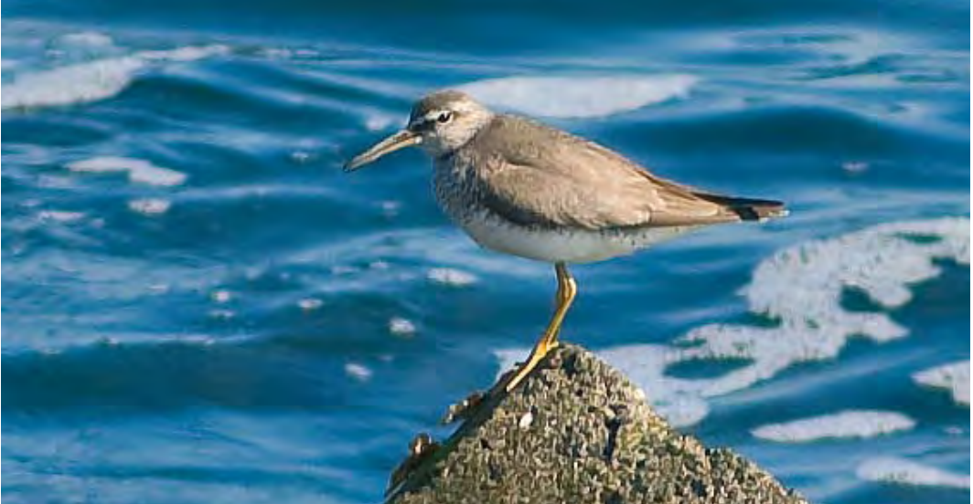
438 Siberische Grijs Ruiters / Grey-tailed Tattler Tringa brevipes , IJmuiden, Noord-Holland, 28 juli 2010 (Arno Piek)