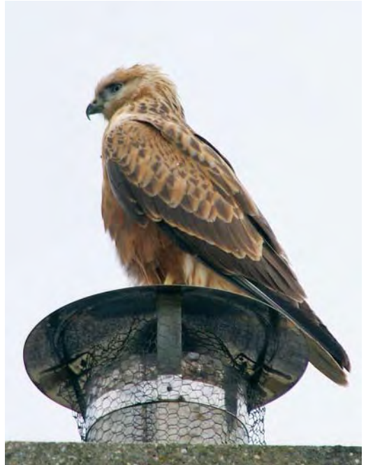
487 Zeearend / White-tailed Eagle Haliaeetus albicilla , Biesbosch, Noord-Brabant, 21 augustus 2010 488-489 Arendbuiserd / Long-legged Buzzard Buteo rufinus , juveniel, De Krim, Texel, Noord-Holland, 13 juli 2010