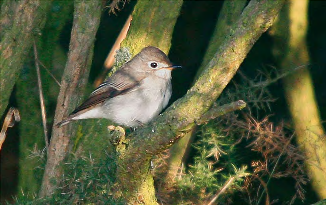
479 Asian Brown Flycatcher / Bruine Vliegenvanger Muscicapa dauurica , Buckton, East Yorkshire, England, 5 September 2010 ( John Harwood )