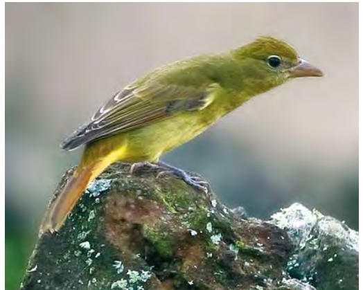
420 Myrtle Warbler / Mirtezanger Dendroica coronata , lighthouse valley, Corvo, Azores, 26 October 2008 (David Monticelli) 421 American Yellow Warbler / Gele Zanger Dendroica petechia , Ribeira da Ponte, Corvo, Azores, 15 October 2009 (Peter Alfrey) 422 Black-throated Blue Warbler / Blauwe Zwartkeelzanger Dendroica caerulescens , Ribeira do Cantinho, Corvo, Azores, 28 October 2006 (Vincent Legrand) 423 Summer Tanager / Zomertangare Piranga rubra , first-winter, middle fields, Corvo, Azores, 28 October 2006 (Vincent Legrand)

rensis , Eurasian Blackcaps Sylvia atricapilla gularis , Common Starlings Sturnus vulgaris granti , House Sparrows Passer domesticus , Azores Chaffinches Fringilla coelebs moreletti , Atlantic Canaries Serinus canaria and smaller numbers of European Goldfinch Carduelis carduelis parva (contra Clarke 2006). There is also a small population of Eurasian Woodcock Scolopax rusticola , mainly in the eastern valleys. Common Snipe Gallinago gallinago breeds in the caldera (or caldeira), from where there is also a breeding record of Northern Wheatear Oenanthe oenanthe (Hering & Hering 2006ab). A regular hybrid flock of Mallard A platyrhynchos and American Black Duck A rubripes commutes between the caldera and the neighbouring island of Flores.