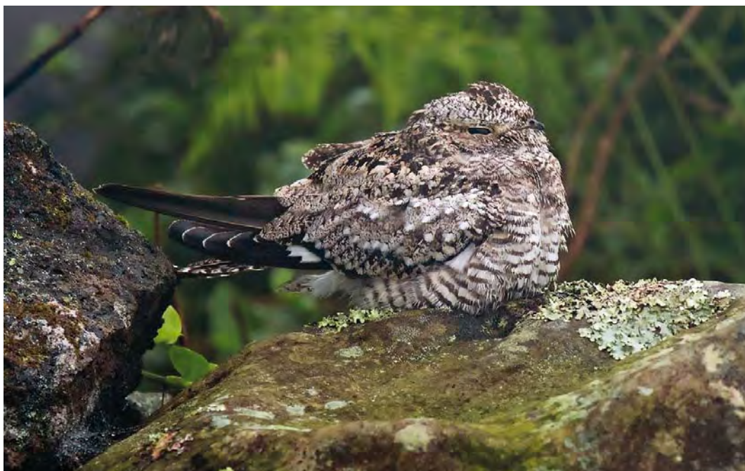
412 Common Nighthawk / Amerikaanse Nachtzwaluw Chordeiles minor , juvenile, main road to lighthouse, Corvo, Azores, 25 October 2007