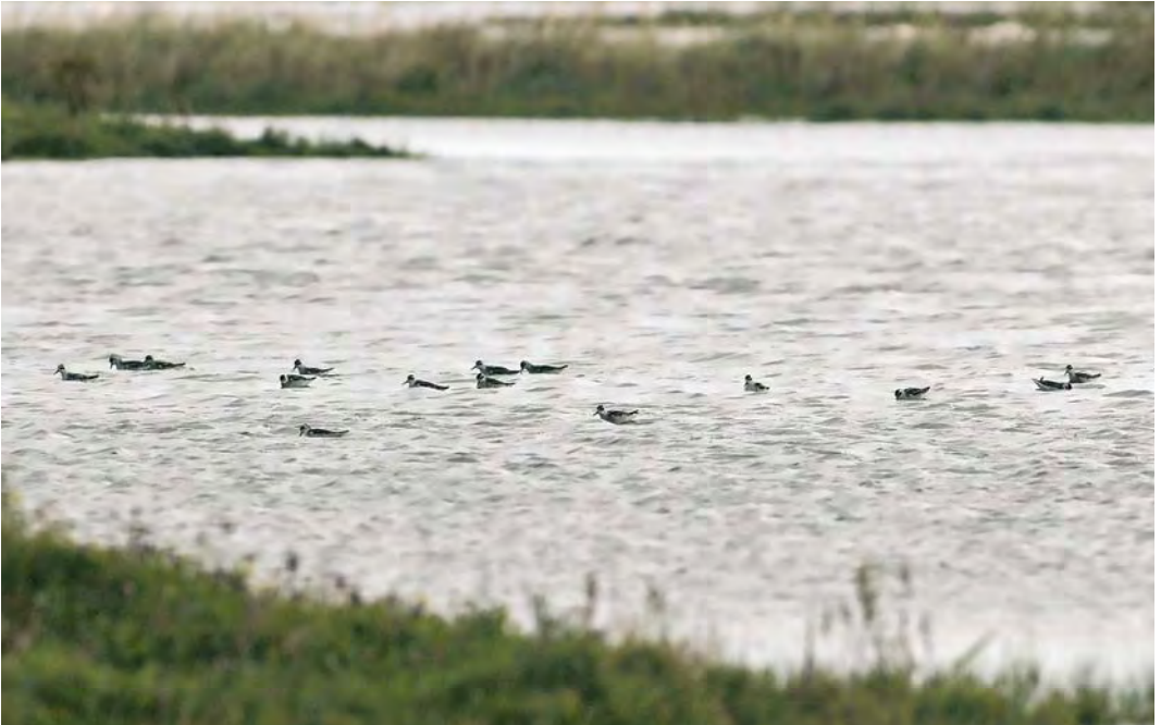
485 Grauwe Franjepoten / Red-necked Phalaropes Phalaropus lobatus , Mariëndal, Den Helder, Noord-Holland, 30 augustus 2010