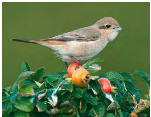
461 Red-footed Booby / Roodvoetgent Sula sula , Estepona, Málaga, Spain, 11 August 2010 462 Red-necked Stint / Roodkeelstrandloper Calidris ruficollis , adult, Grenen, Skagen, Nordjylland, Denmark, 11 August 2010 463 Sharp-tailed Sandpiper / Siberische Strandloper Calidris acuminata , adult, Lugar de Baixo, Madeira, 29 August 2010 464 Little Curlew / Kleine Regenwulp Numenius minutus , Nieuwmunster, West-Vlaanderen, Belgium, 18 September 2010 465 Possible African Cormorant / mogelijke Afrikaanse Aalscholver Phalacrocorax carbo lucidus , juvenile, IJzermonding, West-Vlaanderen, Belgium, 8 August 2010 466 Daurian Shrike / Daurische Klauwier Lanius isabellinus , adult female, Den Helder, Noord-Holland, Netherlands, 5 September 2010