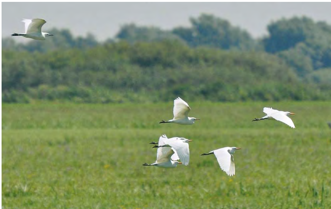
483 Koereigers / Cattle Egrets Bubulcus ibis , juveniel (links) en adulte, Sliedrechtse Biesbosch, Zuid-Holland, 20 augustus 2010 (Marco Vriens)