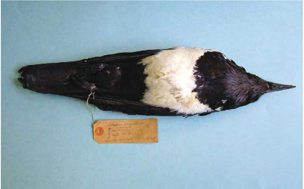
452 Pied Crow / Schildraaf Corvus albus (collected at Jalo oasis, Al Wahat, Libya, on 24 April 1931), Museo Civico di Storia Naturale Giacomo Doria, Genova, Italy, 26 February 2009 (Enrico Borgo)