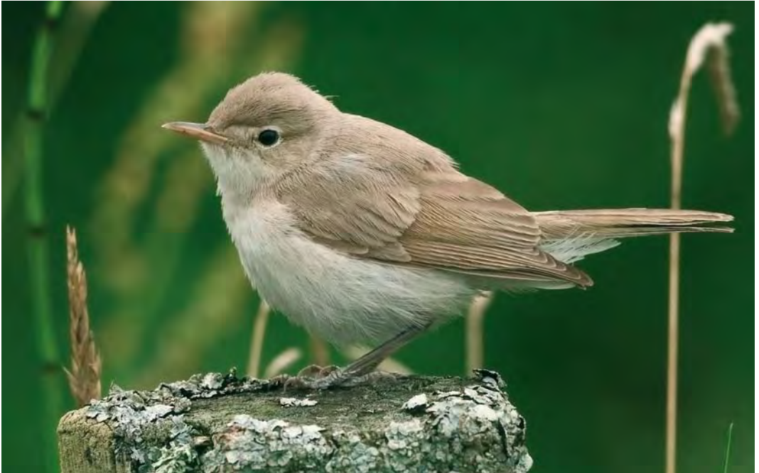
473 Sykes's Warbler / Sykes' Spotvogel Iduna rama , Burrafirth, Unst, Shetland, Scotland, 16 August 2010 (Alistair Wilson)