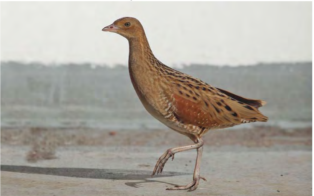
486 Kwartelkoning / Corn Crake Crex crex , juveniel, Noordzee ten westen van Zuid-Holland, Continentaal Plat, 28 augustus 2010