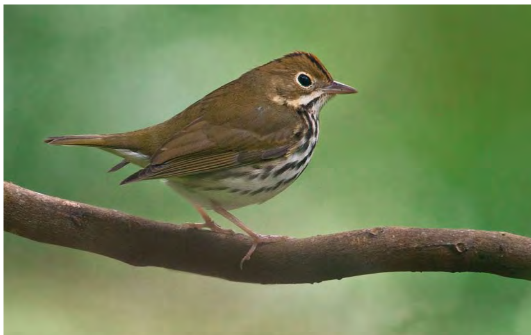
427 Ovenbird / Ovensvogel Seiurus auricapilla , first-winter, Fojo, Corvo, Azores, 15 October 2009