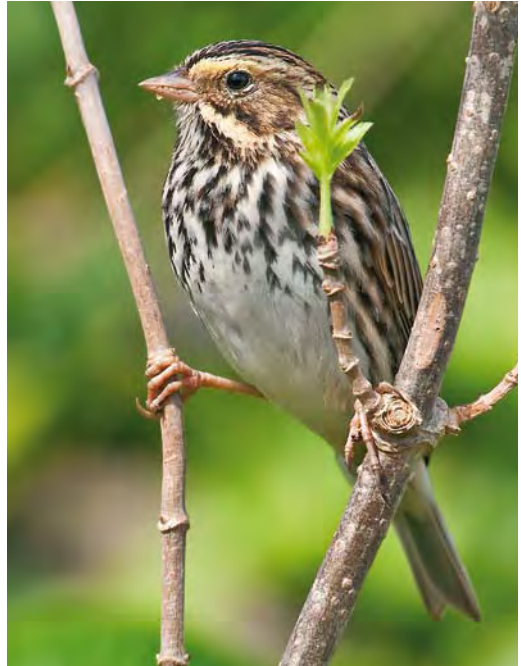
413 Black-and-white Warbler / Bonte Zanger Mniotilta varia , first-winter male, Ribeira da Ponte, Corvo, Azores, 6 October 2009 ( Rafael Armada ) 414 Savannah Sparrow / Savannahgors Passerculus sandwichensis , first-winter male, high fields, Corvo, Azores, 29 October 2009 ( Vincent Legrand ) 415 Yellow-billed Cuckoo / Geelsnavelkoekoek Coccyzus americanus , first-winter, middle fields, Corvo, Azores, 19 October 2009 ( Vincent Legrand )