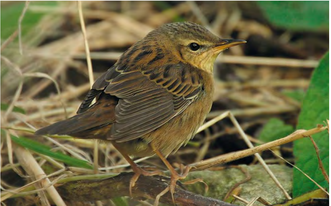
472 Pallas's Grasshopper Warbler / Siberische Sprinkhaanzanger Locustella certhiola , Fair Isle, Shetland, Scotland, 23 September 2010