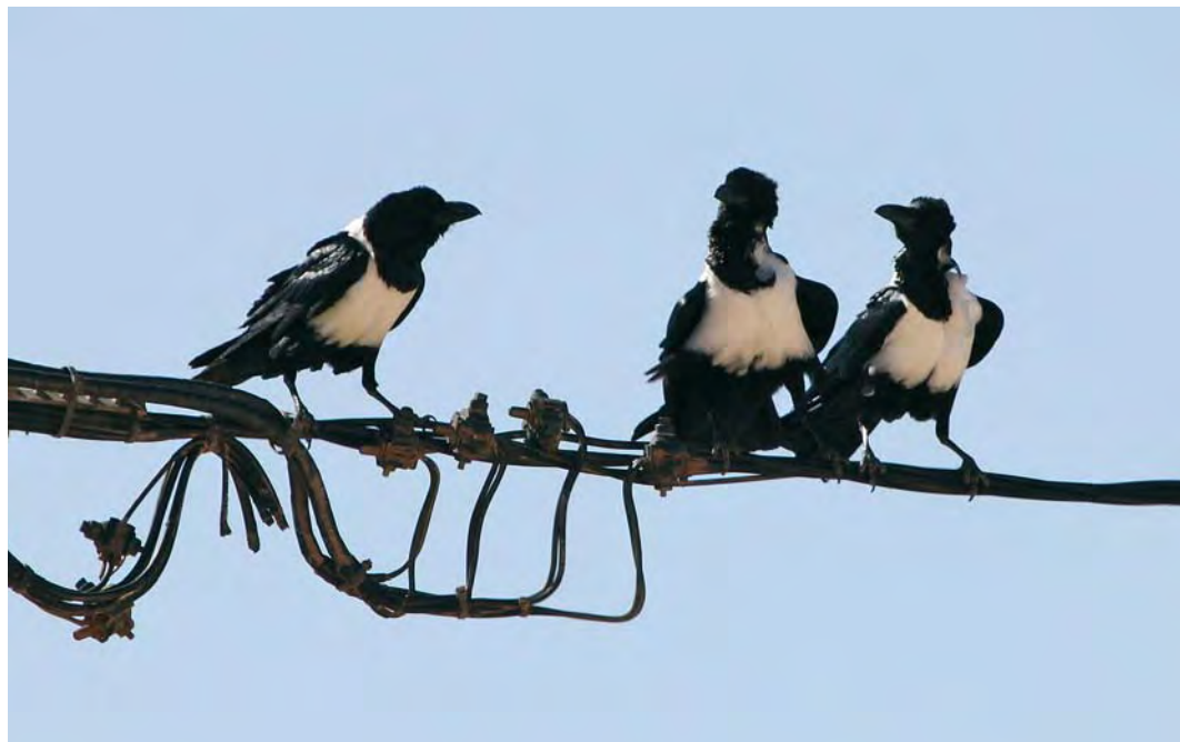
448 Pied Crows / Schildraven Corvus albus , 152 km north-east of Dakhla, Western Sahara, Morocco, 13 December 2009 (Stuart Piner)

with an obvious gape patch were seen, proving that the breeding attempt had been successful (Richard Bonser, Josh Jones, Oliver Metcalf and Plop Pointon; www.go-south.org ).